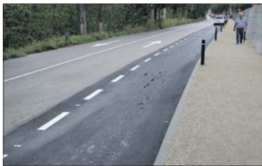
El camino y la zona de aparcamiento.

Las obras empezaron a principios de agosto. El proyecto fue el más votado en los presupuestos participativos de 2021. La complejidad de la actuación, debido a que el terreno pertenece a la Junta de Compensación de Can Xiquet, provocó que las obras no se pudieran llevar a cabo hasta ahora. El nuevo camino,