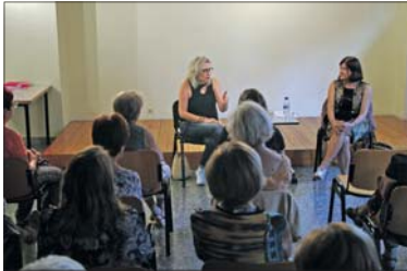
Núria Pradas, durante el Club de lectura del día 20.

La Biblioteca de La Llagosta inició el día 20 las actividades para adultos del curso 2023-2024. Una edición del Club de lectura, con la presencia de la escritora Núria Pradas, sirvió para inaugurar el curso. La sala de exposiciones de Can Pelegrí se llenó durante el acto. Las personas asistentes pudieron comentar con su autora la novela La vida secreta de Sylvia Nolan . Además de este Club de lectura, la Biblioteca ha preparado otras dos sesiones del Club de lectura. Una será en octubre, previa a la salida al Teatro Nacional de Cataluña (TNC) para ver la obra La plaza del Diamante , de Mercè Rodoreda. El Club de lectura del mes de noviembre estará dedicado a la obra El tiempo de las moscas , de Laura Piñeiro. En octubre también está programado presentar el libro Wannaji. Cinco mujeres