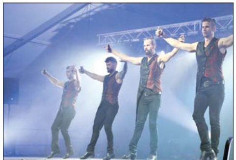
Espectáculo de Los Vivancos.