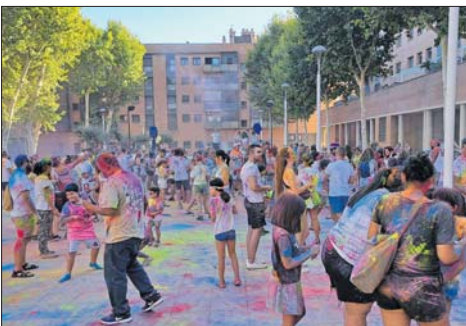
Fiesta Holi Gigante, con la Colla Gegantera.