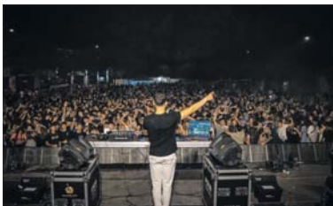
The End of Summer, con la Associació de DJ's VIPS.