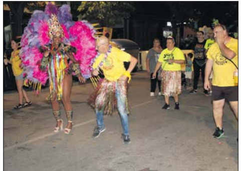
Tropical party night de los Saltats.