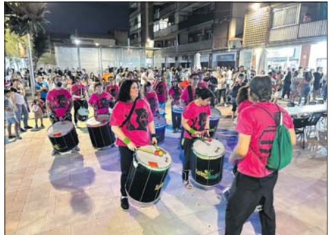
Corretasques, con el grupo La Feria y Lotokotó.