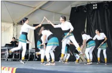
Una de las actuaciones del Homenaje a Cataluña.

Posteriormente, se hizo la tradicional izada de la senyera en el Ayuntamiento para celebrar la Diada Nacional de Catalunya. Miembros de Protección Civil de La Llagosta izaron la bandera mientras se oía Els Se-