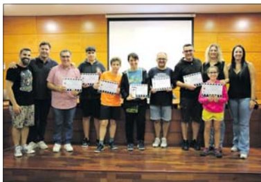
Los ganadores del Rally Fotográfico.

El Rally Fotográfico Fiesta Mayor se celebró el 11 de septiembre en el marco de la