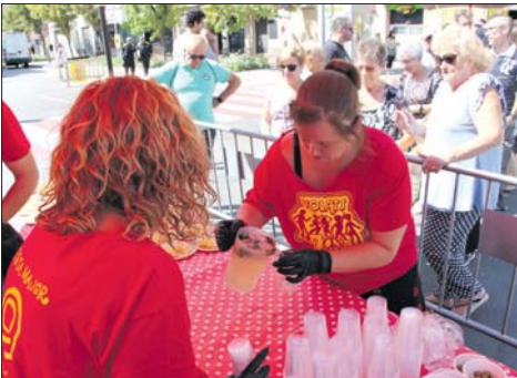
Rebujitada popular de los Volats.