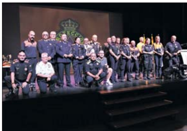
Una de las imágenes de la jornada.

La celebración se inició a las once de la mañana con una exposición de diferentes vehículos de emergencia en la calle Estació. Poco después,