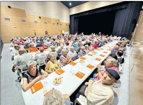
Homenaje a la gente mayor de la Casa de Andalucía.