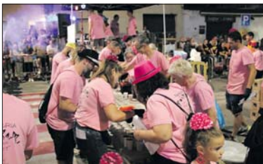
Sangriada, con los Sangrinaris.