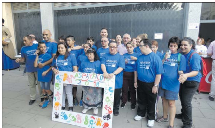
Una de les imatges de la inauguració.

Dissabte, va ser inaugurada la nova seu d'Aspayfacos, l'entitat llagostenca que aplega persones amb diversitat funcional i els seus familiars. El local és un immoble cedit per l'Ajuntament de la Llagosta i es troba a l'avinguda del Turó, número 20, a l'alçada de la plaça de Cinto Pagès. L'acte va comptar amb força assistència de públic. A la inauguració va participar la Colla Gegantera, que va portat dos gegants, la Mariona i en Llago. Les Llagostes de l'Avern també van prendre part a l'acte amb la seva bèstia de foc, l'Espurna, i van fer una demostració de foc. La presi-