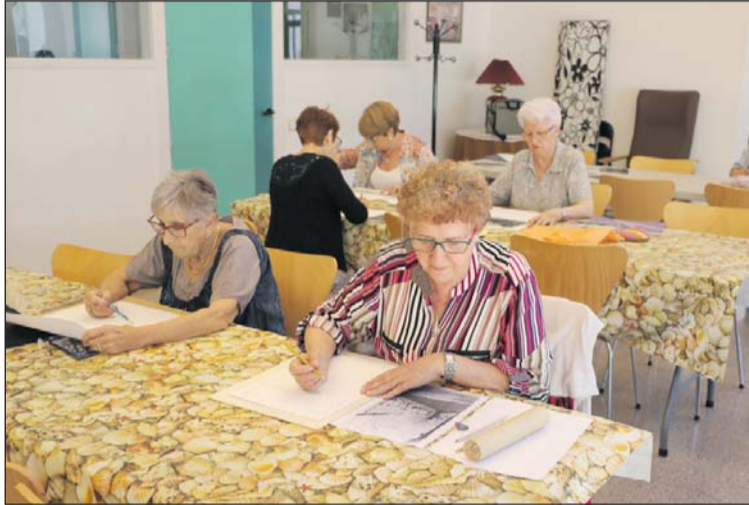
Taller de pintura i dibuix del Casal d'Avis.

Un any més, els usuaris del Casal d'Avis podran assistir a un taller d'entrenament de la memòria, al d'acolorir mandales, al grup de lectura Llegim i compartim, al taller Mirar, llegir, pensar i imaginar, al de dibuix i pintura, al de treballs manuals, al de teatre amb el grup l'Alegria de viure, al de gimnàstica i al Voluntariat per la llengua. Aquest any, com a novetat, s'incorpora el taller Envel·lir bé, viure amb vitalitat. Què és envellir bé?, Què és més important a l'hora d'envellir: la herència o l'ambient? Podem intervenir sobre el nostre propi envelliment? Sobre aquestes i altres