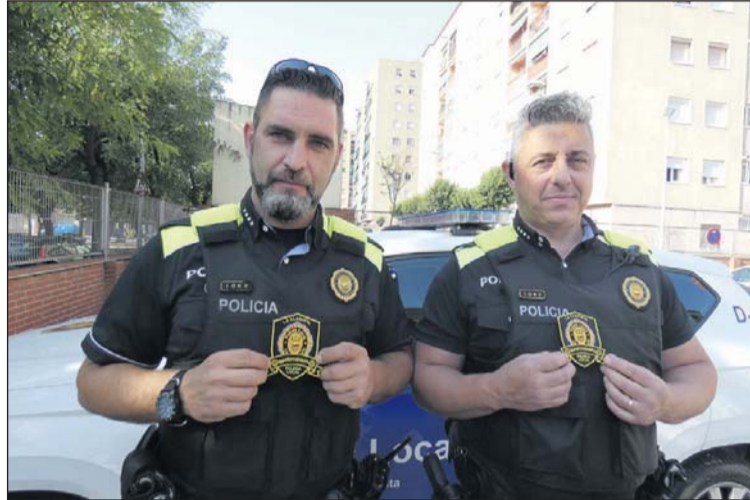
Dos agents, amb els escuts solidaris.

Els agents llagostencs ofereixen els escuts solidaris a canvi d'un donatiu de quatre euros, que es destinaran a aquesta iniciativa. Els escuts es poden adquirir a la Comissaria de la Policia Local i als establiments col·laboradors, que tenen un distintiu a les seves portes. Els escuts solidaris han estat impulsats per les policies locals de Caldes de Malavella, Hostalric i Sant Celoni i ja són