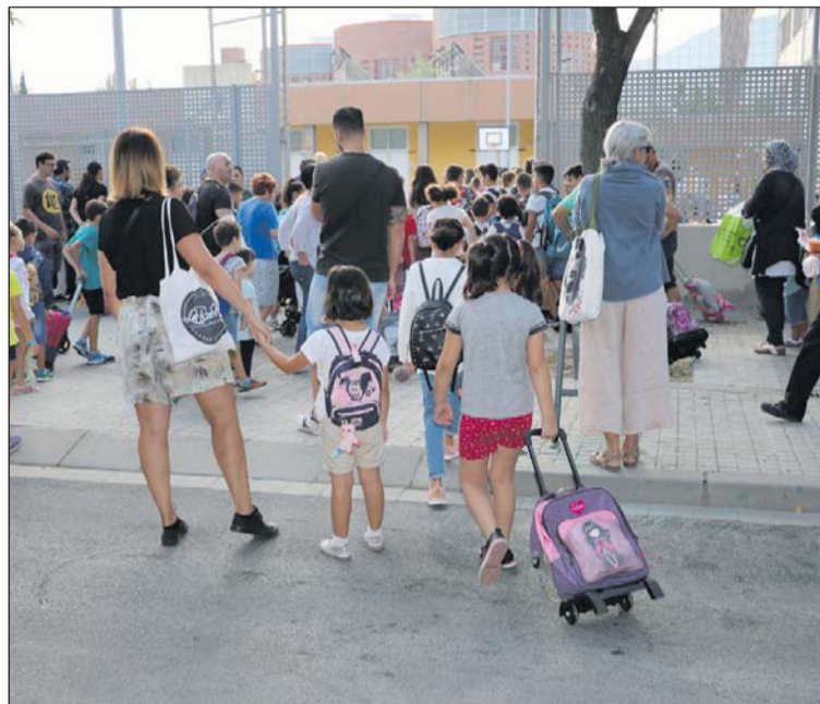
Entrada a l'Escola Joan Maragall el 12 de setembre.

El curs escolar 2018-2019 va començar el 12 de setembre amb total normalitat a la Llagosta. Als centres educatius de la nostra localitat s'han matriculat més de 2.300 alumnes. Aquest any, es mantenen les sis línies de P3. L'Escola Sagrada Família compta amb 385 alumnes; el Joan Maragall, amb 425; les Planes, amb 367; i la Gilpe amb 219. En Educació Secundària Obligatòria, la Balmes té 129 estudiants, i l'Institut Marina, 482. A més, aquest darrer centre compta amb 72 alumnes matriculats en Batxillerat i un centenar en Cicles Formatius de Grau Mitjà i Superior.