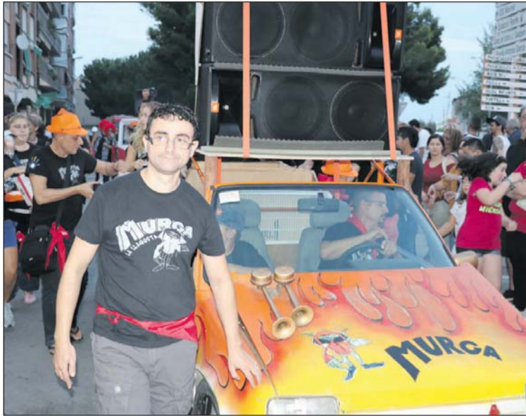
Alguns dels membres de la Murga durant la Festa Major.

També va aconseguir diners durant els actes que va muntar durant la Festa Major, com la Paella Popular, la Diada infantil, el Concurs de truites i el rom cremat de les havaneres. A la Murga Tapa, que es va fer amb la col·laboració dels establiments hostalers Donde El Pepe i Vostra Vite, va obtenir 1.093 euros.