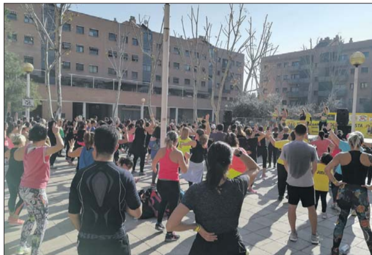
La Zumba Gegant de l'any passat.

El preu dels tiquets és de vuit euros, si es compren de forma anticipada, i de deu euros, el mateix dia de la Zumba Gegant. El preu inclou pulsera, aigua i samarreta. Per als infants de fins a 12 anys, el preu és de sis euros i també inclou pulsera, aigua i samarreta. La jornada solidària començarà a les 10 hores amb una ac-