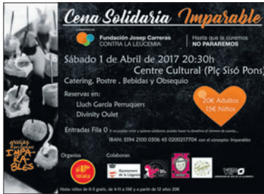
Cartell anunciador del sopar.

Ja es poden fer reserves per al sopar solidari que organitzarà l'1 d'abril la colla dels Volats al Centre Cultural de la plaça de l'Alcalde Sisó Pons. L'acte forma part de la campanya que porta a terme aquest grup per recaptar fons per a la investigació sobre la leucèmia. La iniciativa compta amb el suport i col·laboració de la Fundació Josep Carreras, que serà l'entitat destinatària dels diners que s'aconsegueixin per seguir investigant sobre aquesta malaltia.