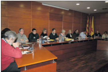
Un moment del ple ordinari de gener.

A la sessió plenària també es va aprovar per unanimitat suspendre l'hora d'acollida de la tarda de l'Escola Bressol Municipal Cucutras, un servei que pràcticament no es feia servir. Aquest horari es reconvertirà en un espai familiar, obert a la resta de la població. El nou servei, que prestarà la concessionària de la guarderia pública, la Fundació Pere Tarrés, permetrà aprofitar millor els