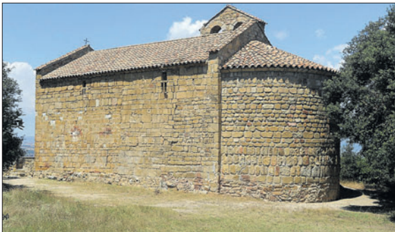
ERMITA DE SANT CEBRIÀ DE CABANYES. PARROQUIA DEL ANTIGUO TÉMINO DE CABANYES HASTA QUE ESTA PARROQUIA FUE UNIDA A LA DE SANT FOST DE CAMPSENTELLES.

Pasó por diferentes propietarios y tuvo la forma administrativa de baronía bajo la familia Sant Vicens y más tarde con los monjes cartujos de Montalegre. En esas épocas y posteriores, estas tierras que formaban una unidad