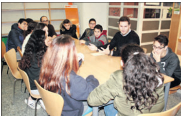
Una imatge de la trobada de l'alcalde amb un grup de joves.

Els joves també van posar sobre la taula la necessitat d'apropar a la Llagosta la parada de bus que hi ha al costat del McDonald's. L'alcalde va explicar que l'Ajuntament de Montcada i Reixac s'hi nega