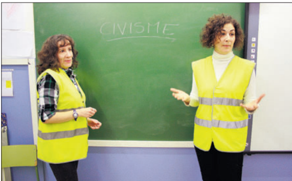
Les dues agents cíviques que fan les xerrades a les escoles.

Respecte a l'entorn natural, es tractarà sobre la importància de reduir la generació de residus. També hi haurà explica-