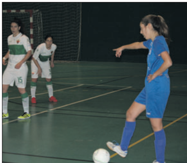
Una acció del partit contra l'Elx.