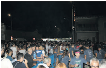
Una de les activitats de la Festa Major de 2016.

Can Pelegrí acollirà el dia 14 de febrer a les 19 hores la primera reunió de la Comissió de Festa Major de 2017 que ha convocat l'Ajuntament de la Llagosta. La trobada està oberta a tota la ciutadania. Qualsevol persona pot formar part d'aquest grup de treball. La idea és que aquest any hi hagi una única comissió i no dues, una de joventut i una altra de cultura, com passava fins ara. Tots els membres de la Comissió treballaran de forma conjunta, però si s'establiaran dues subcomissions per planificar de forma específica, per una