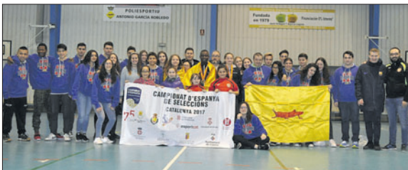
Un moment de l'homenatge als tres campions.