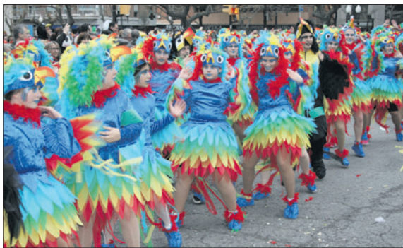
Una de les comparses premiada en el Carnaval de 2016.

El període d'inscripció per participar en aquest certamen s'obrirà el 7 de febrer. Fins al dia 23, les persones interessades a prendre part en el concurs es podran adreçar a l'Oficina d'Atenció a la Ciutadania dimarts i djous, en horari de tarda, de 16 a 20 hores. Hi haurà tres categories: una individual, formada per una o dues persones; una de comparses petites, de 3 a 15 integrants; i una de comparses grans, a partir de 16 membres. En la d'individuals, hi haurà deu premis; en la de comparses petites, cinc, i en la