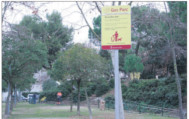
L'obra del Gos Parc està pràcticament acabada.

El Carnaval se celebrarà el dia 25 de febrer | 4