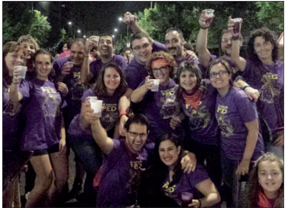
Festiva Els Sangrinaris