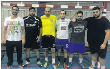
Alguns dels fitxatges del sènior masculí.

El Joventut Handbol és penúltim, mentre que la Unió Esportiva Sarrià, que ve de perdre a la pista de la Salle Bonanova Atlètic (27-25), és desena. El conjunt llagostenc s'ha reforçat aquesta temporada amb diversos jugadors amb l'objectiu de lluitar per pujar de categoria.