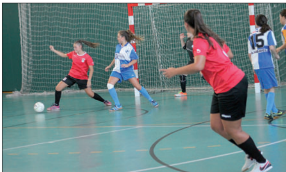
Una acció del partit de Festa Major que va jugar la Concòrdia contra el Sabadell.

La Concòrdia va començar la lliga al grup 2 de la Segona Nacional amb una victòria sobre l'Esparreguera per 1 gol a 3. El partit va ser complicat, tot i que les d'Iván Beas van dominar. Al descans, es va arribar amb un marcador de 0 a 2. A la represa del joc, l'Espar-