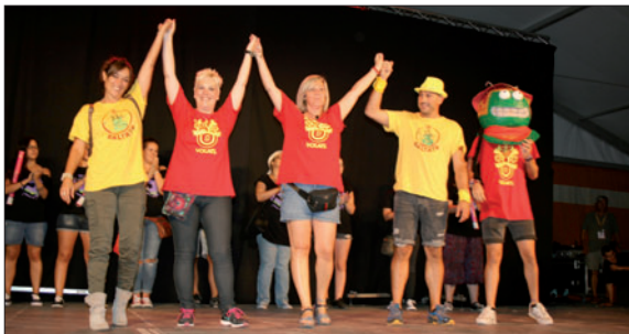
Representants dels Saltats i dels Volats, durant l'acte del veredict de l'Engreskada.

Diümenge, va començar amb el cinquè RaH! fotogràfic. El matí va tenir com a protagonista la celebració de la Diada