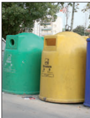
Contenedors de residus.

L'increment més notable ha estat en la fusta, ja que l'any