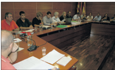
Una imatge del ple del mes de setembre.

La proposta parteix d'una moció presentada al ple de setembre per ERC a la qual es van afegir ICV-EUiA i CDC. El text va comptar amb el vot favorable del grup municipal del PSC, l'abstenció del PP i el vot en contra de C's. La moció, a més de fer referència a totes les persones represaliades pel franquisme i a les víctimes de la guerra, recorda tots els llagostencs que van defensar la llibertat al front i a aquells que es van haver d'exiliar. El document posa noms i cognoms als que van caure a la batalla, als que van morir quan fugien, als que van ser tancats a camps de concentració i als regidors del primer ajuntament democràtic de la Llagosta.