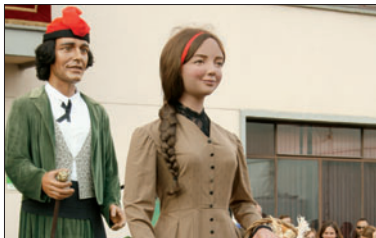
La Mariona, el dia del seu naixement.

A l'acte, es va destapar la Mariona, que tot seguit va ballar amb la Blanqueta, el Josep, la Torradeta i el Llagó. Tot seguit, hi va haver un ball de gegantones amb les colles de Canovelles i Sant Cugat del Vallès. L'acte va acabar amb l'inici de la cercavila pels carrers de la Llagosta en la qual la Mariona va fer les seves primeres passes. Nou mesos abans, els responsables