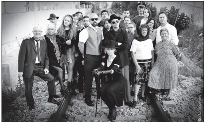
Els actors i les actrius dels grups teatrals de la Llagosta que actuaran a la Mostra 5.0.

La Murga dóna 905 euros a la Fundació 5p- | 8