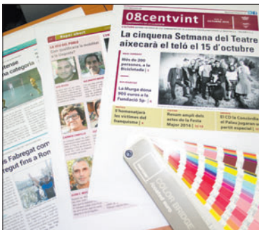
Pàgines de prova del nou disseny del 08centvint.

Les modificacions en el disseny del periòdic de la Llagosta han anat a càrrec de la Unitat d'Imatge i Comunicació de l'Ajuntament de la Llagosta.