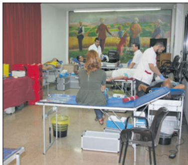
Un moment de la captació de sang de l'Engreskada 2016.

El resultat de juliol és superior a l'obtingut a la captació d'estiu de l'any passat, quan es van aconseguir 72 donacions. També hi ha un increment respecte a la captació del març, quan van donar sang 79 persones.