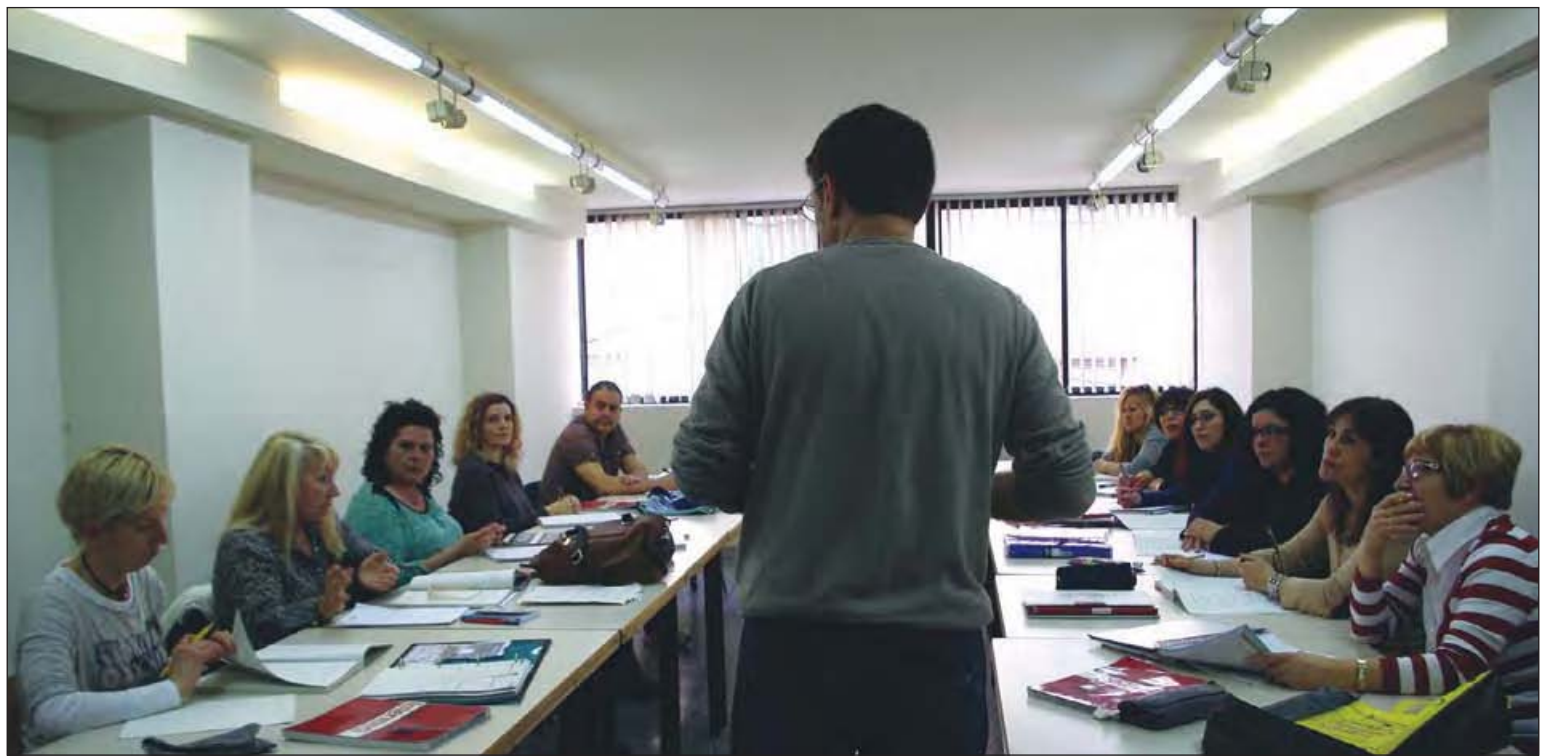
Alumnes dels cursos de català que s'imparteixen al Centre Cultural i Juvenil Can Pelegrí.

3 El 93% dels habitants de la Llagosta entenen el català i un 61% el sap parlar, segons les dades de la Generalitat