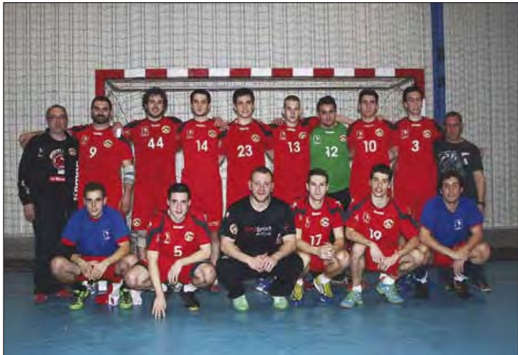
El sènior masculí del Joventut Handbol la Llagosta.

El sènior masculí del Joventut Handbol la Llagosta ha pujat a la Segona Catalana. Els llagostencs van certificar l'ascens el dissabte 8 de març després de guanyar l'Handbol Terrassa B per 34 gols a 16 durant el partit disputat al pavelló municipal Antonio García Robledo. El poliesportiu es va omplir de gom a gom per veure l'ascens