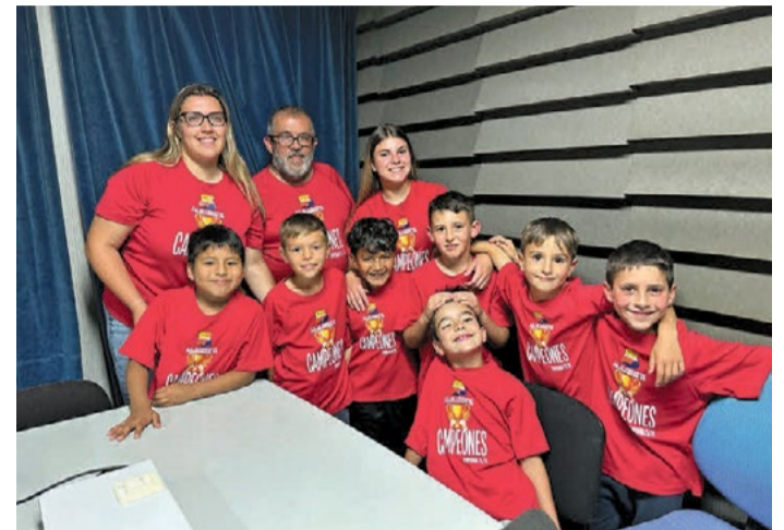
Prebenjamín B del Club Esportiu La Llagosta.