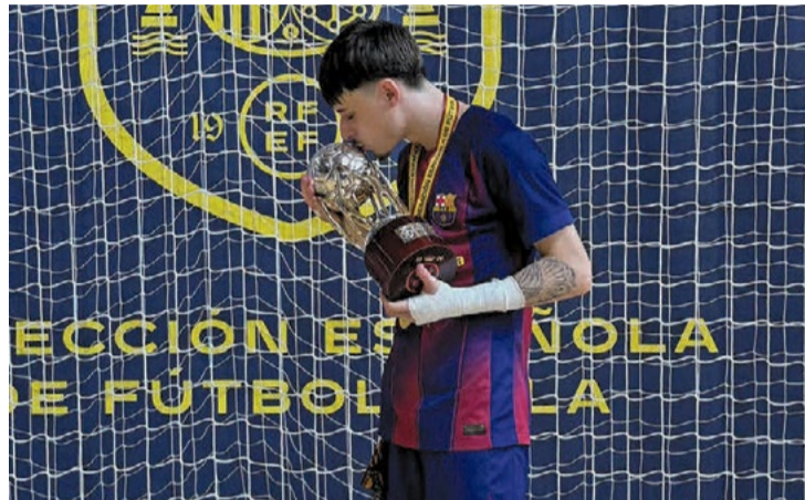
El llagostense, con el trofeo de campeones.

El camino del deportista llagostense en la fase final empezó con un triunfo ajustado contra el Móstoles por 4 a 3. En la semifinal, el Barça se impuso claramente contra el Sala 5 Martorell por 3 a 8. Ramos marcó dos goles, el 1 a 5 y el 2 a 6. En la final, el Barça ganó ante el Cartagena y pudo