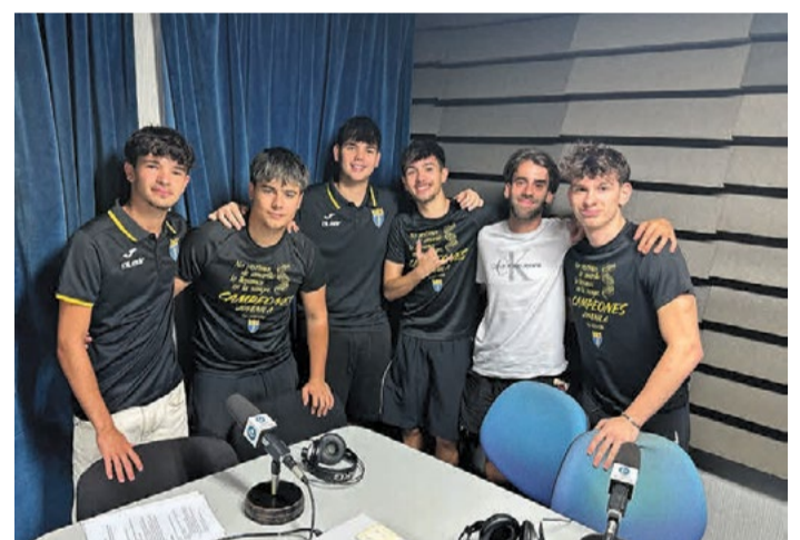
Juvenil A del Fútbol Sala Unión Llagostense.