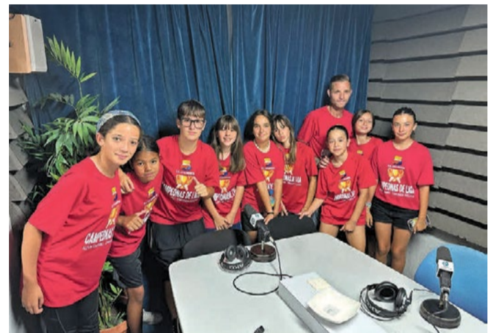
Alevín femenino del Club Esportiu La Llagosta.