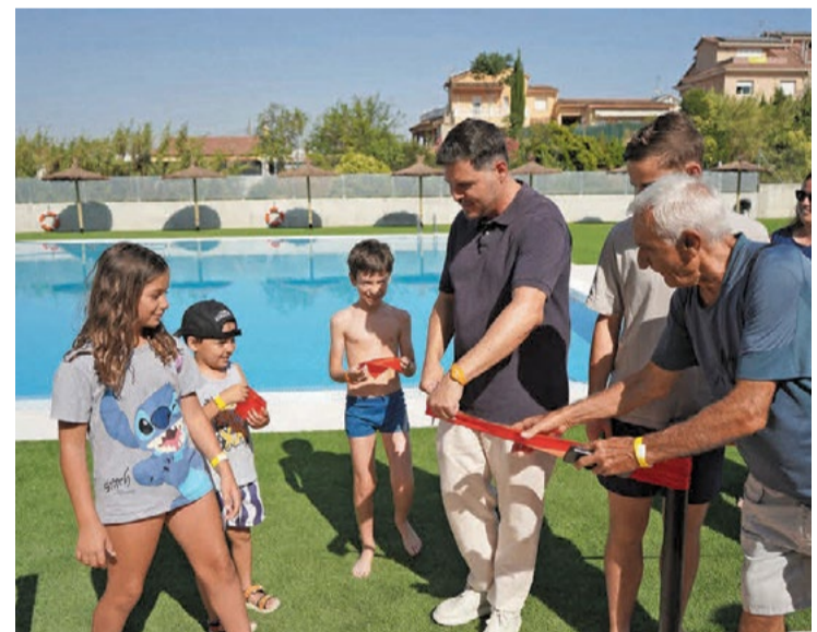
El corte de la cinta.

temporada. El mensual infantil tiene un precio de 23,03 euros y el de temporada de 42,09; el joven, 25,68 y 47,38; el adulto, 33,62 y 63,27; y el sénior, 25,68 y 47,38. También está el familiar 2 (2 adultos pareja), 52,68 y 99,27; el familiar 3 (dos adultos y un hijo), 59,03 y 111,97; y el familiar 4 (dos adultos y dos hijos), 67,50 y 128,38. Los abonos se pueden adquirir en la recepción del Complejo Deportivo Municipal El Turó y debe llevarse el DNI original. También se debe comprar la pulsera para poder acceder a las instalaciones, que tiene un precio de 4,12 euros. - Juanjo Cintas