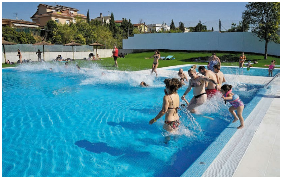
Salto simultáneo de inauguración de la piscina.

También existe la opción de adquirir abonos mensuales o de