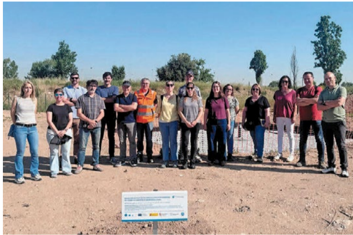
Visita de personal técnico a la depuradora de La Llagosta.

El Consorcio Besòs Tordera ha puesto en marcha la balsa de infiltración construida en la depuradora de La Llagosta en el marco del proyecto del Plan de Adaptación y Transformación para la Digitalización del Agua. Este proyecto de digitalización se está desarrollando en torno a los sistemas de saneamiento de Granollers, La Llagosta y Montornès, que dan servicio a 19 municipios, más de 310.000 habitantes y unos 3.500 establecimientos industriales, lo que supone el 75% de la población que atiende el Consorcio y un 70% del agua tratada.