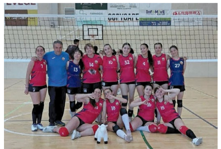
Juvenil del Club Vòlei La Llagosta.