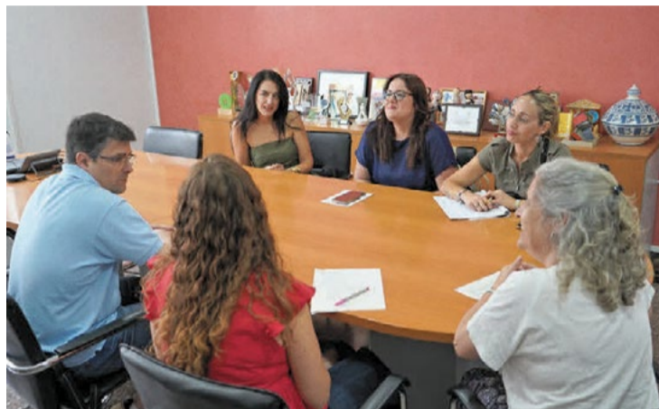
Reunión de la Mesa de Comercio Local.

Las representantes del Consistorio en la Mesa de Comercio propusieron a los comerciantes que se adhieran a la Red de establecimientos comprometidos con el bienestar digital de la infancia y la adolescencia, que impulsa la Generalitat.