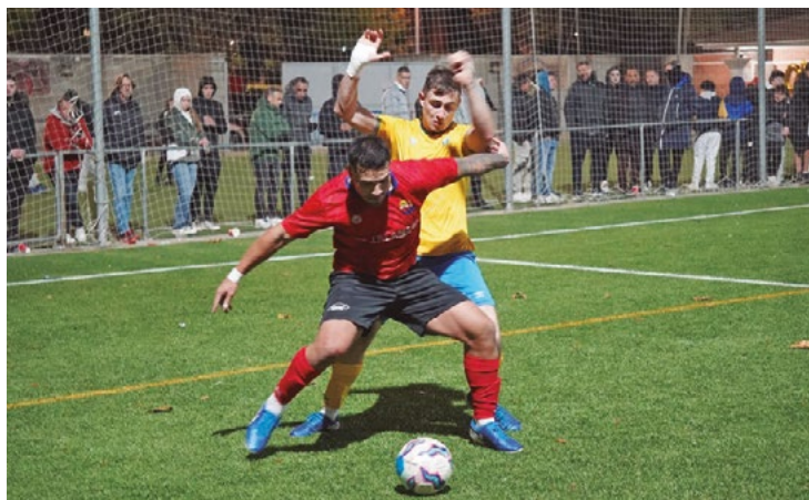
Los llagostenses han perdido los dos últimos partidos.