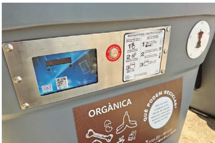
Un contenedor de orgánica, en La Llagosta.

La Ordenanza Fiscal número 7, reguladora de la Tasa para el tratamiento, recogida y eliminación de residuos sólidos urbanos de La Llagosta, recoge este año como novedad una reducción por el fomento de la recogida selectiva en el municipio. Con el fin de incrementar la recogida selectiva de residuos municipales, el Ayuntamiento establece un sistema de reducción de la cuota de la tasa en las viviendas particulares.