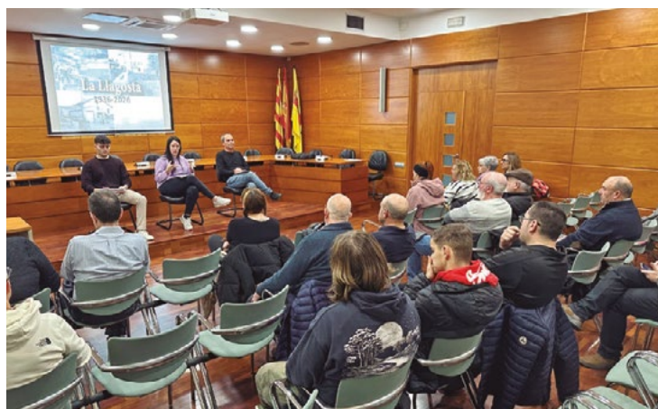
Reunión con las entidades, el día 20 de enero.

Durante la sesión, se comunicó que la fiesta del 90º aniversario tendrá lugar a finales de mayo y se hará coincidir con el acto de inauguración de Can Baqué y con la Muestra de Enti-