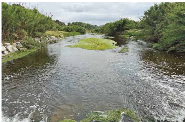
El Besòs a su paso per La Llagosta.

En el río Besòs, se analizará la entrada y salida del agua en la depuradora de La Llagosta y un tramo más arriba del río, también dentro de nuestro término municipal. La ACA prevé un cuarto punto para analizar del río Besòs, sin concretar. Entre todos los ríos catalanes, la ACA recogerá 123 muestras, que se realizarán a través de tres campañas de muestreo. La duración total del proyecto será de 23 meses, con catorce para recoger el muestreo, otros tres para analizar las muestras y tres más para la obtención de resultados. La ACA ha licitado el proyecto con una inversión superior a los 291.000 euros. Una vez esté ad-