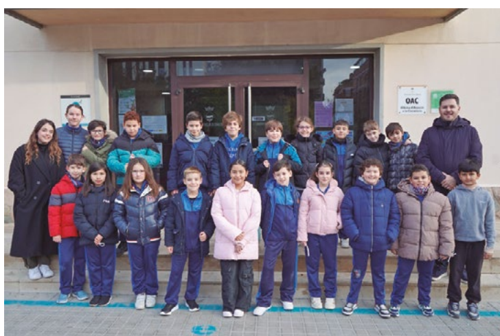
Alumnado de cuarto de Primaria de la Escuela Gilpe.

El 28 de enero se inició una nueva edición de las visitas de alumnado de las escuelas de La Llagosta al Ayuntamiento. El alcalde recibió a los niños y niñas de la Escuela Gilpe en la puerta del edificio consistorial. Después de hacerse una fotografía de grupo, Óscar Sierra les guió durante su estancia en el Ayuntamiento y respondió las preguntas que le hicieron en el Salón de plenos. El 5 de febrero el alcalde visitará la Gilpe. El 25 de febrero será el alumnado de la Escuela Sagrada Familia el que irá al Ayuntamiento. El 18 de marzo, será el turno de la Escuela Joan Maragall y el 15 de abril, de Les Planes.