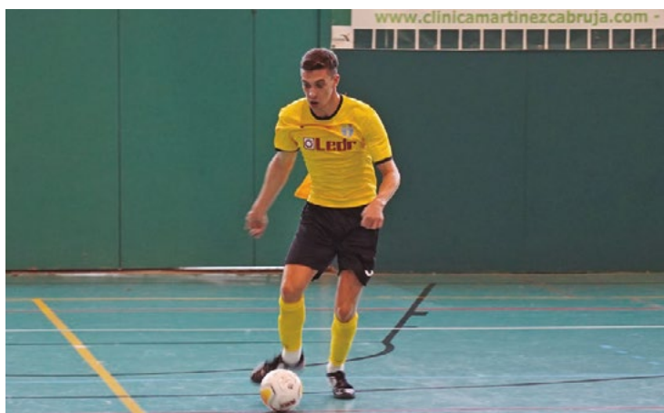
Los llagostenses jugarán este jueves contra el Cerdanyola 2006.

El FS Unión Llagostense perdió el último partido contra el Fénix por 5 a 3. El conjunto de La Llagosta se adelantó mediante Carlos Rodríguez en el minuto 7. Antes del descanso, los locales dieron la vuelta al resultado (2-1) y, en la reanu-