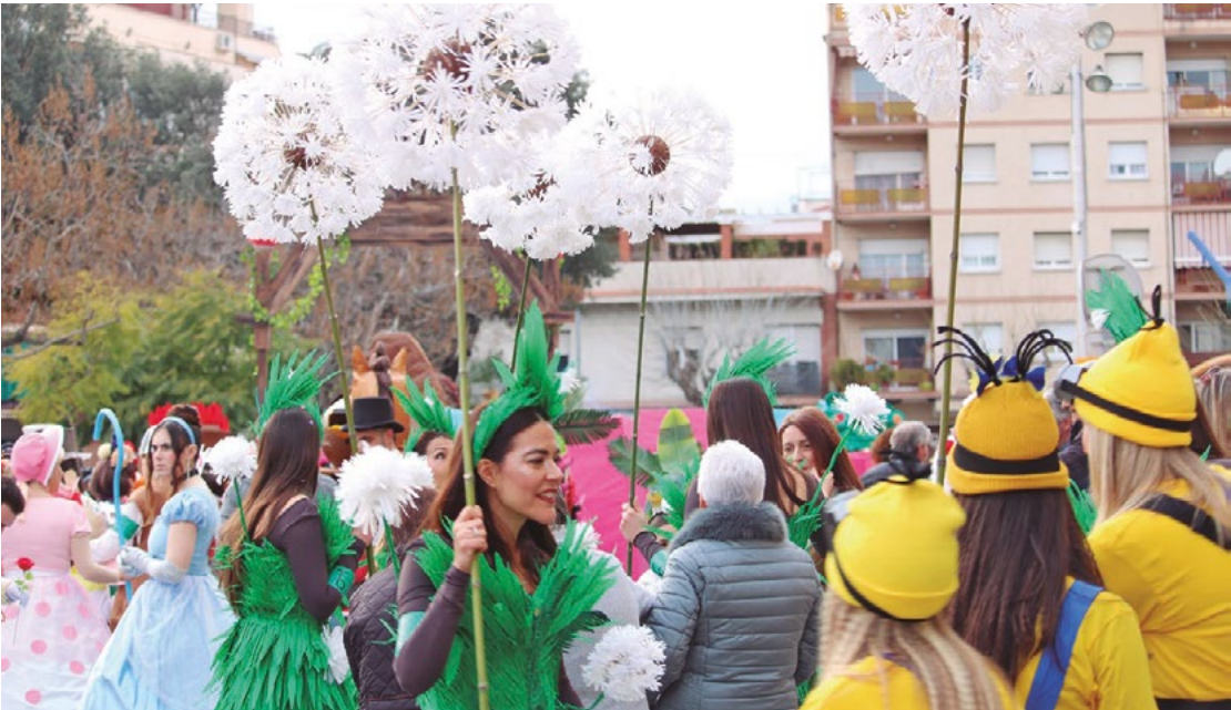
Un momento del Carnaval de 2025.