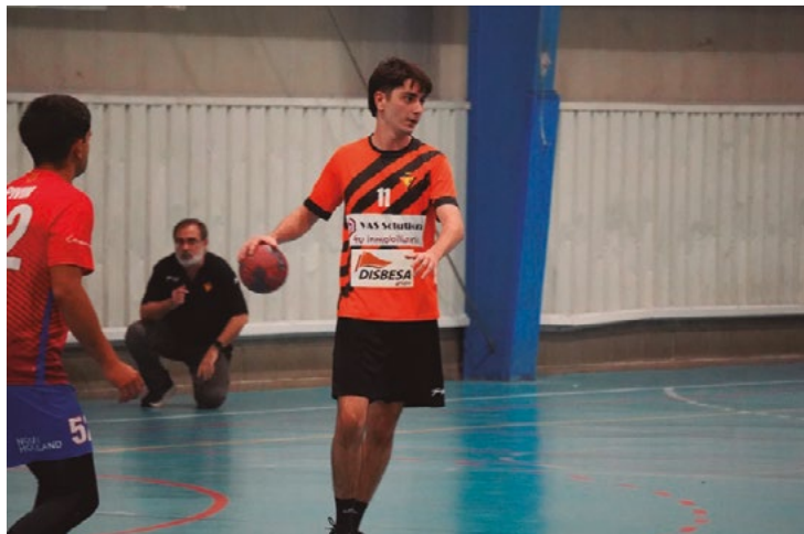
El conjunto llagostense es el noveno clasificado.

Por otra parte, el Vallag femenino empató (36-36) el domingo con el Laietà de Argentona. En el descanso, la igualdad era máxima (19-19). El Vallag se mantiene en tercera posición en el grupo C de la Primera Catalana con 21 pun-