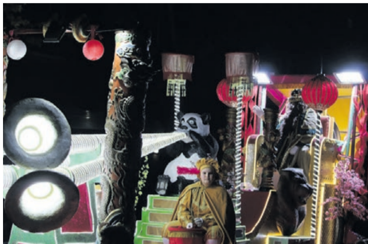
La carroza del rey Gaspar.

La Cabalgata de los Reyes Magos de Oriente empezó a las 18 horas desde la calle Estació, justo ante el paseo del Alcalde José Luis López Segura con unos primeros metros sin sonido hasta la rotonda de la avenida Primer de Maig. Posteriormente, la Cabalgata continuó por las calles de nuestra localidad hasta llegar a la plaza Antoni Baqué. Justo ante el edificio del Ayuntamiento, junto a