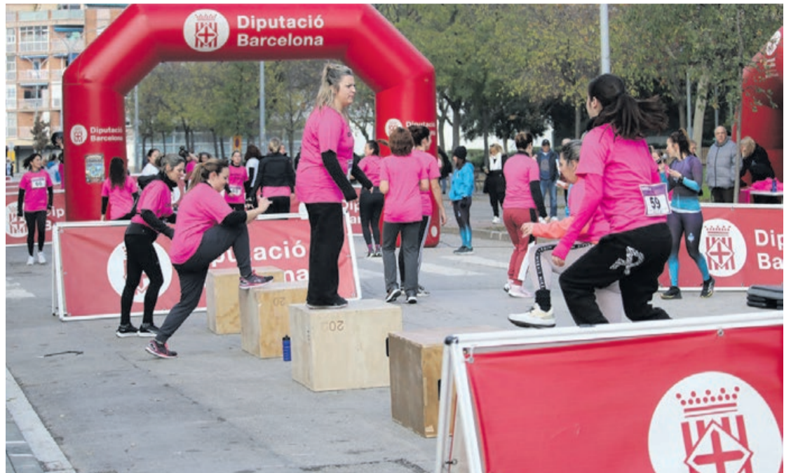
Jornada deportiva para mujeres en la calle Estació.