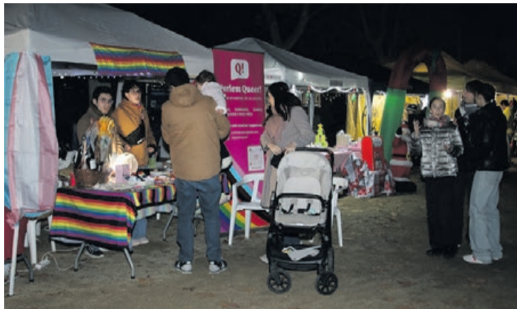
El Belén Viviente y el Mercado de Navidad de entidades.