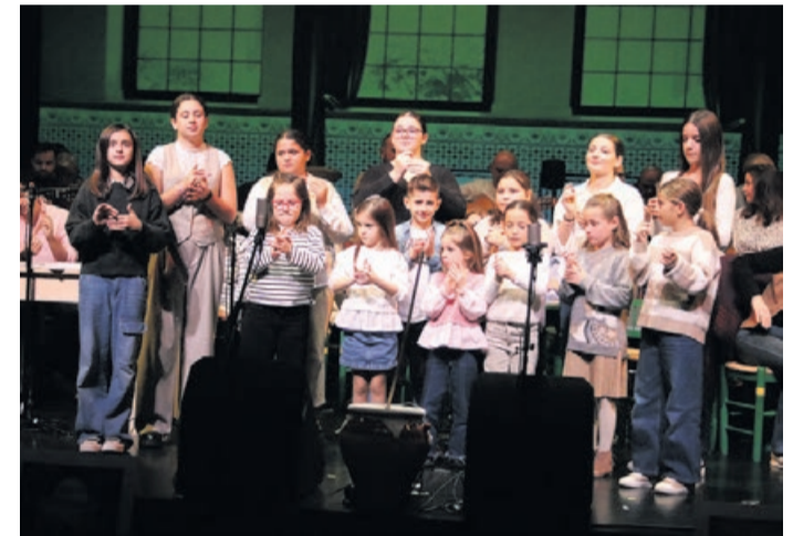
Un momento de la 10ª Zambomba Solidaria.