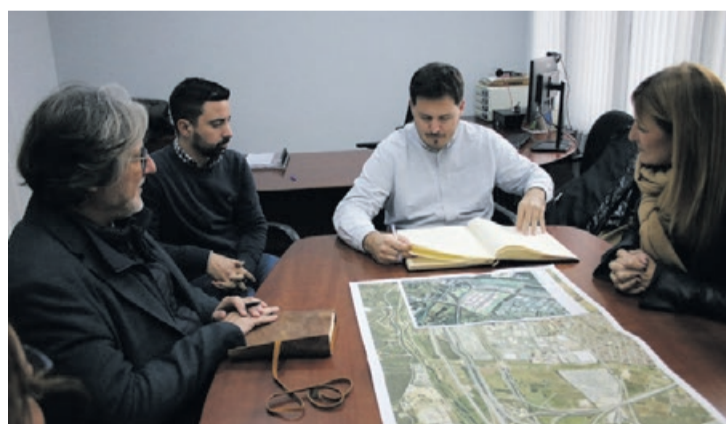
La reunión se celebró en el Ayuntamiento.

Durante el encuentro, se habló sobre el proyecto de mejora del polígono industrial de La Llagosta. Las obras cuentan con un presupuesto de cerca de un millón de euros. El Ayuntamiento ha solicitado a la Diputación una subvención del 80% del coste de la actuación. “Queremos contar con un polígono más atractivo y mo-