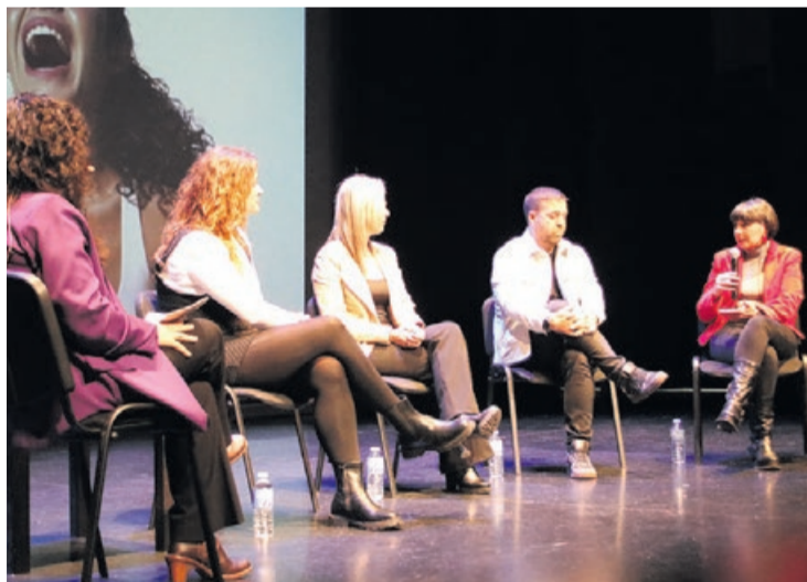
Cinefórum en el Centro Cultural.