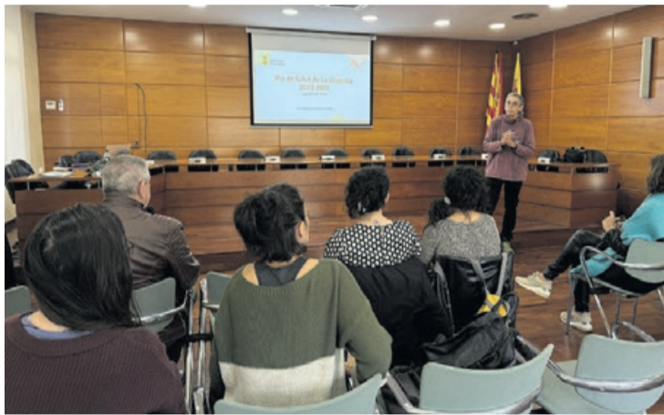
Reunión del grupo motor del Plan Local de Salud.

Un 55% de las acciones propuestas durante 2023 en el marco del Plan Local de Salud 2022-2025 se han alcanzado plenamente y un 5% lo ha hecho de forma parcial. El 32% no se han alcanzado y el resto de indicadores no se pueden evaluar por diferentes motivos. Estos son los principales datos del análisis realizado sobre las acciones de 2023 del Plan Local de Salud, que permite conocer su grado de cumplimiento. Este seguimiento ha facilitado la tarea ejecutada durante 2024 y planificar las acciones para este 2025. El grupo motor del Plan Local de Salud se reunió para conocer los datos de este seguimiento, que se añadirán a la evaluación final que se haga al terminar el Plan y para preparar el siguiente.