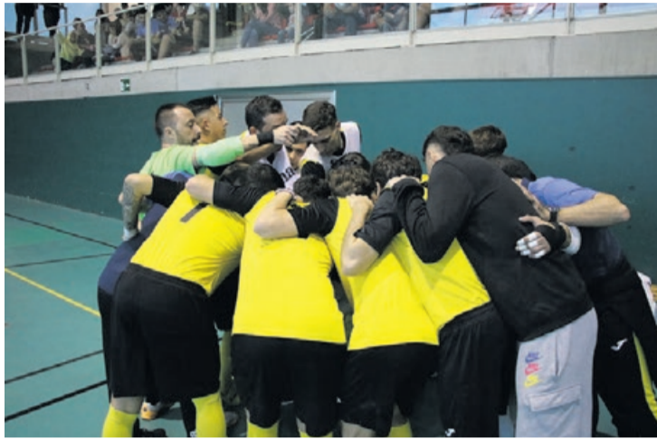
El conjunto llagostense suma tres derrotas seguidas.