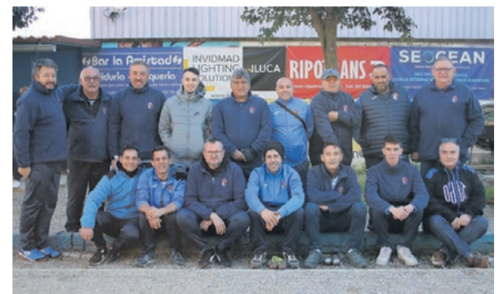
Primer equipo del Club Petanca La Llagosta.

El sénior B del CP La Llagosta, en la Tercera Catalana, ha acabado antepenúltimo. Ahora jugará la promoción de permanencia contra el Can Cuyàs en una eliminatoria a dos jornadas. - J.L.R.B.