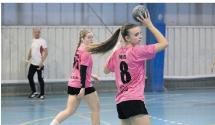
Una acción de ataque del Vallag femenino.

Por su parte, el sénior masculino cerró el 2024 con una derrota contra el GEiEG por 16 a 27, que lo deja en el último lugar del grupo B de la Primera Catalana. El Vallag es colista con cuatro puntos, empatado con el penúltimo, el Montgrí, y el antepenúltimo, el Sant Fost. La salvación para los llagostenses queda a dos puntos. El próximo partido del Vallag será en casa, contra un rival directo por la permanencia, el Montgrí.- José Luis Rodríguez Beltrán