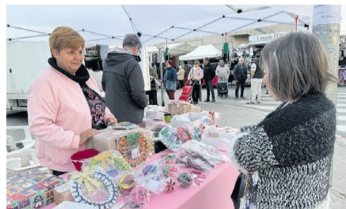
Recogida de juguetes. - J. Cintas

ferentes productos navideños elaborados a mano por la entidad. Los juguetes y el dinero recaudado se han destinado a la Unidad de Pediatría del Hospital Clínic de Barcelona. La Llagosta contra el cáncer organizó durante la tarde del 22 de diciembre una chocolatada solidaria en la plaza Antoni Baqué. El dinero recaudado se destinará a la investigación del cáncer. - José Luis Rodríguez Beltrán