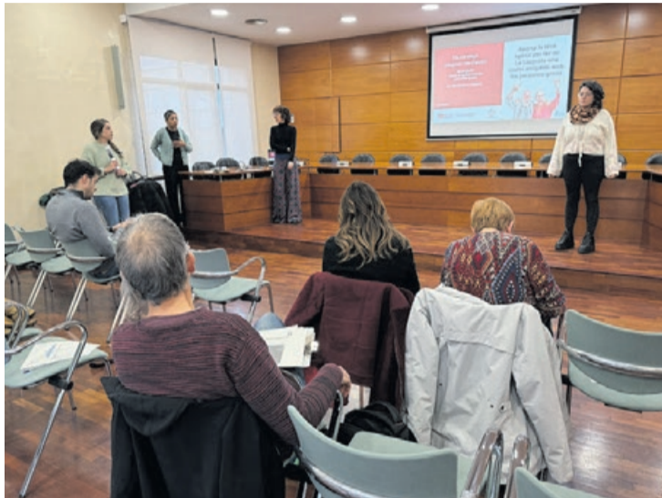
Sesión de trabajo del proyecto Ciudad amigable.

El Ayuntamiento ha hecho ya varias sesiones de trabajo con entidades de nuestra localidad y con trabajadores de diferentes concejalías de la administración local. El objetivo es conocer la situación actual de las personas mayores a través de una mirada integral; detectar las necesidades existentes y las sugerencias de mejora; conocer los puntos de vista de las personas cuidadoras; y recoger las visiones y propuestas de los agentes sociales y profesionales del municipio. Todo ello, para con-