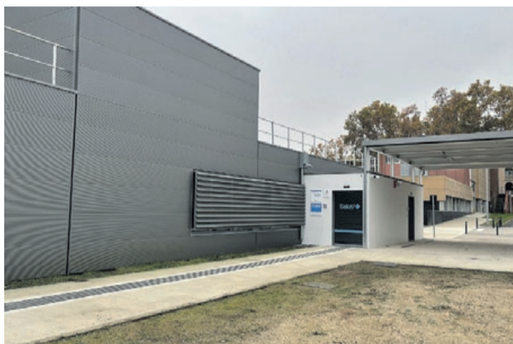
El CUAP Baix Vallès está ubicado en Santa Perpètua.

Ya está en marcha el nuevo Centro de Urgencias de Atención Primaria (CUAP) Baix Vallès en el paseo de La Florida de Santa Perpètua de Mogoda. Estará abierto las 24 horas, los 365 días del año, para atender a las urgencias de baja y media complejidad de la población adulta y pediátrica. También realizará radiologías y ecografías y contará con servicio de analítica urgente. Más adelante acogerá dos unidades de Apoyo Vital Básico del Servicio de Emergencias Médicas. El CUAP, gestionado por el Instituto Catalán de la Salud, da cobertura al territorio del Baix Vallès, que suma 160.000 habitantes y abarca localidades como Santa Perpètua, Palau-solità, Caldes, Sant Feliu de