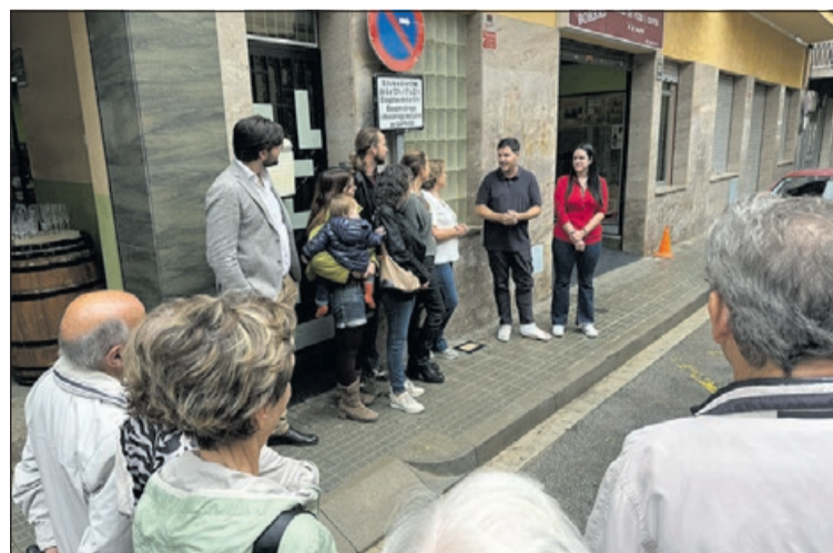
L'acte celebrat el 17 d'octubre.