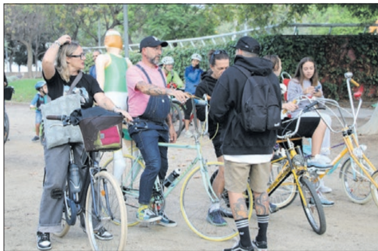
Algunes de les persones participants en l'activitat.

La sortida i arribada de la passejada en bicicleta van estar situades al Parc Popular. El recorregut va passar per llocs d'interès del nostre municipi, com ara el Complex Esportiu Municipal El Turó, la Font Tot Aigua, el Camp Municipal de Futbol Joan Gelabert i el Centre Cultural. Les persones participants van estar acompanyades durant la passejada per la Policia Local i Protecció Civil.