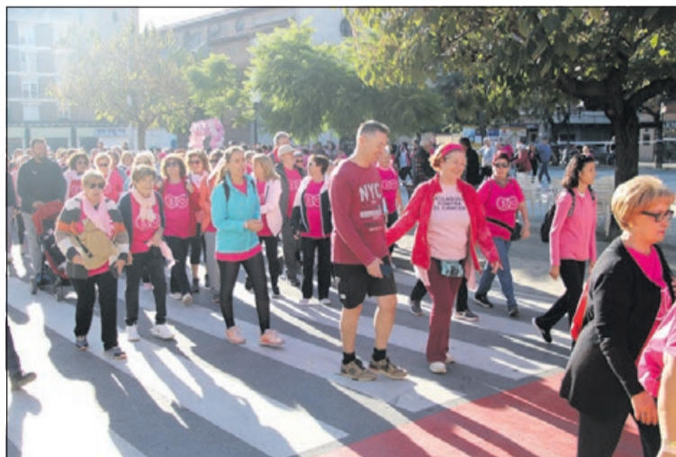
Inici de la novena Caminada contra el càncer.

"En aquesta ocasió hem tingut menys participants en la Caminada, perquè hi havia