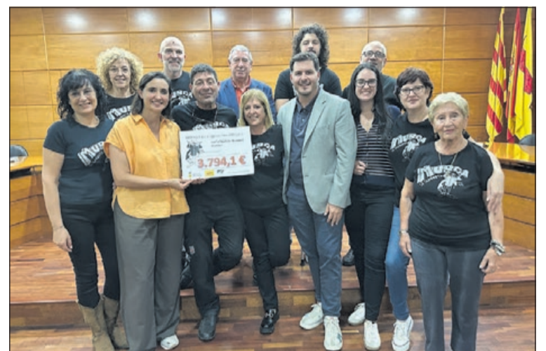
Imatge del lliurament del xec solidari.

car Sierra. La Murga va recollir els diners durant la Festa Major. "Per a nosaltres, és una injecció d'energia i ens serveix per investigar. Nosaltres operem els bebès dins de la panxa de les seves mares per l'espina bífida, però tenim línies d'investigació per intentar avançar-nos a la lesió de la malaltia" , va explicar Arévalo. - J.L.R.B.