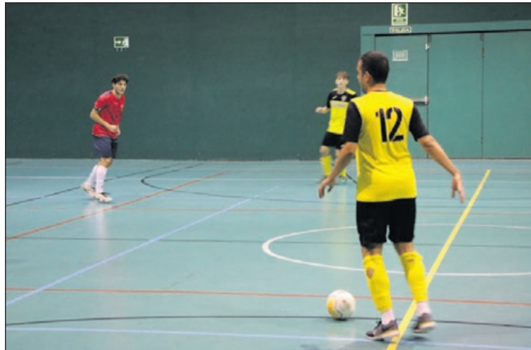
Una acció del debut contra l'Aliança de Mataró C.