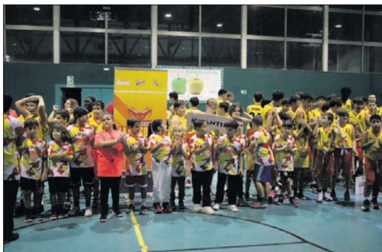
Alguns dels esportistes del CB La Llagosta 2017.