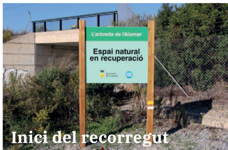
Inici del recorregut

El primer itinerari ambiental de la Llagosta, a l'entorn de la zona de l'Arbreda de l'Alomar, ja és una realitat. L'Ajuntament de la Llagosta ha destinat 26.983 euros a aquest projecte, que ha estat subvencionat pel Consorci Besòs-Tordera amb 14.968,43 euros. El condicionament de l'itinerari ha consistit en la construcció d'un petita passera, la senyalització del recorregut, la col·locació de quatre plafons informatius i la creació d'un punt d'observació de la fauna. El circuit és apte per a persones amb mobilitat reduïda.