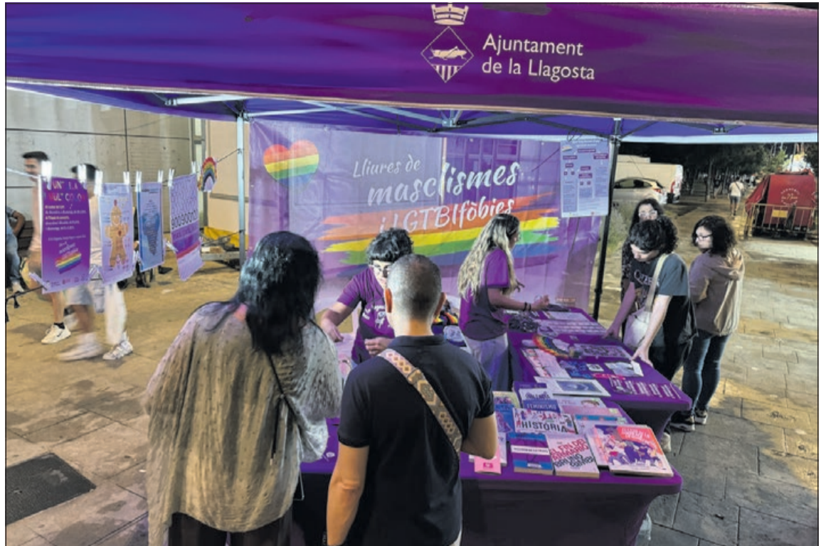
Punt Lila i Multicolor de l'Ajuntament de la Llagosta.

A les 21 hores, s'il·luminarà de color lila la façana de l'edifici de l'Ajuntament.