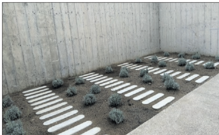
Imatges de la inauguració i d'una part de l'Espai de dol.

Jardineria i la Brigada Municipal d'Obres. "L'Espai de dol és un compromís que teníem amb la ciutadania i hem volgut que fos tranquil i relaxat, a més té el cel obert. Volem que les famílies puguin recordar aquells nens i nenes que malauradament no van poder néixer" , va dir