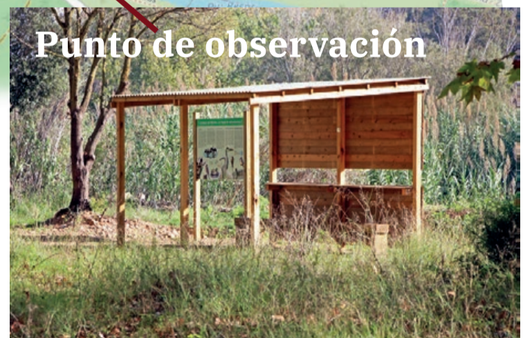
Punto de observación

Puedes ver el vídeo explicativo del itinerario escanando el código