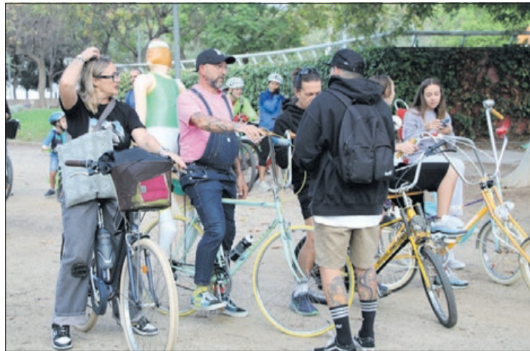
Algunas de las personas participantes en la actividad.

La salida y llegada del paseo en bicicleta estuvieron situadas en el Parc Popular. El recorrido pasó por lugares de interés de nuestro municipio, como el Complejo Deportivo Municipal El Turó, la Font Tot Aigua, el Campo Municipal de Fútbol Joan Gelabert y el Centro Cultural. Las personas participantes estuvieron acompañadas durante el paseo por miembros de la Policía Local y Protección Civil.