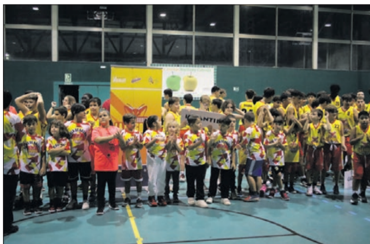
Algunos de los deportistas del CB La Llagosta 2017.