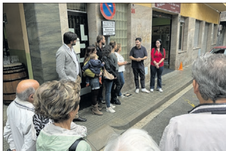
El acto celebrado el 17 de octubre.