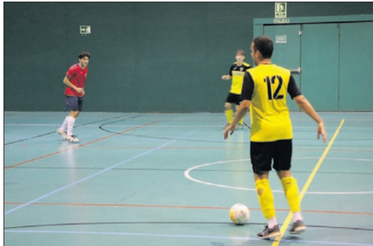
Una acción del debut contra la Aliança de Mataró C.