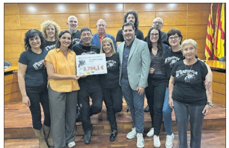
Imagen de la entrega del cheque solidario.

rra. La Murga recogió el dinero durante la Fiesta Mayor. "Para nosotros es una inyección de energía y nos sirve para investigar. Nosotros operamos a los bebés dentro de la barriga de sus madres por la espina bífida, pero tenemos líneas de investigación para intentar avanzarnos a la lesión de la enfermedad" , explicó Arévalo. - J.L.R.B.