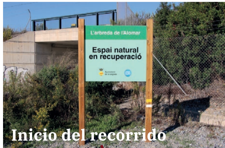
Inicio del recorrido

El nuevo itinerario de la Arboleda del Alomar está situado entre el Cementerio Municipal, el río Besòs, la autopista C-33 y la riera de Caldes. La Arboleda del Alomar constituye un espacio natural de gran interés para La Llagosta y la cuenca del Besòs, tanto desde el punto de vista de la preservación de la biodiversidad como por su utilidad a la hora de luchar contra el cambio climático y sus consecuencias. Teniendo en cuenta además que en un territorio como el de La Llagosta, de unos 3 km 2 , atravesado por numerosas vías de comunicación y en gran parte cubierto de asfalto, la Arboleda del Alomar constituye una oportunidad única por parte de la ciudadanía de entrar en contacto con la naturaleza. Así pues, se hace del todo indispensable que ésta se comprometa con la conservación y buen uso de este espacio vital para la mejora de su calidad de vida.