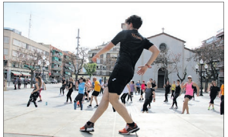
Una de les activitats del 6 d'abril a la plaça d'Antoni Baqué.

toni Baqué amb més d'una cinquantena de participants. El 7 d'abril, que era el Dia mundial de la salut, el CEM El Turó va celebrar, amb la col·laboració de la Regidoria d'Acció Esportiva, una caminada fins al Pla de Reixac de Montcada amb una trentena de persones. El recorregut va ser d'uns 8,5 quilòmetres. - J.L. Rodríguez