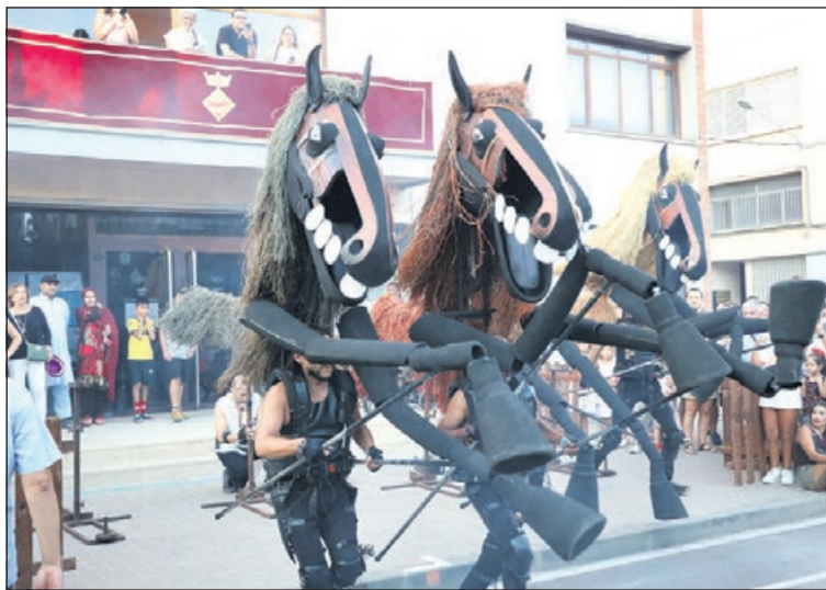
Una imatge de la Festa Major de l'any passat.

Fins al 24 de maig es poden presentar obres en el marc del Concurs de cartells de la Festa Major de la Llagosta, convocat per l'Ajuntament. La participació és oberta tant a professionals com a artistes novells majors de 16 anys. Les persones participants poden presentar un màxim de dos dissenys originals i inèdits. El format del cartell serà de DIN A3 en orientació vertical (29'7 cm d'ample x 42 cm d'alt), presentat sobre un suport rígid. També s'haurà de presentar l'obra en suport digital.