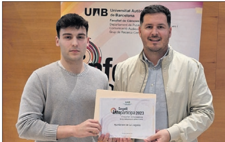
El regidor de Comunicació i l'alcalde.

L'Ajuntament compleix en aquesta ocasió el 90% dels indicadors establerts pel Laboratori de Periodisme i Comunicació per a la Ciutadania Plural de la UAB. El Consell Certificador del Segell Infoparticipa contrasta els resultats del Laboratori de Periodisme de la UAB, d'acord amb la Llei de Transparència del 2013, i atorga les distincions. Des del 2017, el Consistori llagostenc obté aquesta distinció. Només el 12% dels ajuntaments catalans ha aconseguit aquesta acreditació.