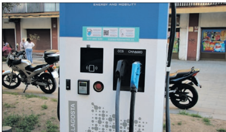
El punt de recàrrega del carrer del Progrés.

El preu públic per a la recàrrega de vehicles elèctrics o híbrids en estacions municipals és de 0,3421 euros/kWh. Per