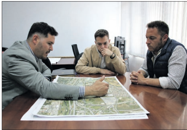
L'alcalde, reunit amb els dos diputats socialistes.