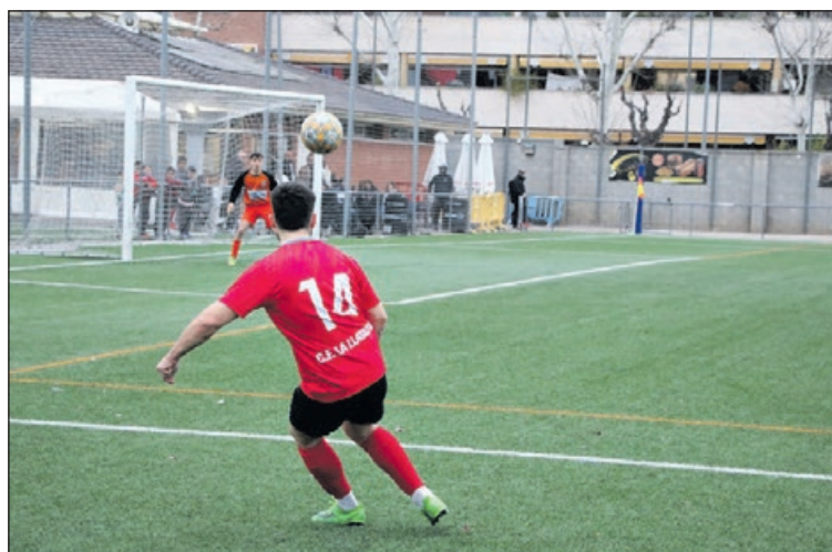
La Llagosta rebrà el Corró d'Amunt en la darrera jornada de lliga.

El conjunt llagostenc necessita guanyar en l'última jornada a casa contra el Corró d'Amunt, cinquè classificat amb 48 punts, i esperar una punxada del Martorelles B per assegurar-se el segon lloc, que dona dret a jugar la promoció d'ascens. Si els martorellencs guanyessin també en l'última jornada, hi hauria un triple empat entre els tres equips, però la Llagosta quedaria relegada al tercer lloc per la lligueta de resultats entre els tres conjunts. En cap cas, la