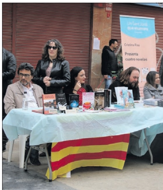
El Pre-Sant Jordi.