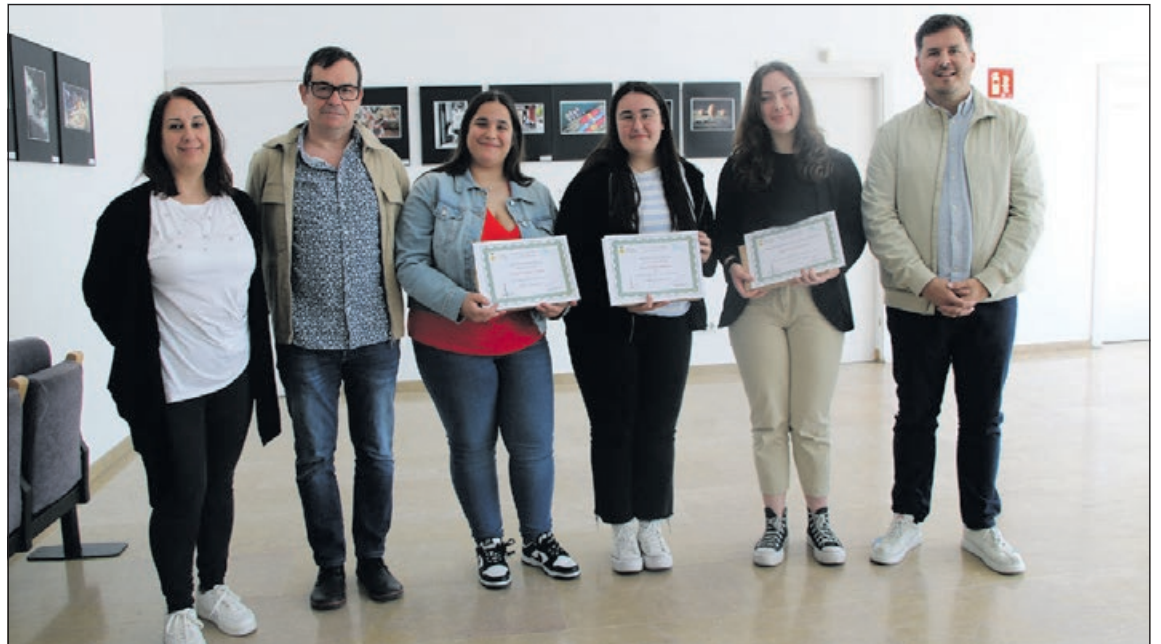
Les tres premiades pels treballs de recerca de l'INS Marina, al centre de la imatge.

D'altra banda, 25 autors i autores van estar presents al Pre-Sant Jordi organitzat per Resistència Literària conjuntament amb la Cafeteria Mágic i l'escriptora Isabella Vite. L'esdeveniment va tenir lloc el 21 d'abril a la plaça de Pere IV amb una bona acollida de públic.