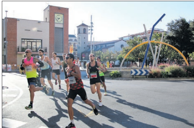
Un moment de la Cursa de l'any passat.

El preu d'inscripció per a la cursa de 10 quilòmetres és de 12 euros i el de la de 5 quilòmetres, de 10. Si es compra el xip d'un sol ús s'hauran de