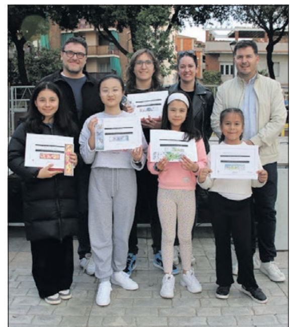
Guanyadors del Concurs de punts de llibre.