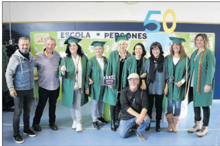
Un moment de la celebració.