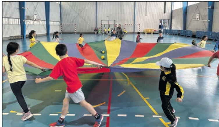
La primera jornada es va celebrar el 12 d'abril.

La jornada es basa en treball per estacions en les quals es posen en pràctica les habilitats motrius bàsiques (desplaçaments, salts, girs, llançaments i/o recepcions) així com les qualitats físiques bàsiques