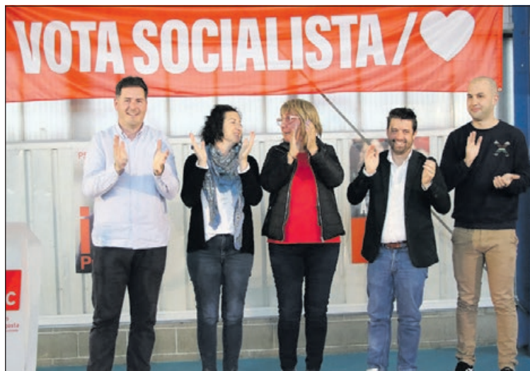
Les persones que van intervenir durant la Festa de la Rosa.

“Necessitem un govern del PSC a la Generalitat perquè és un aliat del municipalisme, que intentarà solucionar els problemes de la