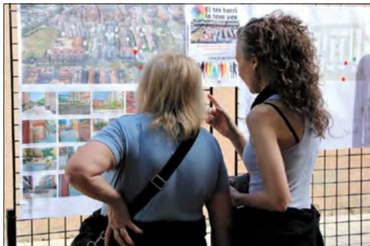
Dues veïnes, durant la jornada participativa del 23 de març.

Fins als anys cinquanta, la Llagosta va tenir un creixement lent amb assentaments progressius al voltant de la carretera N-152. A partir de llavors, fomentat per les migracions sobrevingudes d'arreu d'Espanya i les directrius del Pla Comarcal del 1961 que definia part dels terrenys de la Llagosta com a idonis per a la implantació d'un nou sector industrial, el creixement de-