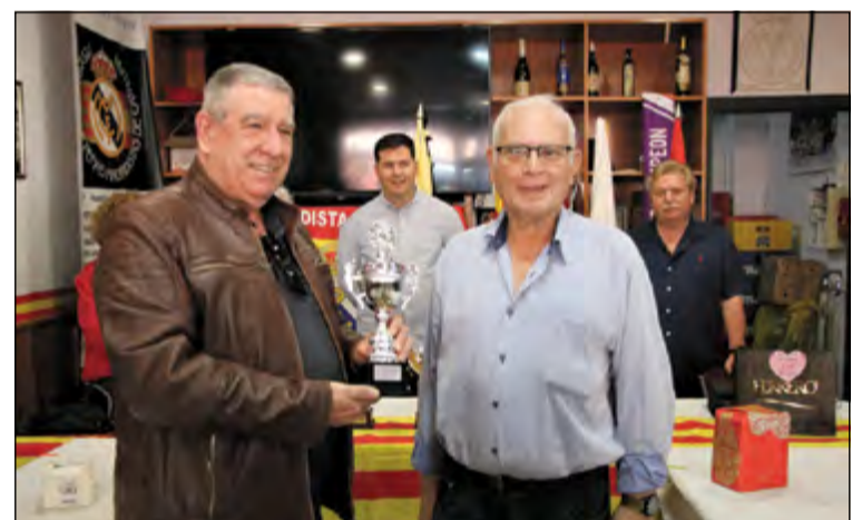
Lliurament de trofeus als dos primers classificats de la Lliga.