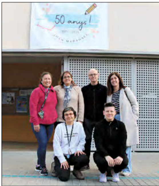
Membres de l'AFA i personal de l'escola.