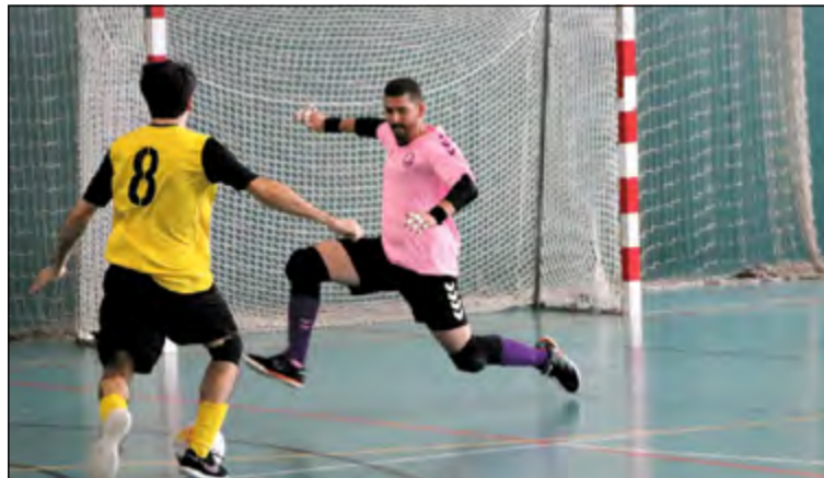
Una acció d'atac del sènior A del FS Unión Llagostense.

El sènior B, al grup 2 de la Tercera Catalana, va golejar en el darrer partit l'Escola Pia Mataró B per 0 a 8 i es manté líder, en solitari amb 48 punts.