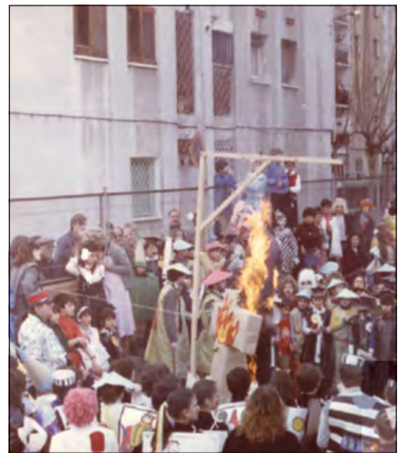
Celebració del Carnaval al Joan Maragall (1984).