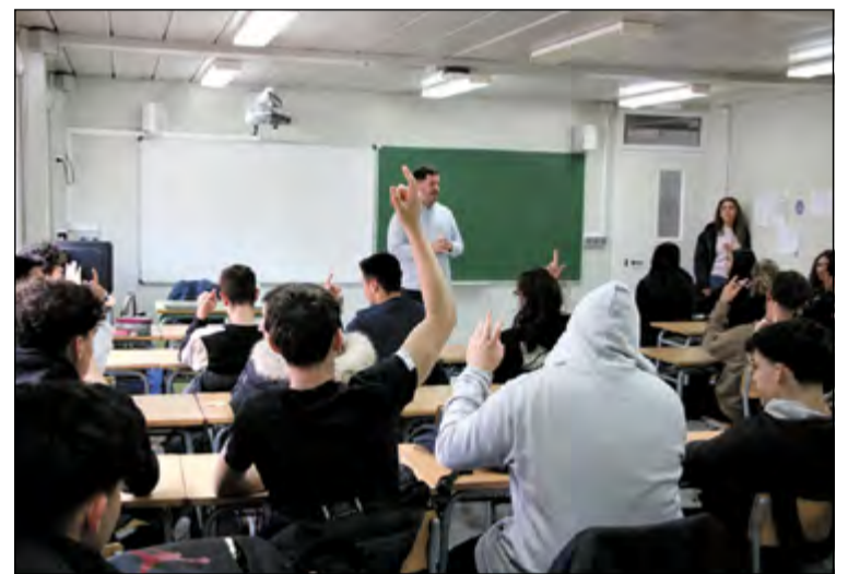
L'alcalde va anar a l'INS Marina a parlar amb l'alumnat.

L'alumnat va preguntar a l'alcalde sobre la situació del nou ambulatori de la nostra localitat i sobre si tornaran les urgències nocturnes. - J.L.R.B.