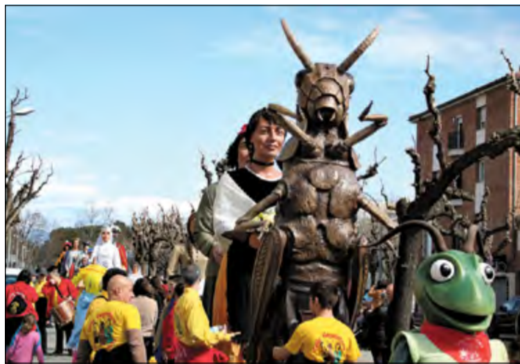
La cercavila, al passeig de l'Alcalde José Luis López Segura.

La plaça d'Antoni Baqué es va omplir durant el ball de gegants. Posteriorment, la Colla Gegantera de la Llagosta va voler fer un ball conjunt entre els membres de les colles. "Som una gran família, cada any que passa hi ha més gent