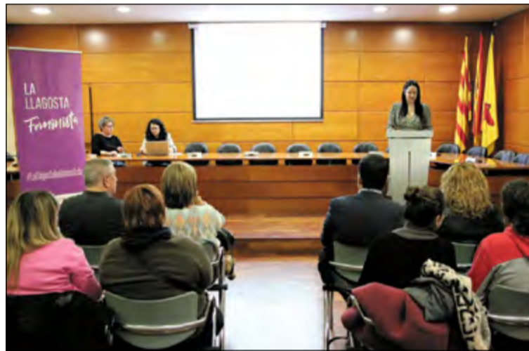
La presentació es va fer al Saló de plens.

El quart Pla d'Igualtat de la Llagosta vol ser un instrument que permeti ordenar i donar una perspectiva estratègica més feminista a les polítiques transversals per a la igualtat de gènere de la nostra localitat. Fa un any, es va iniciar l'elaboració del document amb el suport de la Diputació de Barcelona.