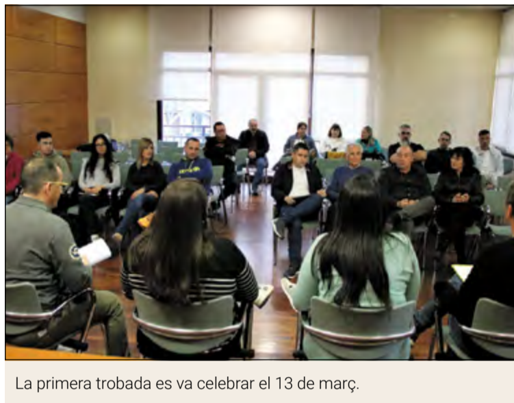
La primera trobada es va celebrar el 13 de març.

En aquesta primera presa de contacte, la comissió va comptar amb les àrees de Cultura i Joventut, però a partir d'ara se separaran. "Farem reunions cada quinze dies, els dijous a la tarda, i cada àrea de Cultura i Joventut anirà treballant per separat per tirar