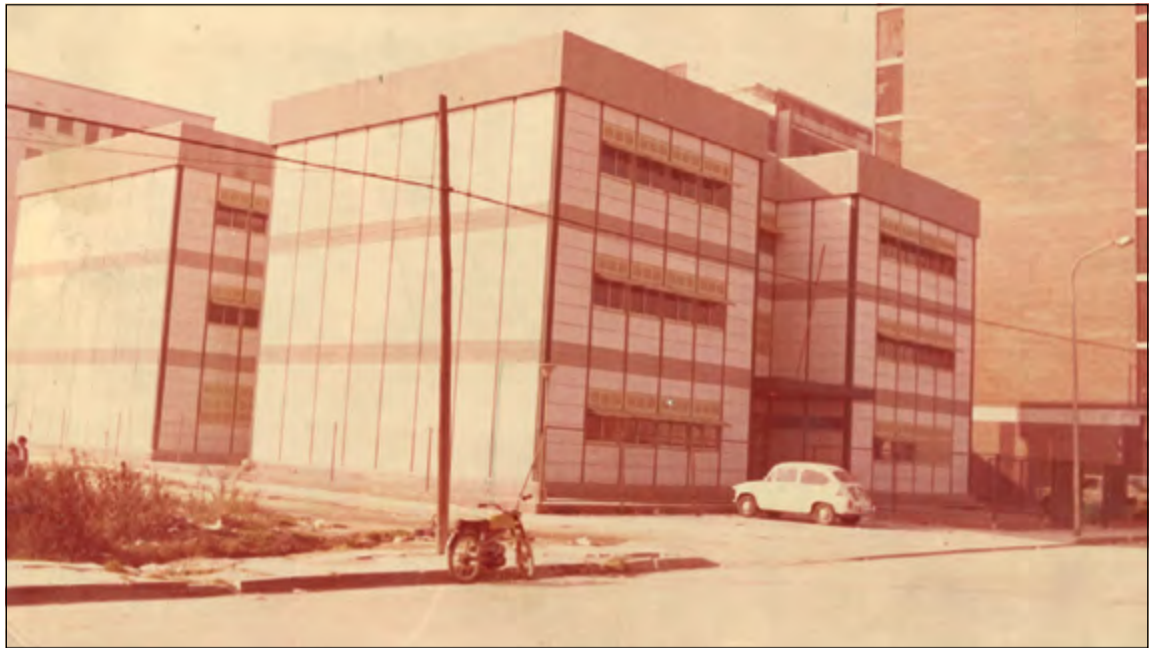
L'antic edifici de l'Escola Joan Maragall, l'any 1974.

Durant l'exposició, hi haurà una taula solidària amb la venda de productes a benefici de l'Hospital Sant Joan de Déu. El 27 d'abril, es farà l'acte del 50è aniversari i un dinar al pati de l'escola. - José Luis Rodríguez