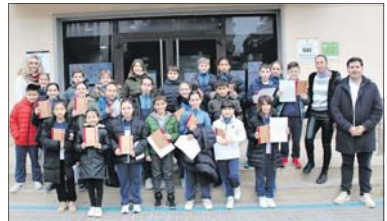
Alumnat de quart de l'Escola Gilpe.