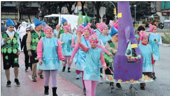
Una de les comparses durant la rua de Carnaval de l'any passat.

El dia 10, la cercavila començarà a les 17.30 h a la plaça d'Antoni Baqué amb tots els participants al Concurs de disfresses. - Juanjo Cintas