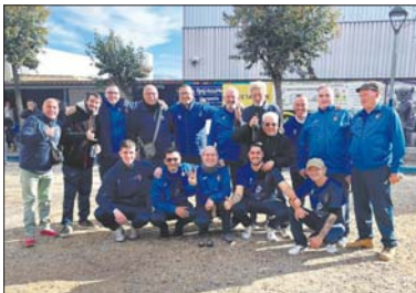
Sènior B del Club Petanca La Llagosta.

Aquesta ha estat una temporada d'èxit per al club de la nostra localitat amb l'ascens dels seus dos equips masculins. L'equip sènior B ha pogut celebrar ara pujar a la Tercera Catalana i, a finals de l'any passat, el sènior A va pujar directament a la Primera Catalana per una reestructuració de les lligues territorials de la Federació Catalana de Petanca.