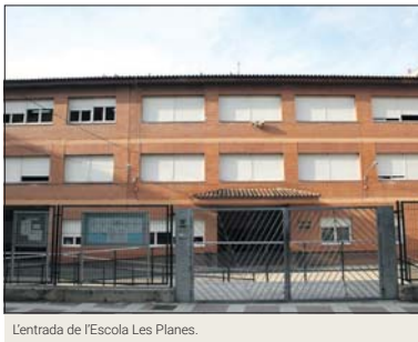
L'entrada de l'Escola Les Planes.

L'Institut Marina farà la jornada de portes obertes el dimecres 21 de febrer a les 18 h, mentre que el Centre de Secundària concertat Balmes es podrà visitar el dijous 29 de febrer a les 17.45 h.