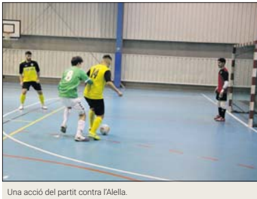
Una acció del partit contra l'Allella.

El duel va començar amb polèmica per un possible gol fantasma del FS Unió Llagostense en un xut de Saavedra. Gerard Alonso va marcar l'1 a 0 al minut 6. El líder va reaccionar ràpidament i va fer dos gols. A tres minuts per al descans, Edgar amb un xut potent va marcar el 2 a 2. El partit va guanyar en intensitat i una possible agressió amb el colze d'un jugador visitant va provocar l'expulsió de Faisal per protestar. A cinc segons per al descans, l'Allella va marcar el 2 a 3.