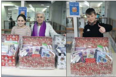
Els guanyadors de les paneres culturals.

Per participar en aquesta activitat tan sols s'havia de fer ús del servei de préstec de la Biblioteca de la Llagosta des de principis del mes de desembre fins al 8 de gener, dia en el qual