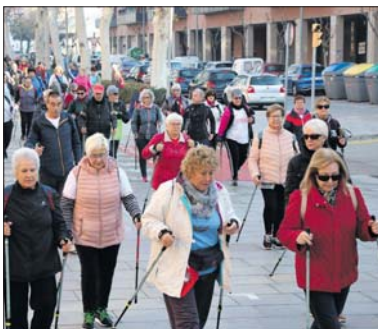
Dos moments de la passejada del 24 de gener.