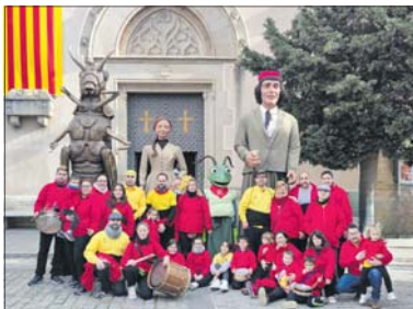
La Colla Gegantera durant la sortida a Argentina.

Abans dels actes per la Festa Major de la Llagosta, la Colla Gegantera farà cinc sortides més amb les trobades geganteres el 21 d'abril a la Sagrada Família de Barcelona; el 28 d'abril a la Trobada Nacional de Catalunya a Barcelona; el