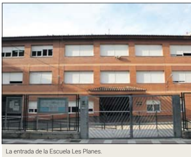
La entrada de la Escuela Les Planes.

El Instituto Marina realizará la jornada de puertas abiertas el miércoles 21 de febrero a las 18 h, mientras que el Centro de Secundaria concertado Balmes se podrá visitar el jueves 29 de febrero a las 17.45 h.