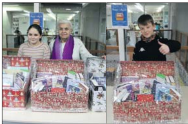
Los ganadores de las cestas culturales.

Para participar en esta actividad tan sólo se tenía que utilizar el servicio de préstamo de la Biblioteca desde principios del mes de diciembre hasta el 8 de enero, día en el que tuvo lugar el sorteo de las tres ces-