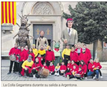
La Colla Gegantera durante su salida a Argentona.

Antes de los actos por la Fiesta Mayor de La Llagosta, la Colla Gegantera hará cinco salidas más con los encuentros el 21 de abril en la Sagrada Família de Barcelona; el 28 de abril en la Trobada Nacional de