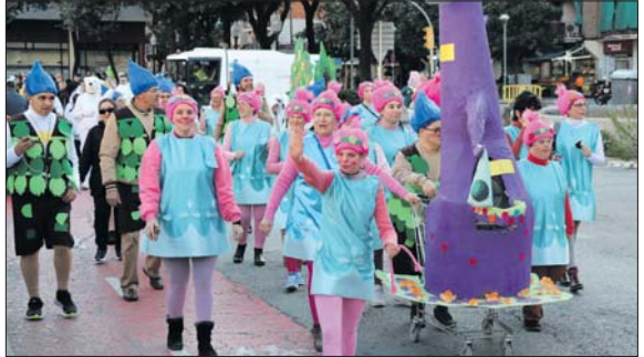
Una de las comparsas durante la rúa de Carnaval del año pasado.