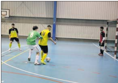
Una acción del partido contra el Alella.

El duelo empezó con polémica por un posible gol fantasma del FS Unión Llagostense en un disparo de Saavedra. Gerard Alonso marcó el 1 a 0 en el minuto 6. El líder reaccionó rápidamente e hizo dos goles. A tres minutos para el descanso, Edgar con un disparo potente marcó el 2 a 2. El partido ganó en intensidad y una posible agresión con el codo de un jugador visitante provocó la expulsión de Faisal por protestar. A cinco segundos para el descanso,