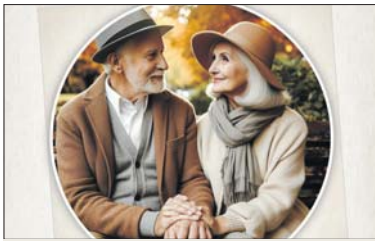
Imagen de promoción de la acción.

Las personas que quieran intervenir en esta actividad deben inscribirse en el Casal d'Avis hasta el 16 de febrero. El alumnado de cuarto de ESO del INS Marina visitará el Casal de Avis el 19 de febrero para recoger las fotografías, que estarán custodiadas en todo momento por profesorado, y para escuchar las historias de cada persona relacionadas con las imágenes. A partir de este relato, y