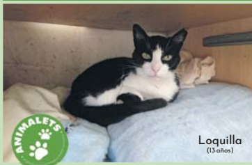
Loquilla (13 años)

Loquilla es una gata de 13 años que abandonaron en la entrada del refugio en un transportín, con apenas un año.