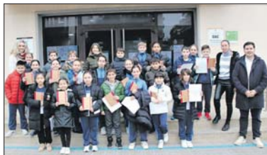
Alumnado de cuarto de la Escuela Gilpe.

ragall y, el 17 de mayo, de Les Planes. Durante las visitas, el alcalde, Oscar Sierra, responde las preguntas que le hacen los jóvenes estudiantes. Sierra devuelve unos días después la visita yendo a las escuelas. Una parte destacada de la visita al Ayuntamiento es hablar del reciclaje de residuos. Además se muestra al alumnado alguna fotografía histórica. - J.C.