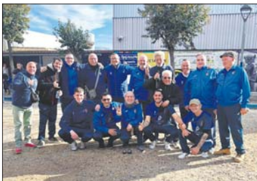
Sénior B del Club Petanca La Llagosta.

Esta ha sido una temporada de éxito para el club de nuestra localidad con el ascenso de sus dos equipos masculinos. El equipo sénior B ha podido celebrar ahora subir a la Tercera Catalana y, a finales del pasado año, el sénior A subió directamente a la Primera Catalana por una reestructuración de las ligas territoriales de la Federación Catalana de Petanca.