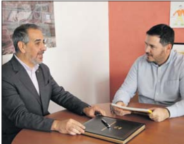
El delegat del Govern i l'alcalde de la Llagosta.