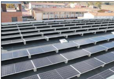
Algunes de les plaques instal·lades al CEM El Turó.

El pressupost de l'actuació al Complex Esportiu Municipal El Turó és de 119.947,84 euros i el de Can Pelegrí, de 74.595,39. Les dues obres estan subvencionades per la Diputació de Barcelona.