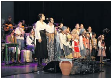
La Zambomba solidària de l'any passat.

El Parc Popular acollirà el 17 de desembre, a partir de les 11.30 h, el Festival de l'Espai Jove amb xocolatada i pintacares, entre altres activitats. L'Escola Municipal de Música oferirà el 21 de desembre, a les 18.30 h, el Concert de Nadal al Centre Cultural. El 21 de desembre, arriba una nova