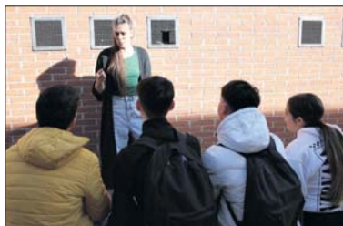
La tècnica d'Escolta Jove, amb un grup de joves de la Llagosta.

L'Ajuntament ha rebut una primera subvenció de la Diputació de Barcelona de 32.000 euros per portar a terme aquest programa a la Llagosta en el marc de la segona fase pilot d'aquest projecte adreçat a municipis de 5.000 a 20.000 habitants.