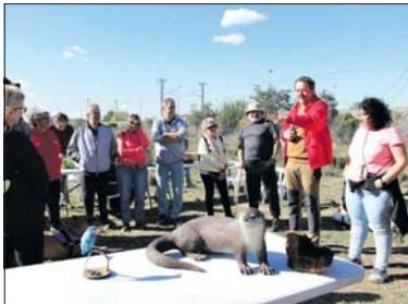
Dos moments de la sortida a l'arbreda de l'Alomar.