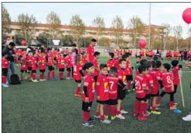
Alguns dels esportistes del CE La Llagosta.