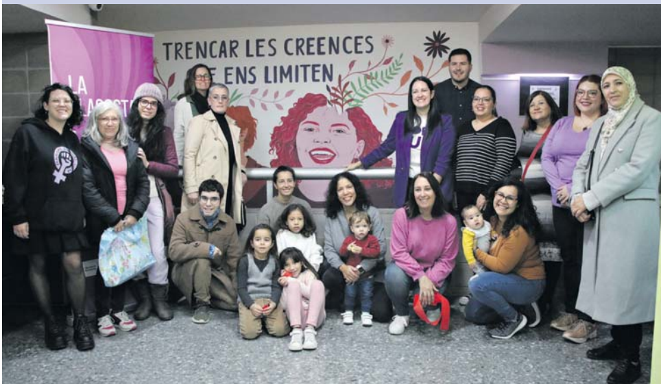
Commemoració del 25N a la Llagosta | 3

Presentació de la temporada del Club Esportiu La Llagosta | 13