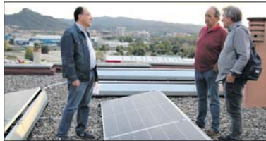
Tres veïns, amb una de les plaques.

i monitores la seva implicació en una activitat que se celebra a la Llagosta des de l'any 2016. - Juanjo Cintas