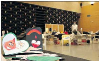
Imatge d'arxiu d'una de les captacions de sang a la Llagosta.

A la nostra localitat, es portaven més de deu anys de creixement en el nombre de donacions de sang. Aquesta tendència es va trencar el 2020 per la pandèmia de la Covid-19, però aquell any, amb només tres captacions, es va arribar a les 333 donacions. Excepte en aquella ocasió, des del 2019 s'han superat les 400 donacions anuals a la nostra localitat.