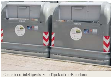
Contenidors intel·ligents.

L'Ajuntament de la Llagosta té previst que la propera primavera ja funcionin a la nostra localitat els contenidors intel·ligents de recollida de residus. L'objectiu és augmentar les dades de reciclatge. La directiva europea marca que l'any 2025 s'haurà de reciclar un 55%; el 2030, un 60%; i el 2035, un 65%. A la Llagosta, ara només es recicla un 29%. Els municipis que no compleixin la normativa seran sancionats.