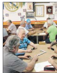
Torneig de dòmino.