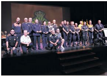
Una de les imatges de la jornada.

La celebració del 40è aniversari de Protecció Civil de la Llagosta es va iniciar a les onze del matí amb una exposició de diferents vehicles d'emergència al carrer de l'Estació. Poc després, es van fer