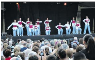
Festival de Festa Major de La Room.