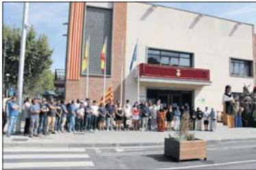
Minut de silenci a les portes de l'Ajuntament.

La Llagosta va mostrar una vegada més la seva solidaritat amb un minut de silenci per les víctimes del terratrèmol del Marroc davant de l'edifici de l'Ajuntament. L'acte es va fer l'11 de setembre abans de la hissada de la senyera per la Diada Nacional de Catalunya. L'Ajuntament va convocar el minut de silenci, que va aplegar a centenars de persones a la plaça d'Antoni Baqué. Algunes d'elles eren membres de la nova entitat Associació Afaq Multicultural de joves i dones, que van agrair el suport de la ciutadania de la Llagosta.