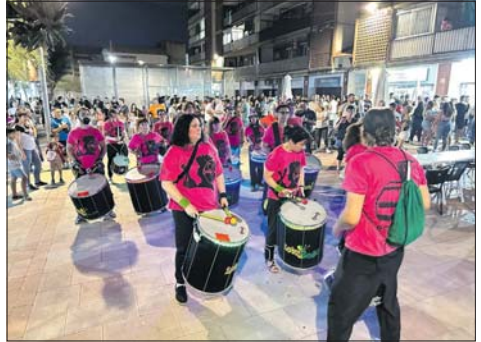
Corretasques, amb el grup La Feria i Lotokotó.