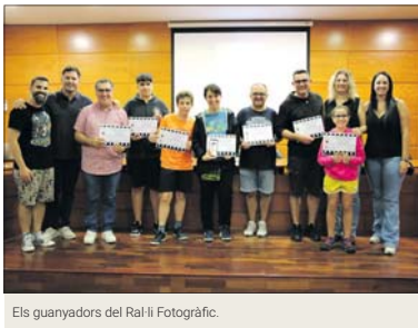
Els guanyadors del Ral·li Fotogràfic.

El Ral·li Fotogràfic Festa Major es va celebrar l'11 de setembre en el marc de la Festa