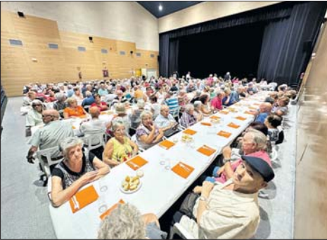
Homenatge a la gent gran de la Casa de Andalucía.