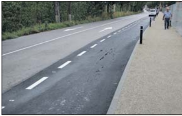
El camí i la zona d'aparcament.

Les obres per habilitar un camí de vianants i un aparcament en línia al carrer de la Riera Seca, entre el passeig de l'Alcalde José Luis López Segura i l'avinguda del Primer de Maig, van finalitzar a mitjans del mes de setembre. A més, s'ha pintat senyalització viària horitzontal per tal que hi hagi una millor seguretat en la circulació de vehicles per la zona.