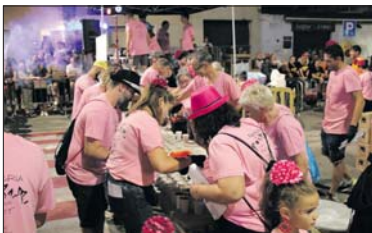
Sangriada, amb els Sangrinaris.