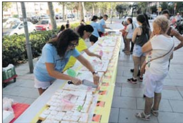
L'Esplai Dijoc tornarà a estar present a la Festa Major.