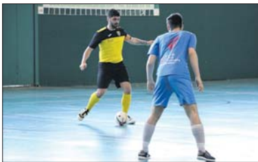
Una imatge d'un partit de la temporada passada.