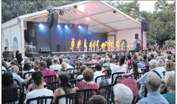
La plaça d'Antoni Baqué acollirà diferents espectacles.

A la nit, hi haurà, a la plaça d'Antoni Baqué, el concert de Guadaljarafé. Al carrer de l'Estació actuarà l'orquestra Huracán i els Sangrinaris