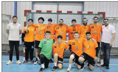
L'equip que va aconseguir l'ascens la temporada passada.

L'equip de la nostra localitat, que la temporada passada va aconseguir de forma brillant l'ascens a la Segona Catalana, competirà per mantenir la categoria contra el Sant Boi B, Les Franqueses, l'Igualada B, el Berga, el Sant Andreu de la Barca, el Castellbisbal, el Palautordera B, el Vic, La Salle Montcada B, el Blancs i Blaus BMG, el Sant Cugat, el Sant Vicenç, el Cambrils i el Poblenou B. - José Luis Rodríguez