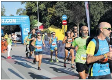
Algunes de les persones que van córrer l'any passat.

Les inscripcions es poden fer al web de Championchip. El