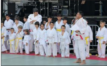
Exhibició de judo i karate del 2022.

Dijous, el Club Pati La Llagosta farà una jornada de portes obertes de patinatge de les 18 a les 20 h al pati de l'INS Marina.