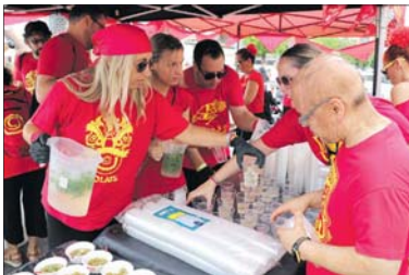
Activitat de la Festa Major de 2022.

Diumenge, els Volats organitzaran la Rebutjada popular amb música en viu. Tothom podrà gaudir d'aquest acte a partir de les 12 h a la rotonda situada entre el carrer de l'Estació i Primer de Maig. El mateix diumenge, els Saltats se