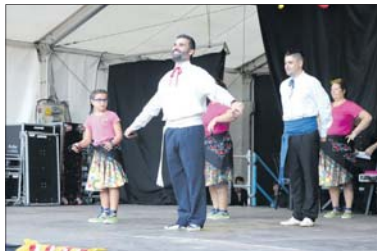
Actuació del Grup de Ball de Gitanes de la Llagosta.

Abans, a les 11.55 h, es procedirà a hissar la senyera als pals situats davant de l'edifici de l'Ajuntament de la Llagosta amb motiu de la celebració de la Diada. - J.C.