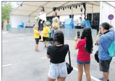
Un moment del Ral·li Fotogràfic de l'any passat.

El veredicte i lliurament de premis tindrà lloc el 15 de setembre a les 19 h a la Sala de plens del Consistori. - J.C.