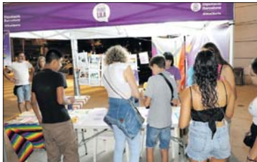
El Punt Lila i Multicolor del 2022.

El Punt Lila i Multicolor estarà obert divendres, dissabte i diumenge entre les 20 i les 24 hores. Qualsevol persona s'hi podrà adreçar per rebre in-