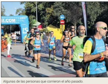
Algunas de las personas que corrieron el año pasado.

El circuito de la carrera llagostense volverá a ser de 5 km. De esta manera, los participantes de la carrera corta tendrán que dar una vuelta al recorrido y los de la larga, dos. La salida de ambas distancias será a la misma hora, a las 9.30 h. Al finalizar la prueba, se celebrará la carrera infantil, sobre las 11 h, con las distancias de 800 metros, 400 metros y 200 metros, según la edad del participante. Las inscripciones se pueden realizar en la web de Cham-