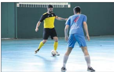
Una imagen de un partido de la temporada pasada.