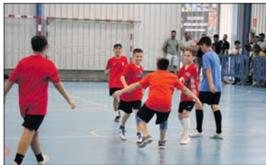
Una imagen de una de las finales de la competición.

en benjamín; Taroas FC, en alevín; Payasines, en infantil; y Leones, en cadete. También estaba el premio al juego limpio que fue para The origin of star, en benjamín; Adrenalín, en alevín; Pio, en infantil; y Sulimanes, en cadete. - J.L.R.B.