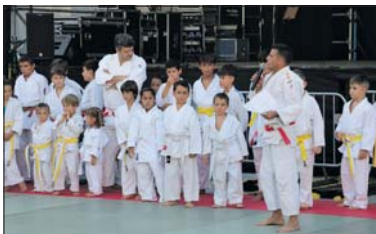
Exhibición de judo y kárate de 2022.

El programa de la Fiesta Mayor cuenta también con diferentes actividades deportivas. El día 2, el Club Petanca La Llagosta organizó el tradicional Torneo de Fiesta Mayor en las pistas municipales de petanca. Ese día, también se celebró el Torneo de balonmano Mero Alonso organizado por el Handball Club Vallag. El jueves, el Club Patí La Llagosta hará una jornada de puertas abiertas de patinaje de las 18 a las 20 h en el patio del INS Marina.