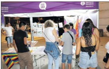
El Punto Lila y Multicolor de 2022.

Esta Festa Major contará también con el Punto Lila y Multicolor, que montará el Ayuntamiento de La Llagosta. Desde este espacio, se informará y sensibilizará sobre la problemática de las conductas violentas por razón de sexo. El Punto Lila y Multicolor, gestionado por la Concejalía de Igualdad, estará ubicado junto al ambulatorio con el lema En La Llagosta fiestas mayores y espacios de ocio libres de machismos y LGTBIofobia .