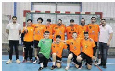
El equipo que consiguió el ascenso la temporada pasada.

de la Barca. La última jornada de la fase regular será el fin de semana del 11 y 12 de mayo y el Vallag visitará el Blancs y Blaus BMG de Granollers. El equipo de nuestra localidad, que la temporada pasada consiguió de forma brillante el ascenso a la Segunda Catalana, competirá por mantener la categoría contra el Sant Boi B, Les Franqueses, Igualada B, Berga, Sant Andreu de la Barca, Castellbisbal, Palautordera B, Vic, La Salle Montcada B, Blancs i Blaus BMG, Sant Cugat, Sant Vicenç, Cambrils y Poblenou B. - José Luis Rodríguez