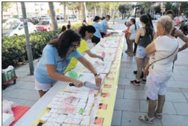
El Esplai Dijoc volverá a estar presente en la Festa Major.