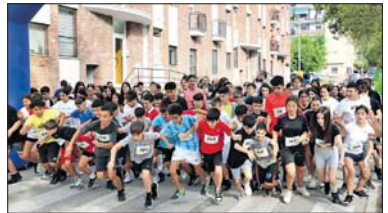
El 20 de junio se celebró la primera Milla del Instituto Marina con la participación de alumnado de ESO y profesorado.