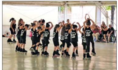
El Club Patí La Llagosta celebró el 14 de junio el festival de verano en la pista polideportiva del INS Marina. La actividad contó con la participación de una treintena de patinadores. Las actuaciones de grupo estuvieron tematizadas con los personajes del videojuego Mario Bros. - J.L.R.B.