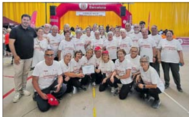
Las personas de La Llagosta, en el acto de clausura.

Un grupo de vecinos y vecinas de La Llagosta participaron el 1 de junio en Vilafranca del Penedès en la jornada de clausura del Ciclo de paseos de marcha nórdica para personas mayores que organiza la Diputación de Barcelona con la colaboración de los ayuntamientos. El alcalde en funciones,