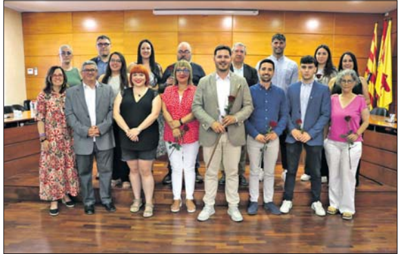
Los diecisiete concejales y concejalas del nuevo mandato, después del pleno del 17 de junio.

Además de repasar lo hecho durante los últimos cuatro años, Ruiz comentó que trabajarán "con una mirada de desarrollo sostenible, me-