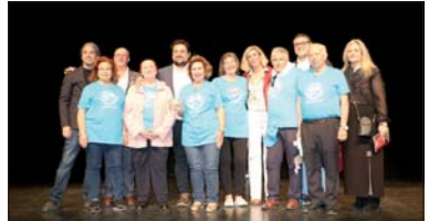
El acto tuvo lugar en el Centro Cultural.

El Centro Cultural se llenó el 15 de abril durante el acto central del encuentro organizado por la entidad Loreños por el Mundo. La Lagosta fue escogida para celebrar este acto anual que sirve para reunir a gente de Lora del Río que vive fuera de su población y loreños y loreñas que aún viven en la localidad sevillana.