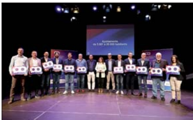
Algunos de los ayuntamientos galardonados, entre ellos el de La Llagosta.