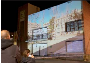
Un momento de la proyección en la fachada del Ayuntamiento.

El primer mapping participativo de nuestra localidad, organizado por el Instituto Marina, respondió con creces a los objetivos planteados con esta actividad del proyecto ARTE Y ESCUELA, del que forma parte el propio instituto. La actividad se clausuró el 15 de abril con la proyección del mapping en la fachada del Ayuntamiento con un buen número de público. Según el Instituto Marina, la actividad quería crear una vinculación de los alumnos de La Lagosta con su municipio, haciendo red entre las escuelas y el instituto trabajando uno de los objetivos sostenibles de la Agenda 2030 de Ciudades y comunidades sostenibles. El título de la presentación era Arretem La Lagosta y su elaboración comenzó en el mes de enero. El Instituto Marina invitó a las escuelas a participar en este proyecto. Finalmente, forma-