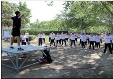
Una de las actividades del 17 de mayo en el Parc Popular.

Posteriormente, se hizo una comida y la entrega de diplomas a las personas que han participado a lo largo del curso en los diferentes talleres. La jornada finalizó con un baile. En esta ocasión, unas 320 personas han participado en los talleres organizados en el Casal d'Avis por el Ayuntamiento