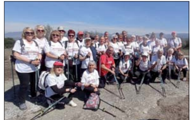
Las personas de La Llagosta que fueron a Roda de Ter.

La de Roda de Ter fue la última excursión de este curso. Antes, se habían dado paseos por Sant Pol de Mar, Martorell y La Llagosta. El acto de clausura tendrá lugar este jueves, día 1 de junio, en Vilafranca del Pedregós. - J. Cintas