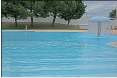
Imagen de archivo de la piscina exterior del CEM El Turó.