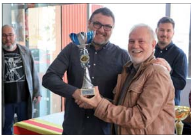
Entrega del trofeo de campeón de Copa.

Además hubo obsequios para la mejor pareja de cada entidad. En esta ocasión, tanto en la Liga como en la Copa, han participado seis equipos, los dos de la Entidad Dominó La Llagosta, la Peña Bar Ramiro, la Peña Madridista, el Casal d'Avis y la Casa del Pueblo. "Ha ido todo muy bien, ha habido mucha participación" , ha explicado Benito García, presidente de la Entidad Dominó La Llagosta. En septiembre, se disputará el Torneo de dominó de la Fiesta Mayor y, después, empezará una nueva edición de la Liga. - Juanjo Cintas