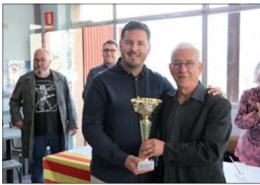
Entrega del trofeo de campeón de Liga.