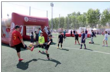
Jornada solidaria del 1 de mayo.

El dinero se destina al Hospital Sant Joan de Déu de Barcelona para sus programas contra el cáncer infantil. Desde el AMPA, han valorado positivamente la solidaridad de vecinos y vecinas de nuestra localidad. Durante la Butifarrada, también hubo instalado un stand de la entidad Polseres Candela, que vendió productos para recaudar dinero para sus proyectos. Días antes, el Goshindo Ikigai Schools organizó un taller de defensa personal para mujeres que sirvió para promover las donaciones directas en el Hospital de