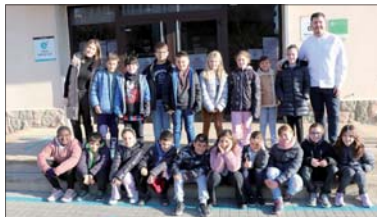
Cuarto A de la Escuela Sagrada Família.