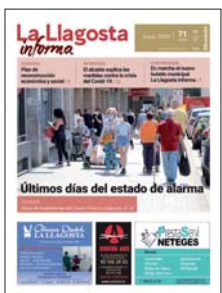
El 08centvint se transforma en La Llagosta informa.