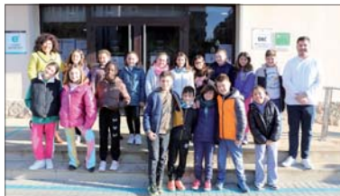
Cuarto B de la Escuela Sagrada Família.