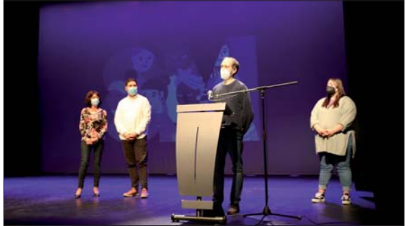
Acto institucional del Día internacional de las mujeres de 2022.