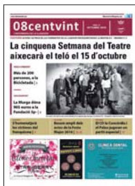
Cambio de imagen del 08centvint.