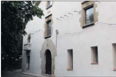
Fachada rehabilitada de Can Baqué.