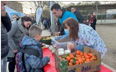
La merienda saludable del 3 de febrero en el Parc Popular.

La Gasol Foundation organizó el 3 de febrero en el Parc Popular la última merienda saludable en La Llagosta, dirigida a las familias y a los niños y niñas de la Escuela Gilpe. La actividad formaba parte del programa ÓRBITA4kids. Los escolares pudieron comer frutos secos y frutas y beber zumos naturales. A continuación, se realizaron varios juegos y talleres, que tenían como objetivo potenciar hábitos saludables con el deporte. En una primera fase se han hecho meriendas saludables en los colegios Les Planes, Joan Maragall, Sagrada Família y Gilpe. En la Gilpe se ha iniciado ya la segunda fase del ÓRBITA4kids, que consiste en desarrollar el programa SISME. Esta fase tiene como finalidad promover hábitos de vida saludable a través de la