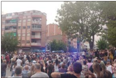
Manifestación por una familia conflictiva.