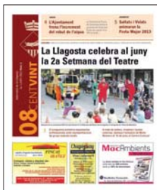
Primer número del 08centvint.

La Llagosta informa llega cada mes (excepto en agosto) a todos los domicilios de La Llagosta y también a los principales equipamientos. Se distribuyen 6.500 ejemplares gracias al trabajo del Departamento de Comunicación del Ayuntamiento, de la empresa Gestió Publicitària Local, que