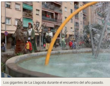
Los gigantes de La Llagosta durante el encuentro del año pasado.

La programación de las fiestas de San José empezará a desarrollarse el 16 de marzo con el Concierto de primavera que ofrecerá la Escuela Municipal de Música de La Llagosta. El día 18, la Parroquia de San José organizará una verbena en la plaza Antoni Baqué entre las 19 y las 23 h. El Parc Popular acogerá por la noche una fiesta para los jóvenes con la actuación de un DJ. El AMPA de la Escuela Les Planes montará un torneo de fútbol y una butifarrada el día 19. Aquel día, se hará una nueva salida por La Llagosta en el marco de los Paseos Mateu Bartalot. Durante toda la jornada, habrá en la plaza Antoni Baqué juegos para niños con material reutilizado. A las 20 h, el Centro Cultural albergará la actuación del monoliguista Sergio Bezos con entradas a 9 euros. El día 20, en la plaza de Antoni Baqué habrá un circuito con hinchables.