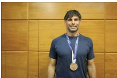
Antonio García, con la medalla de bronce de los Juegos Olímpicos.