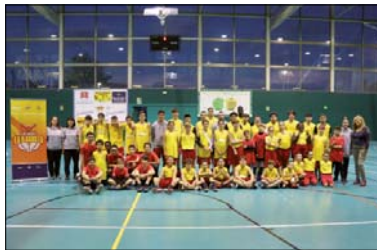
La imatge amb tots els conjunts del club.