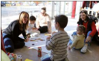
Una de les activitats que es van celebrar al Centre Cultural.

També hi va haver un taller organitzat per Som Tribu adreçat als infants i a les seves famílies, i una zona de jocs amb música. Posteriorment, es va representar l'obra FEEDBACK , a càrrec de La Carpa Espai Cultural. A més, es va reflexionar sobre les emocions dels infants i de les seves famílies amb la moderació de professionals de psicopedago-