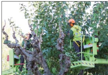
Treballs de poda al passeig del Pintor Sert.

L'empresa Tratamiento y Acondicionamiento de Laderas y Obras (TALIO), contractada per l'Ajuntament de la Llagosta, va començar el 16 de novembre els treballs de poda anual dels arbres de la nostra localitat per la zona del passeig del Pintor Sert. Personal de la Brigada municipal de jardineria treballa també des de fa setmanes en