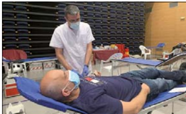
Una donació realitzada a la Llagosta.

La darrera captació de sang realitzada a la Llagosta, el 8 de novembre, es va saldar amb 93 donacions. La jornada, que va comptar amb la col·laboració de l'alumnat de sís de l'Escola Gilpe, va registrar deu nous donants, nou oferiments de persones que no van poder donar sang per diversos mo-