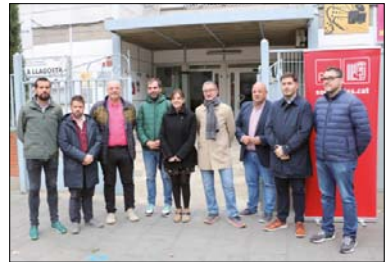
Alcaldes, regidors i diputats del PSC a la Llagosta.

Els alcaldes i alcaldesses de Mollet del Vallès, Granollers, Montmeló i Canovelles també van prendre la paraula per explicar les deficiències que pateixen en els seus municipis en matèria educativa, com ara al centre d'educació especial Can Vila, que també dona servei a la nostra localitat. Jordi Terrades, diputat del PSC al Parlament, va dir que "l'actual conseller d'Educació és el pitjor que hem tingut en els darrers anys; en FP, el fracàs és absolut". - Juanjo Cintas