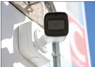
Una de les càmeres que hi ha a la Comissaria de la Policia Local.

Hi haurà un total de 16 càmeres en els següents emplaçaments: carrer de Nicolàs Longarón cruïlla amb carrer de la Florida, carretera N-152z cruïlla amb carrer de la Riera Seca, plaça d'Antoni Baqué, plaça d'Europa, plaça dels Drets Humans, avinguda Primer de Maig cruïlla amb carrer de l'Estació, carrer de l'Estació cruïlla amb passeig del Pintor Sert, Escola Joan Maragall, Pavelló Antonio García Robledo, estació de trens, avinguda de l'Onze de Setembre cantonada amb carrer de Joaquim Blume, Can Baqué, avinguda de l'Onze de Setembre cruïlla amb carrer de Jaume Balmes, Escola Les Planes,