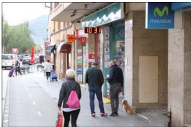
Exi comercial del carrer de l'Estació.

Els vals es podran fer servir des del 15 de desembre fins al 8 de gener. En el dors del descompte, es podran consultar totes les condicions per a la seva utilització. Només es podrà fer servir un val per domicili. Tots els comerços adherits a la campanya tindran a la porta un cartell identificatiu. La campanya de promoció