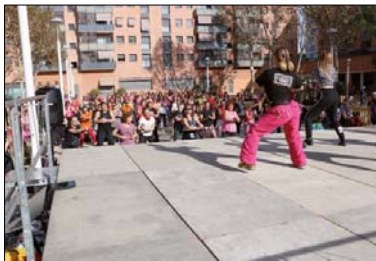
La plaça de la Sardana va acollir l'activitat.

La Colla Gegantera de la Llagosta va organitzar diumenge una nova edició de la Zumba Gegant. L'activitat, que es va desenvolupar a la plaça de la Sardana, va comptar amb la participació d'unes 200 persones i d'una vintena de monitors i monitores. A les 9.30 h, hi va haver una sessió amb el DJ Peris i, a les 10.30 h, va començar la Zumba Gegant, que es va perllongar fins a les 14 hores. La recaptació que es va aconseguir durant l'activitat, 1.300 euros, es destinarà a la Marató de TV3, que, aquest any, es dedica a la salut cardiovascular. - J. Cintas