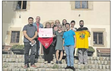
Lliurament d'un dels dos xecs a Mollet Contra el Càncer.