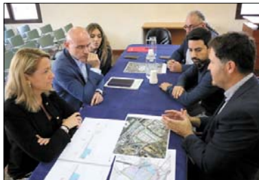
Reunión con la delegada del Gobierno en la Sala de plenos.