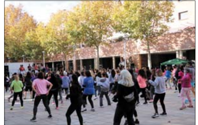
Una imagen de la Zumba Gigante del año pasado

que participarán en la jornada también venden entradas. A las 9.30 h, habrá una sesión con el DJ Peris y, a las 10.30 h, empezará la Zumba Gigante, que se prolongará hasta las 13.30 h. La recaudación se destinará a la Maratón de TV3, que este año se dedica a la salud cardiovascular. - Juanjo Cintas