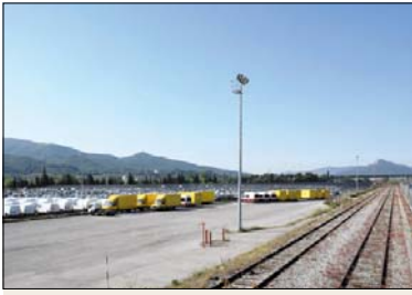
Parte del espacio que ocupará la nueva infraestructura.

Las obras de la futura estación intermodal de La Llagosta empezaron el 10 de octubre. La primera fase, con un presupuesto de 59,6 millones de euros y un periodo de ejecución de 26 meses, es ejecutada por la Unión Temporal de Empresas integrada por Sacyr Construcción, Sacyr Neopul y Copcsia. La actuación consiste en adaptar la futura estación intermodal de La Llagosta a los estándares europeos de mercancías. Está previsto realizar actuaciones de plataforma, vía y electrificación.