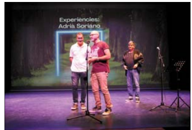
El acto de inauguración del curso se hizo en el Centro Cultural.

El Centro de Formación de Adultos ofrece cuatro niveles de la formación inicial, el Graduado en Educación Secundaria (GES 1 y GES 2), la preparación a las pruebas de acceso a los Ciclos Formativos de Grado Superior y a la universidad para mayores de 25 y 45 años, los cuatro niveles de Competic de informàtica i tres nivells de català, castellà, francès e anglès. - J.L.R.B.