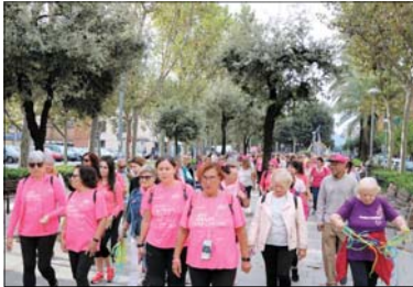
Algunas de las personas que participaron en la actividad.

Los participantes se concentraron en la plaza Antoni Baqué y, poco después de las 10 de la mañana, iniciaron un recorrido por diferentes calles de La Llagosta. La Caminata finalizó en la plaza Antoni Baqué, donde se pusieron a la venta diferentes objetos para colaborar en la lucha contra el