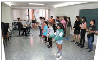
Una de las clases de la Escuela Municipal de Música.

La Escola de Música tiene una amplia oferta formativa con cursos para todas las edades. Hay música en familia dirigida a niños de 16 meses a 3 años con el objetivo de estimular su capacidad cognitiva; música y movimiento para niños de P4 y P5 con juegos musicales y aprendizaje; iniciación musical para niños de primero y segundo de Primaria, que servirá para introducir el conjunto instrumental al alumno como paso previo para escoger un instrumento definitivo; y la formación básica de niños, jóvenes y adultos en un instrumento. También se ofrece una