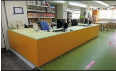
Uno de los mostradores nuevos de la Biblioteca.

La Biblioteca cuenta con nuevos mostradores de atención al público. El de la sala infantil tiene en el lateral un espacio para que puedan acercarse sillas de ruedas, una importante mejora en el ámbito de la accesibilidad y en la atención a las personas con discapacidad. Esta ha sido la última de las mejoras en el marco del Programa Complementario de equipamientos locales que convocó la Diputación para el periodo 2021-2022 y que la Biblioteca solicitó a través del Ayuntamiento de La Llagosta.