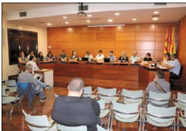
Una imagen del pleno del 27 de octubre.

Respecto a la ordenanza reguladora de la tasa para la recogida de basura, se incrementa la tarifa un 16%, aunque la previsión de incremento de los costes para 2023 es muy superior. Se trata así de acercarse a la recaudación real