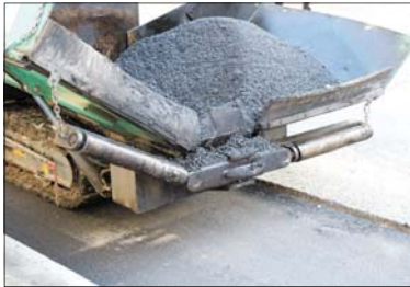
Imagen de archivo de una actuación anterior en La Llagosta.

El proyecto contempla la renovación de los pavimentos en la calle Miguel Hernández, en la de Federico García Lorca, en un tramo de la avenida Onze de Setembre, en la calle Santa Teresa, en dos tramos de la calle Estació, en la plaza de Les Corts Catalanes y en un tramo de la calle Jacint Verdaguer y de la del Progrés. También está previsto mejorar la accesibilidad en la ace-