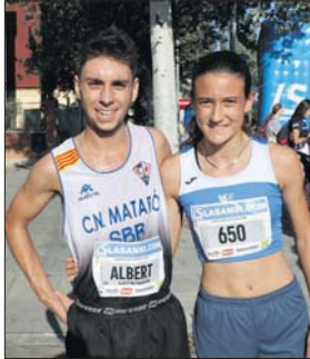
Guanyadors de la cursa de 5 km.

Després de les proves de 5 i 10 quilòmetres, es van celebrar les curses infantils de 800, 600 i 300 metres amb 92 inscrits. La Cursa Els 10 de la Llagosta no se celebrava des de