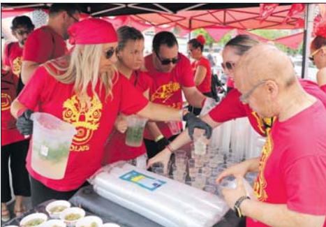
Una de les novetats de la Festa Major, la Vermujitada volada.