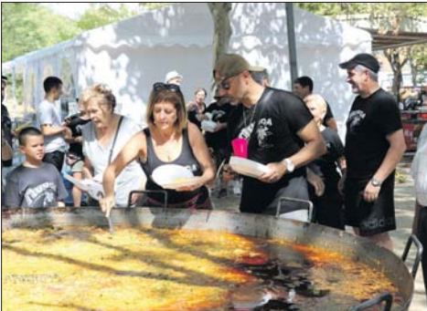
La paella va tornar amb la Murga.