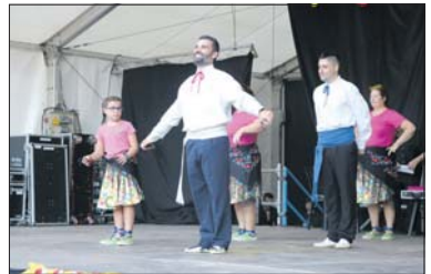
Actuació del Grup de Ball de Gitanes de la Llagosta.

Les inscripcions estaran obertes fins cobrir les 25 places. Cal posar-se en contacte amb Tropezando con Suerte per whatsapp (675 857 937) o per correu electrònic a l'adreça info@tcsuerte.org. - X. Herrero