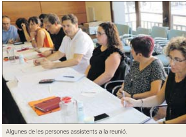
Algunes de les persones assistents a la reunió.

El saló de plens de l'Ajuntament de la Llagosta va acollir el 15 de setembre una reunió per tractar sobre els episodis de males olors que es van produir a l'estiu. A la trobada, van assistir representants dels ajuntaments de la Llagosta, Mollet, Santa Perpètua, Montcada, Sant Fost i Ripollet, de l'Àrea Metropolitana de Barcelona, del Consorci Besòs-Tordera, de la Universitat Politècnica de Catalunya i de l'Ecoparc 2.