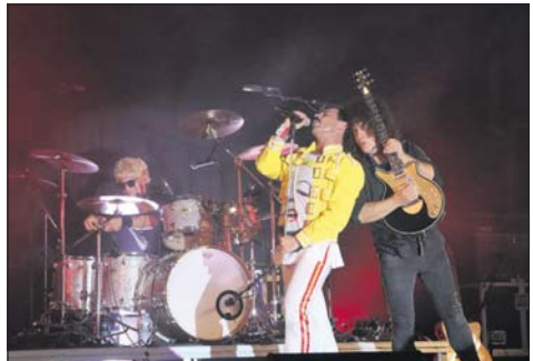
Remember Queen, un dels concerts de la Festa Major.