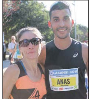
Guanyadors de la cursa de 10 km.

l'any 2019, perquè la pandèmia de la Covid-19 va obligar a suspendre la prova els dos darrers anys.