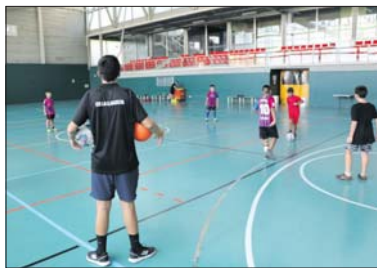
Un dels entrenaments de les Escoles d'Iniciació Esportiva.

mària a 2n d'ESO; i d'esports per a persones amb diversitat funcional per a infants, joves i adults sense limit d'edat. Els horaris dels entrenaments del futbol sala són els dimecres i els divendres, de 17.45 a 19 h; del voleibol, els dimarts i dijous, de 17.45 a 19 h i de 5è de Primària a 2n d'ESO, i de 19 a 20.15 h a partir de 3r d'ESO; de la iniciació esportiva, els dimarts i dijous de 18 a 19 h; d'handbol, dimecres i divendres de 17.45 a 19 h de 3r a 6è de Primària i de 19 a 20.15 h per a ESO, i de la diversitat funcional, els dilluns i dimecres de 19 a 20 h. - José Luis Rodriguez