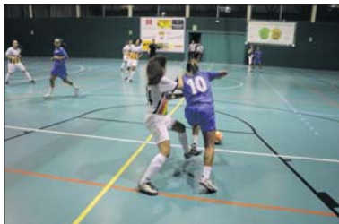
Darrer partit disputat pel conjunt de Segona Divisió espanyola.

Davant d'aquesta situació, la Concordia va arribar a un acord de col·laboració amb la Unió Esportiva Sant Andreu-Glories, que ha assumit la plaça a la Segona Divisió espanyola que pertanyia al club llagostenc.