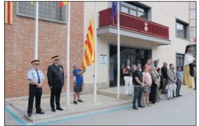
Hissada de la senyera el dia 11 de setembre.

desenvolupar a la plaça d'Antoni Baqué amb la col·laboració de l'Ajuntament, va comptar amb les actuacions de la Colla Gegantera de la Llagosta, l'Esbart Dansaire Sant Marçal de Cerdanyola del Vallès, el Ball de bastons de Castellar del Vallès, el Centro Cultural Recreativo Aragonés de Mollet del Vallès y Comarca y el Grup de Ball de Gitanes de la Llagosta. - J.C.