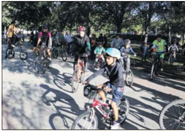
Sortida de la passejada des del Parc Popular.

La sortida i arribada de la passejada en bicicleta va ser el Parc Popular. El gran grup de participants va estar escoltat per la Policia Local i per Protecció Civil. "És una activitat que potencia l'ús dels vehicles no contaminants, que també permet fer esport i fer salut i, fins i tot, és més barat que un vehicle" , explicava la regidora de Medi Am-