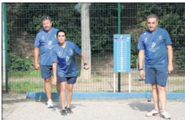
Un moment de la competició.