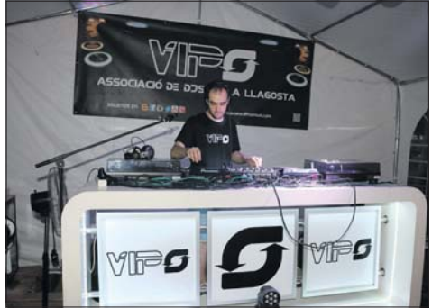
L'Associació de DJ's de la Llagosta VIPS va estar molt present a la Festa Major.