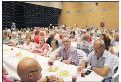
Un moment de l'homenatge a la gent gran.