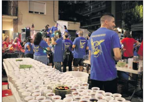
Sangriada popular amb els Sangrinaris.