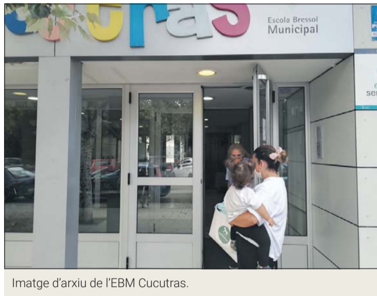
Imatge d'arxiu de l'EBM Cucutras.

La sol·licitud de preinscripció es considera formalitzada amb l'enviament del correu electrònic amb el formulari emplenat i la documentació acreditativa adjunta escanejada o fotografiada. La guarderia