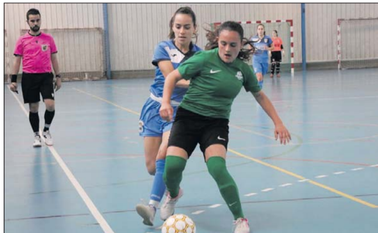
Una acció del partit contra les Corts.

El partit va ser molt igualat, però les de la nostra localitat van tenir més ocasions de gol. Durant els primers minuts, va buscar el gol Villa, amb tres xuts. Paula Jiménez va tornar