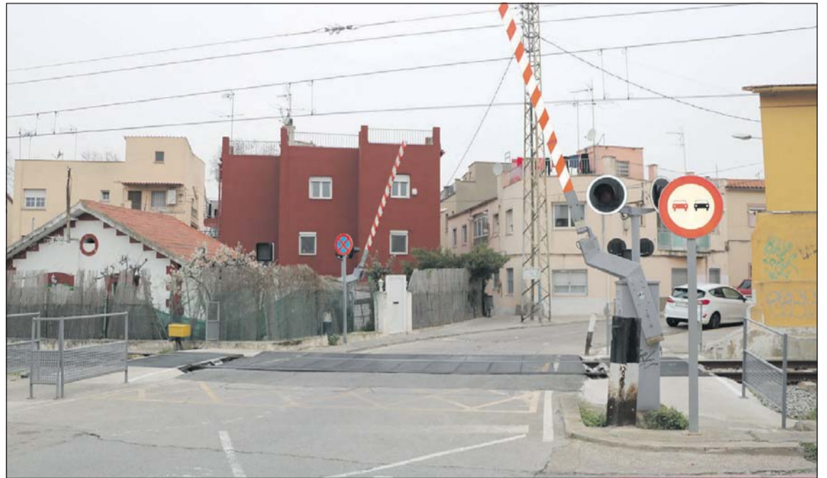
L'R3 al seu pas per la Llagosta.

Durant la reunió entre els dos ajuntaments també es va parlar de la futura àrea econòmica de Can Pere Gil, que ocupa terrenys dels dos municipis.