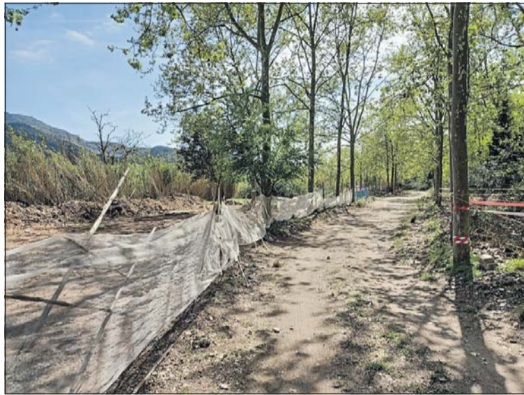
Part dels terrenys afectats.

El dia 6 d'abril, la Policia Local de la Llagosta va comprovar que en aquesta zona s'havien fet moviments de terra amb una màquina excavadora i que s'havien realitzat divisions de parcel·les. Els agents van obrir les corresponents diligències i van identificar a algunes persones que asseguraven que eren els propietaris de les parcel·les, que s'havien de destinar a horts. Les actuacions podrien ser considerades delictes mediambiental amb penes de presó. Posteriorment, operaris de la Brigada Municipal