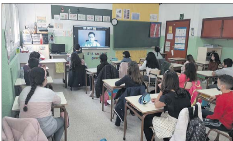
Una de les classes de quart de l'Escola Les Planes.

Biblioteca i més passos de viants als carrers de la Llagosta. Durant la conversa, els estudiants també van preguntar sobre la reforma d'alguns dels