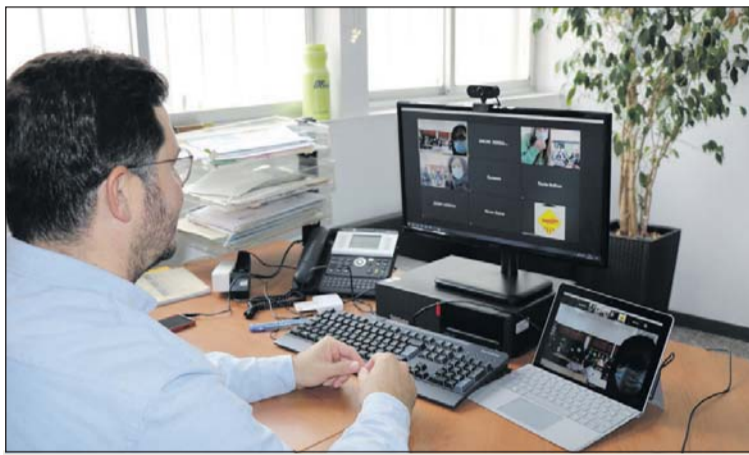
L'alcalde, durant la xerrada virtual amb l'alumnat de cinquè.

El dia 16, Sierra va repetir l'experiència amb l'alumnat de cinquè de Les Planes. Els estudiants van fer diverses preguntes a l'alcalde sobre els temes que més els interessin. L'alcalde els va agrair el seu comportament durant la pandèmia. Precisament, una de les preguntes va ser sobre la situació de la Covid-19 a la Llagosta. L'alumnat també va demanar més ordinadors a la