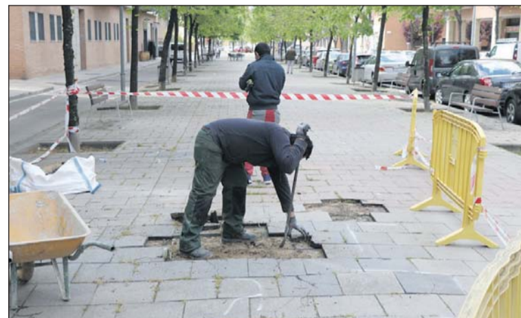
Substitució del paviment de Joan Miró.

A mitjans del mes d'abril van començar les obres de substitució de les peces del paviment del passeig de Joan Miró que es troben en mal estat. En concret, afecten a uns 100 metres quadrats d'aquest sector. L'Ajuntament de la Llagosta va contractar l'empresa Plamar del Maresme per portar a terme aquesta operació, que ha costat poc més de 7.000 euros. - J.C.