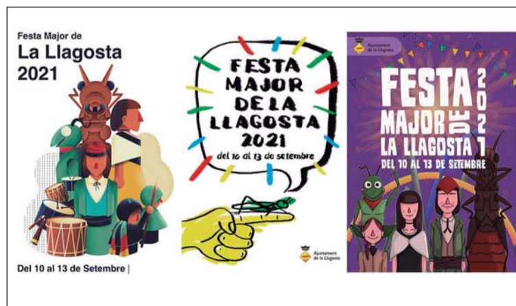
Els tres cartells finalistes.

Les votacions són electròniques i poden participar-hi totes les persones majors de 16 anys empadronades a la