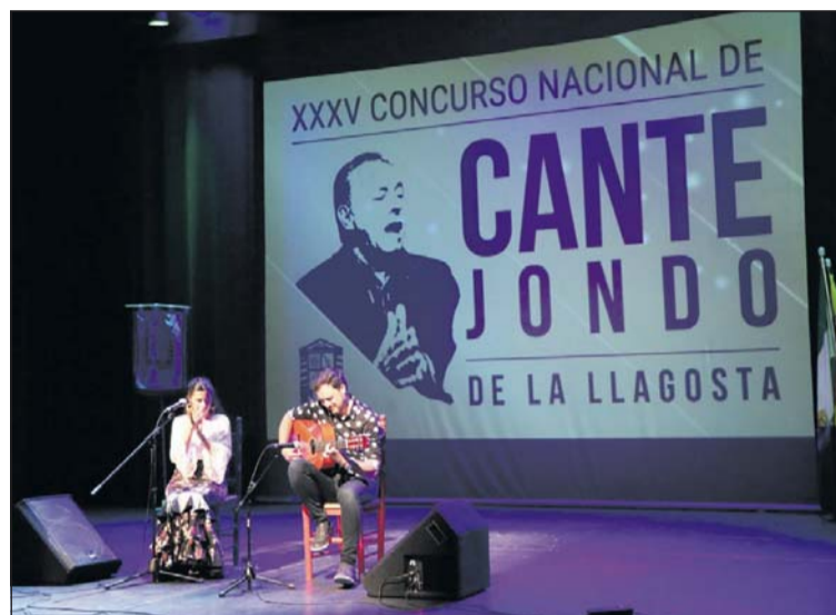
Una imatge d'una actuació del 35è Concurs de Cante Jondo.