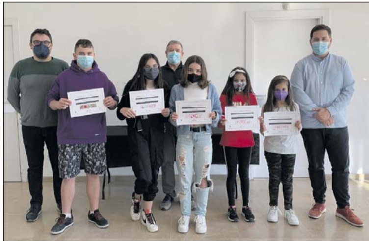
Els premiats en el Concurs de punts de llibre.

La temàtica dels punts de llibre era lliure, tot i que una gran part dels participants van optar per dissenys vinculats amb la Diada de Sant Jordi. En total, es van presentar 587 punts de llibre, entre les cinc categories.