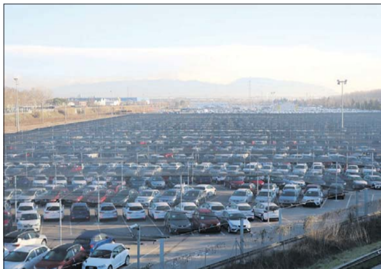
Part dels terrenys de la futura plataforma intermodal de la Llagosta.

El Centre logístic intermodal de la Llagosta estarà situat al costat de l'Estació de Rodalies. Aquest projecte pretén potenciar la instal·lació de la Llagosta, que en l'actualitat dedica prioritàriament la seva activitat al trànsit d'automòbils i que està situada en una zona connectada a xarxes viàries d'alta capacitat i de gran activitat industrial. A més, disposa de totes les prestacions i dimensions per ampliar i millorar la seva infraestructura i incorporar noves funcionalitats, que la posicionin com a nus estratègic i passi a ser una plataforma intermodal de primer ordre a l'entorn més