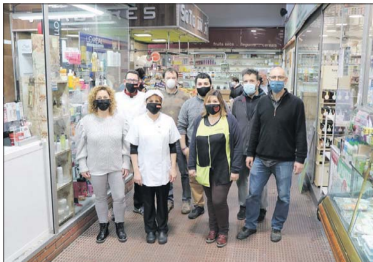
Alguns dels paradistes que s'han sumat al nou projecte.

D'una sola vegada es podran fer compres a diferents parades amb únic pagament. Després es podrà fer la recollida al Mercat. També hi ha l'opció d'enviament a domicili amb un cost de 5 euros, però limitat als municipis de la Llagosta, Mollet, Santa Perpètua i Montcada. El repartiment a domicili es fa els dimarts, de les 10 a les 12 hores; els divendres, de les 18 a les 20 hores i els dissabtes, de les 12 a les 14 hores. En tot moment es garanteix el manteniment de