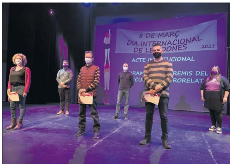
Un moment de l'acte celebrat el 8 de març.

Posteriorment a l'acte institucional, es van poder veure pel