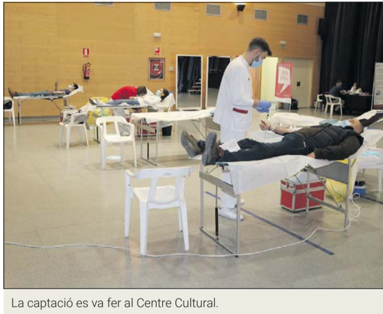
La captació es va fer al Centre Cultural.

La darrera captació de sang a la Llagosta es va saldar amb 73 donacions. Durant el matí van passar 32 persones i a la tarda, 41. La campanya del Banc de Sang va tenir lloc el 12 de març al Centre Cultural de la plaça de l'Alcalde Sisó Pons i comptava amb la col·laboració de l'alumnat de sisè de l'Escola Gilpe, que es va encarregar de la difusió i va elaborar uns punts de llibre per als donants. Durant la captació, sis persones més es van oferir a donar sang, però no ho van poder fer per diversos motius. Al llarg de tota la jornada, es van registrar set persones que donaven sang per primera vegada.