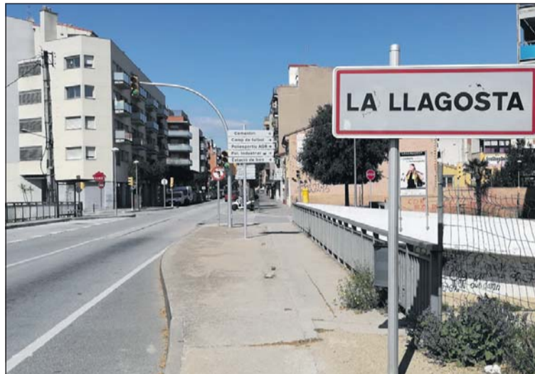
La Llagosta es declara municipi feminista.

El Ple va aprovar el 25 de març una declaració institucional per la qual la Llagosta passa a ser un municipi feminista. L'acord va comptar amb el suport de tots els grups municipals. L'Ajuntament s'adhereix a la Carta Europea per a la Igualtat de Dones i Homes a la Vida Local i se suma al Decàleg per a la construcció de ciutats feministes. Per fer visible el compromís de suport municipal amb la lluita i el moviment feminista, es col·locarà a l'entrada i a la sortida de la població una senyalització amb el missatge La Llagosta, Municipi Feminista.