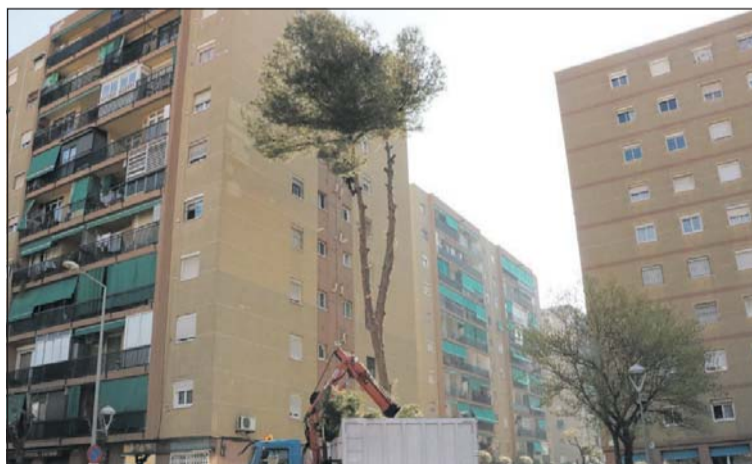
Treballs de retirada de l'arbre.

Davant del perill que caigués a terra el pi de grans dimensions que hi havia entre el carrer del Pintor Fortuny i l'avinguda del Primer de Maig, davant de la plaça dels Drets Humans, l'Ajuntament s'ha vist obligat a talar-lo. Un informe de l'arquitecte municipal considera que hi havia aquest risc i que, a més, l'arbre podia afectar als fonaments de l'edifici que hi ha tot just al costat. També podria crear problemes d'humitats en aquest immoble. Les persones que resideixen en aquest edifici ja van lliurar un escrit a l'Ajuntament informant sobre el perill que suposava el pi. Per tots aquests motius, el Consistori va decidir finalment talar l'arbre, una operació que