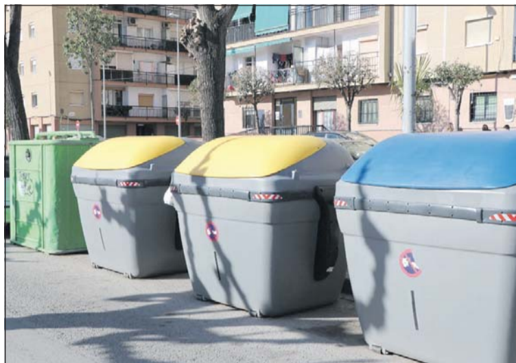
Contenidors de reciclatge de residus al passeig del Pintor Sert.

L'any de la pandèmia, totes les fraccions relacionades amb el reciclatge van créixer, excepte l'orgànica i el tèxtil. Destaquen les 266 tones de paper i cartró, superant en més de 80 les tones recuperades el 2019, quan es van recollir 185,68. Els envasos van passar de les