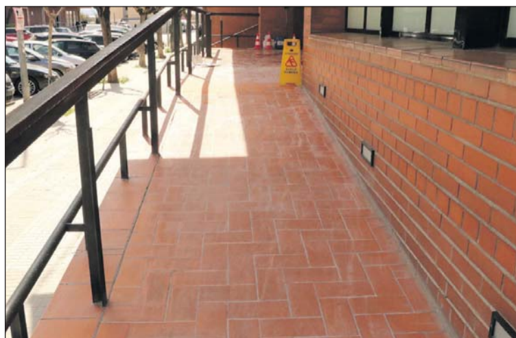
La rampa del Casal d'Avis després d'aplicar el tractament.

L'Ajuntament ha aplicat un tractament antilliscant a la rampa i a l'escala d'accés a l'edifici del Casal d'Avis. L'operació la va portar a terme el 22 de març l'empresa especialitzada ANTIDESLIM per un import de 1.407,23 euros. El desgast del terra ha obligat a aplicar aquest tractament, molt necessari, sobretot en la rampa. - J.C.