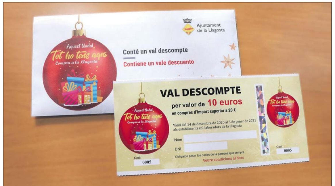
Vale de descuento de la campaña de promoción del comercio local que se enviará a cada domicilio.

Los 60.000 euros que se destinarán a la campaña de promoción del comercio local provienen de una modificación presupuestaria, que se aprobó el 17 de noviembre por unanimidad en una sesión extraordinaria y urgente del pleno. Así, se traspasan 60.000 euros de la partida de promoción económica a la de comercio. “Esta modificación presupuestaria va ligada a un