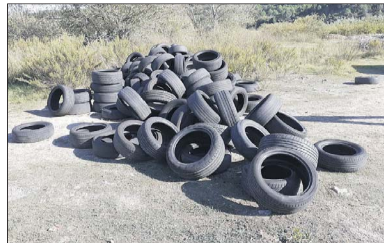
Vertido de neumáticos en Can Donadéu.

les y le informaron que debía retirar los neumáticos. En un primer momento, esta persona aseguró que otra empresa se encargaba de deshacerse de los neumáticos. Posteriormente, dijo que había dado los neumáticos a una persona para una actuación en su casa y que habría sido ella la que habría hecho el vertido y facilitó a la policía su teléfono móvil. El 2 de noviembre, el propietario retiró los neumáticos de la zona de Can Donadéu. El expediente abierto por el Ayuntamiento de La Llagosta sigue su curso. - J.C.