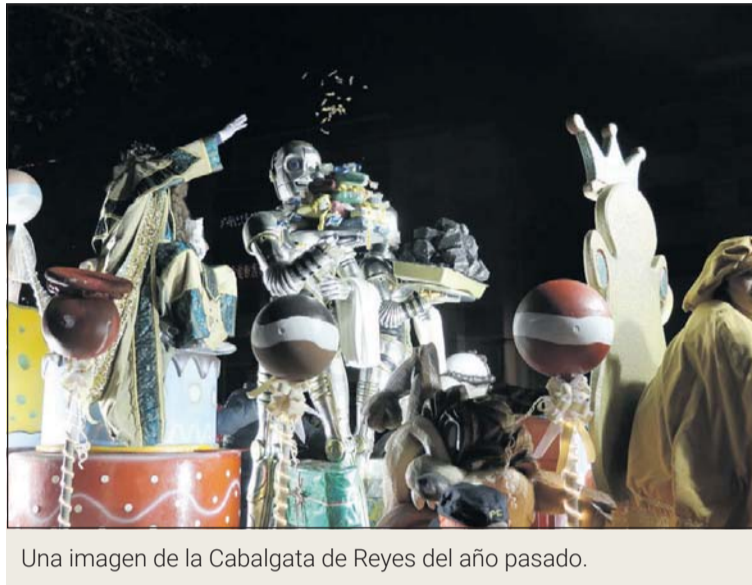
Una imagen de la Cabalgata de Reyes del año pasado.

La pandemia del Covid-19 también influirá en la celebración de la Navidad. Los Reyes Magos de Oriente no faltarán a su cita, pero la Cabalgata será diferente en esta ocasión. En el recorrido sólo participarán las carrozas de Melchor, Gaspar y Baltasar. La Cabalgata comenzará a las 17 horas y será más larga de lo habitual porque llegará al mayor número de calles posibles. Por ello, se pide a la población que siga la visita de los Reyes Magos desde los balcones y que sólo salgan a la calle, respetando el distanciamiento social, los que no tengan esta opción. Tampoco se lanzarán caramelos.