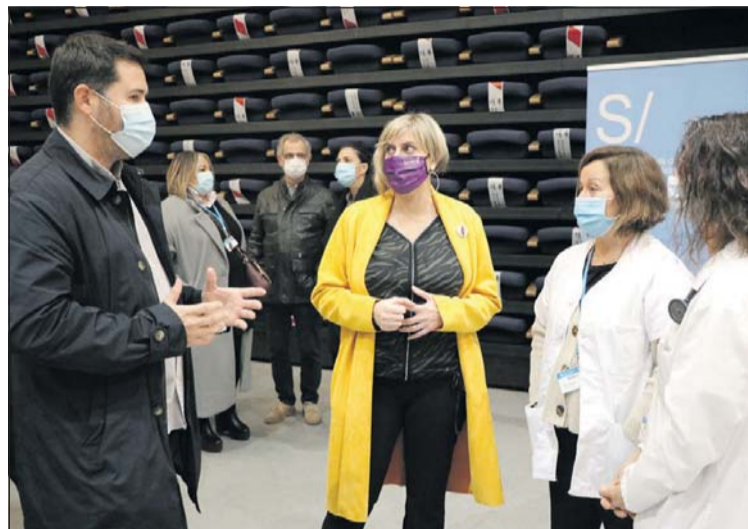
La consejera y el alcalde, en el Centro Cultural de La Llagosta.

sales del municipio. Con los cribados intensivos se trata de detectar el máximo número posible de personas infectadas ya que algunas personas no presentan síntomas y pueden, sin saberlo, transmitir el virus a su familia, amigos y otras personas de su entorno. La consejera de Salud de la Generalitat, Alba Vergés, visitó el 24 de noviembre La Llagosta para comprobar el funcionamiento del cribado intensivo. Vergés estuvo acompañada por el alcalde de La Llagosta, Óscar Sierra. La consejera habló con las personas responsables del dispositivo. El alcalde aprovechó la visita de la consejera para recordarle la importancia de reabrir el servicio de urgencias del am-