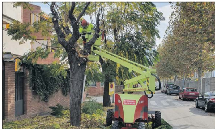
Poda de árboles junto al Campo de Fútbol Joan Gelabert.

La empresa Tratamiento y Acondicionamiento de Laderas y Obras (TALIO), contratada por el Ayuntamiento, asumió días después el grueso de la poda con una actuación sobre unos 980 árboles. Los trabajos estarán terminados durante este mes de diciembre. La empresa TALIO ha ganado el concurso para hacer la poda