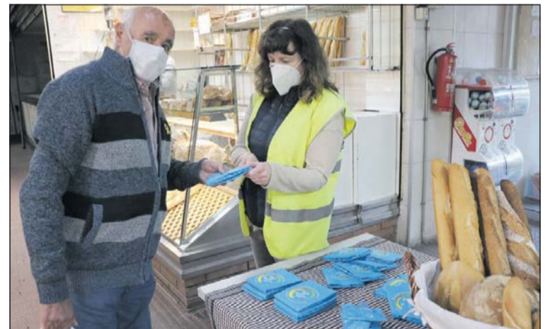
Entrega de un portabocadillos.

da en nuestro municipio fuera en gran parte telemática. Sin embargo, hubo un par de propuestas presenciales. Los días 23 y 27 de de noviembre tuvo lugar un reparto de portabocadillos reutilizables en el Mercado Municipal. En el Mercado, se instalaron unos contenedores para recoger teléfonos móviles para reciclar. Durante toda la Semana de Residuos estuvo en marcha el Ecotrivial, una serie de preguntas sobre reciclaje para reflexionar sobre cómo se tratan los residuos. El Ecotrivial estuvo disponible a través de Instagram. También se ofrecieron una serie de recursos multimedia, entre ellos un vídeo sobre un taller de reciclaje para aprender a convertir un paraguas en una bolsa. También hubo cápsulas sobre residuos invisibles, sobre cómo utilizar los contenedores de reciclaje y un vídeo que explica dónde se deben tirar las mascarillas. Además hubo información sobre temas como la ecoetiqueta o la limpieza digital. - X. Herrero