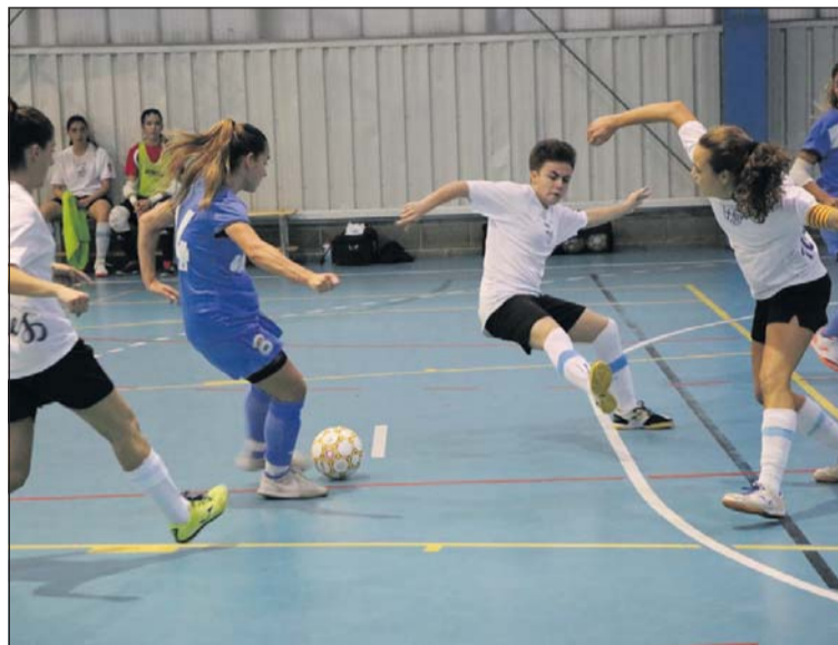
Una jugada del único partido que la Concòrdia ha jugado en casa.