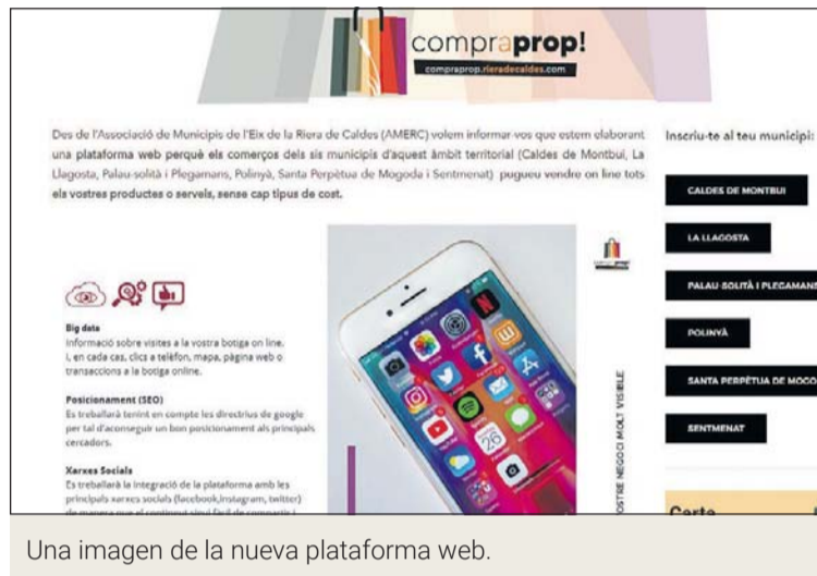
Una imagen de la nueva plataforma web.

La Associació de Municipis de l'Eix de la Riera de Caldes (AMERC), de la que forma parte el Ayuntamiento de La Llagosta, está preparando una plataforma web para que los comercios de los municipios asociados puedan vender en línea todos sus productos o servicios, sin ningún tipo de coste para las tiendas. Los comercios de La Llagosta, Caldes de Montbui, Palau-solità i Plegamans, Polinyà, Santa Perpètua de Mogoda i Sentmenat tendrán la oportunidad de tener su propia tienda virtual personalizable.