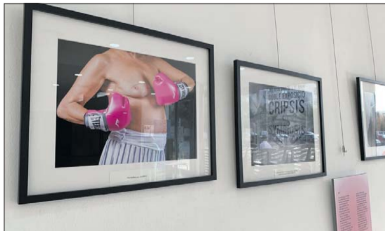
Part de la mostra que es pot visitar al Centre Cultural.

I si te les toques? és un recull de 31 imatges que vol sensibilitzar sobre la prevenció del càncer de mama i sobre la importància de l'autoexploració mamària. A Espanya es diagnostiquen cada any més de 33.000 nous casos de càncer de mama. L'exposició es una iniciativa de l'Associació Fotogràfica i de Caminades de