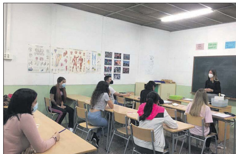
Una de les classes de l'Escola d'Adults.

Tot i haver començat les classes, l'oferta de matriculacions de l'Escola d'Adults de la Llagosta segueix oberta fins esgotar les places dels cursos. El centre de formació llagostenc ofereix ensenyaments de Primària, Secundària, informàtica, català, castellà, francès, anglès, formació per preparar l'accés als cicles de grau superior i a la universitat i el graduat en ESO. - José Luis Rodríguez Beltrán