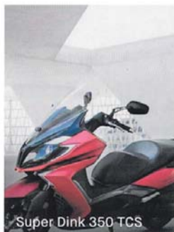
Super Dink 350 TCS