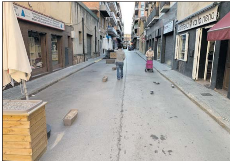
Terrasses buides al carrer de Sant Miquel.

A la Llagosta, el 22 d'octubre no es va celebrar el mercat ambulant perquè no es podia garantir la reducció de l'aforament que havia dictaminat poc abans la Generalitat. El Consistori es va reunir posteriorment amb els paradistes i es va acordar celebrar novament el mercat a partir del 29 d'octubre d'acord amb unes mesures de seguretat que va