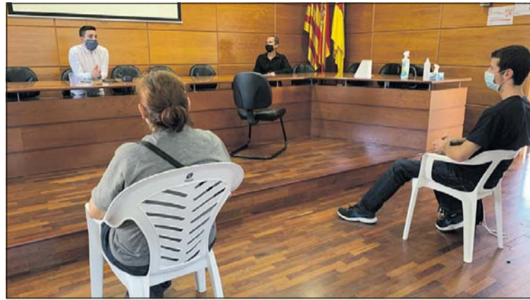
Reunió amb els impulsors dels projectes més votats.

La proposta més votada per la ciutadania va ser la dignificació de les colònies de gats existents, que pretén assegurar que els animals estaran en condicions més sanes i se-