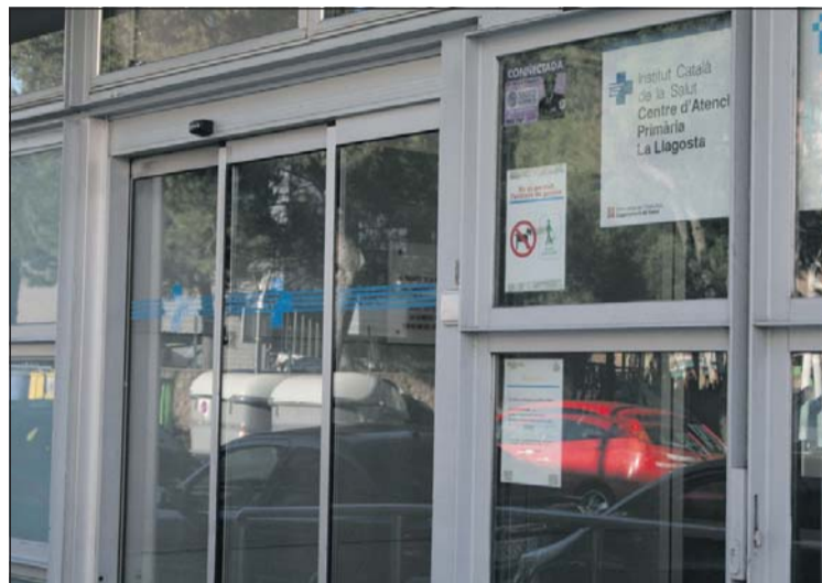
Porta de l'ambulatori de la Llagosta.