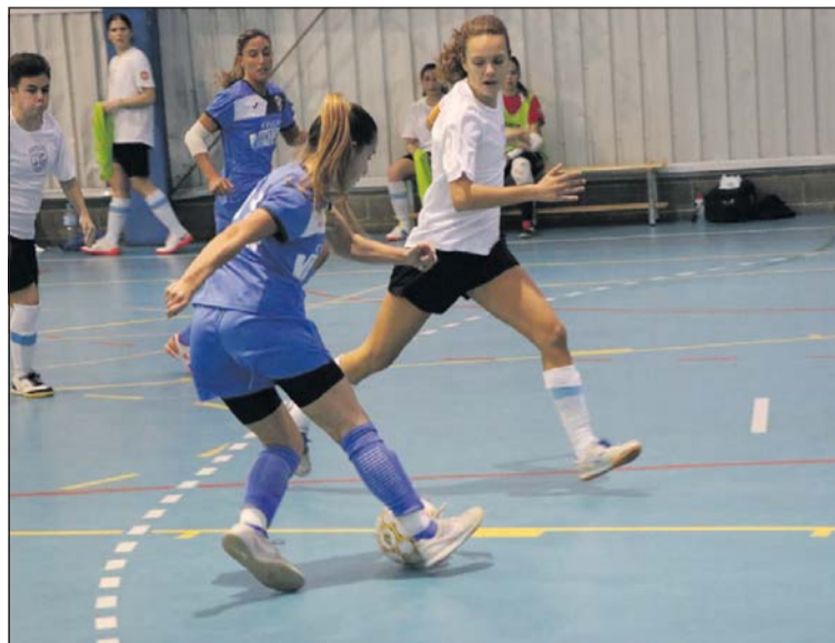
Buti, en una acció d'atac de les llagostenques.

Al minut 3 de la segona part, Buti va xutar, la portera visi-