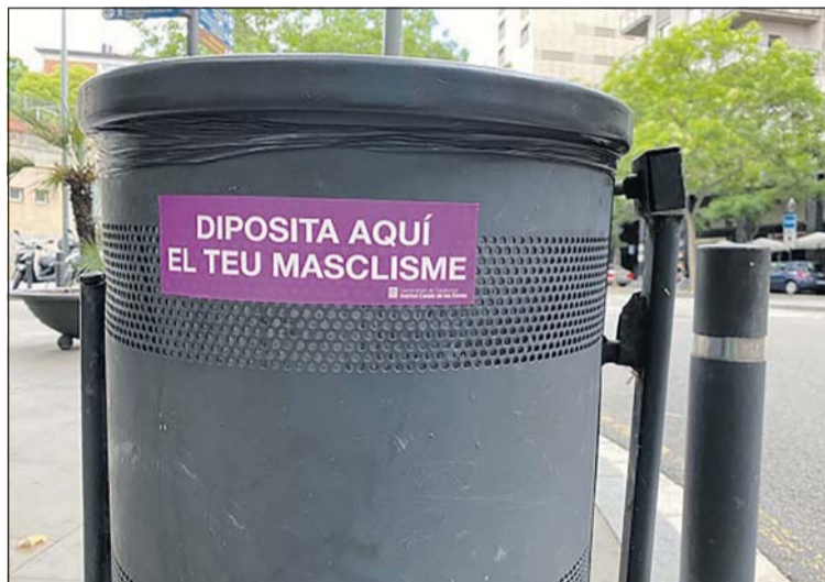
Una paperera amb un adhesiu de la campanya

L'Ajuntament de la Llagosta ha preparat diverses activitats amb motiu de la commemoració el 25 de novembre del Dia Internacional per a l'Eliminació de la Violència envers les Dones. El mateix dia 25 hi haurà una sessió especial de L'hora del conte que podrà ser seguida a l'Instagram de la Biblioteca. A més, des de la Regidoria d'Igualtat, s'organitzarà el 30 de novembre el taller Desgranant la mirada , que es farà de forma telemàtica. L'acte institucional es canvia per una vídeolectura del manifest institucional.