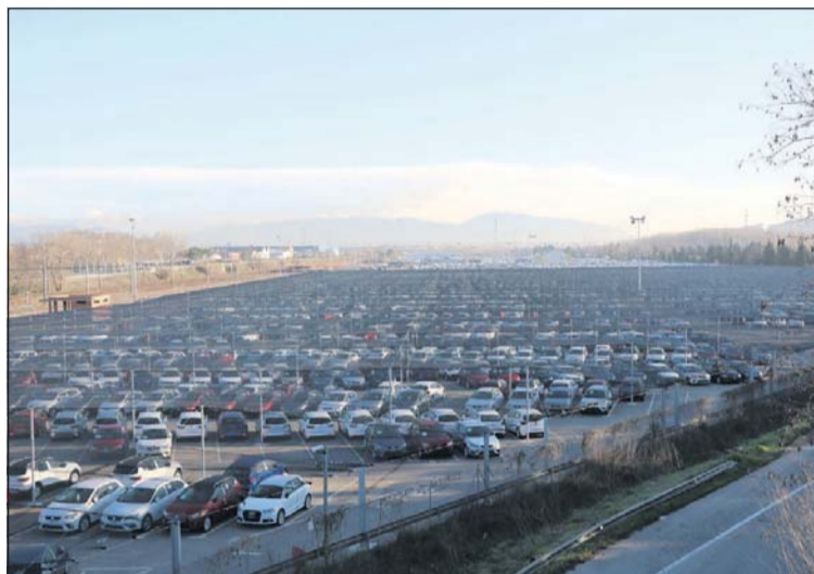
Part dels terrenys en els quals s'ubicaria l'estació intermodal.

La Generalitat i el Govern Central han signat un protocol per impulsar les noves infraestructures i planificar el nus logístic de l'àrea de Barcelona. El document contempla la nova terminal intermodal de mercaderies que s'ha d'instal·lar a la Llagosta i proposa l'elaboració dels estudis necessaris per a la planificació i gestió col·legiada de les terminals ferroviàries del nus logístic de l'àrea de Barcelona, analitzant l'opció tècnica, econòmica i jurídica més òptima.