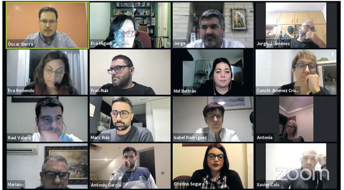
Els plens es continuen celebrant de forma telemàtica.

Les tarifes d'aquesta ordenança ja van tenir una revisió, en aquell cas a la baixa, durant l'exercici 2019, que va suposar una rebaixa molt important en les diferents tarifes