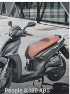
People S 125 ABS