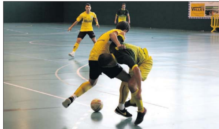
Una acció del partit contra la Peña Recreativa.

El primer equip del Fútbol Sala Unión Llagostense és el vuitè classificat al grup B de la Lliga Nacional amb un punt després de la celebració de dues jornades. Els llagostencs van debutar amb una derrota per 1 a 3 contra la Peña Recreativa de Sant Feliu de Llobregat. Els de la nostra localitat van fallar molt de cara a porteria i els visitants van estar més encertats. El partit es va disputar amb aforament limitat a les graderies del CEM El Turó.