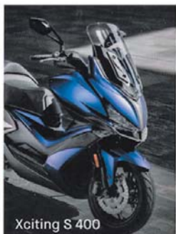
Xciting S 400