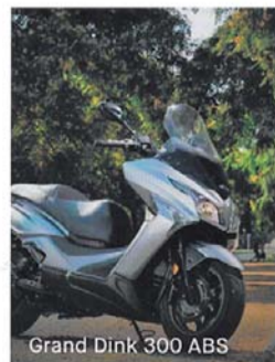
Grand Dink 300 ABS

Financia tu KYMCO con el exclusivo PLAN DÚO y disfruta en la financiación de la misma libertad que en la carretera.