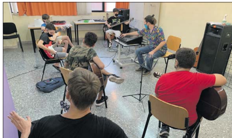
Un moment d'una classe de l'Escola de Música.

El centre està ubicat a la tercera planta de Can Pelegrí, però, per complir amb la distància de seguretat entre l'alumnat, les classes s'han distribuït entre la tercera planta i dos espais de la segona, cedits per l'Ajuntament. "El maldecap que teníem eren les classes de conjunt i les podem realitzar gràcies a poder ocupar dues sales de la segona planta. Per a les classes d'instruments, no hi havia