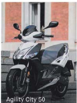
Agility City 50