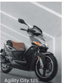
Agility City 125