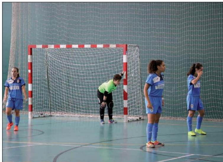
Les llagostenques debutaran el 17 d'octubre al CEM El Turó.

La primera fase es disputarà en una lligueta a dues voltes, amb un total de 18 jornades. La Concòrdia descansarà a les jornades 7 i 16. La resta de rivals de les llagostenques en l'agrupació 2A són els catalans AECS L'Hospitalet, Mataró, Castelldefels, CN Caldes i Eixample i de les Illes Balears, l'Atlético Mercadal. L'objectiu de la Concòrdia és classificar-se entre els quatre primers del grup 2A per disputar la segona fase per l'ascens. En cas contrari, aniria a la segona fase per la permanència. En els dos casos, els punts aconseguits de la primera fase s'arrosseguen a la