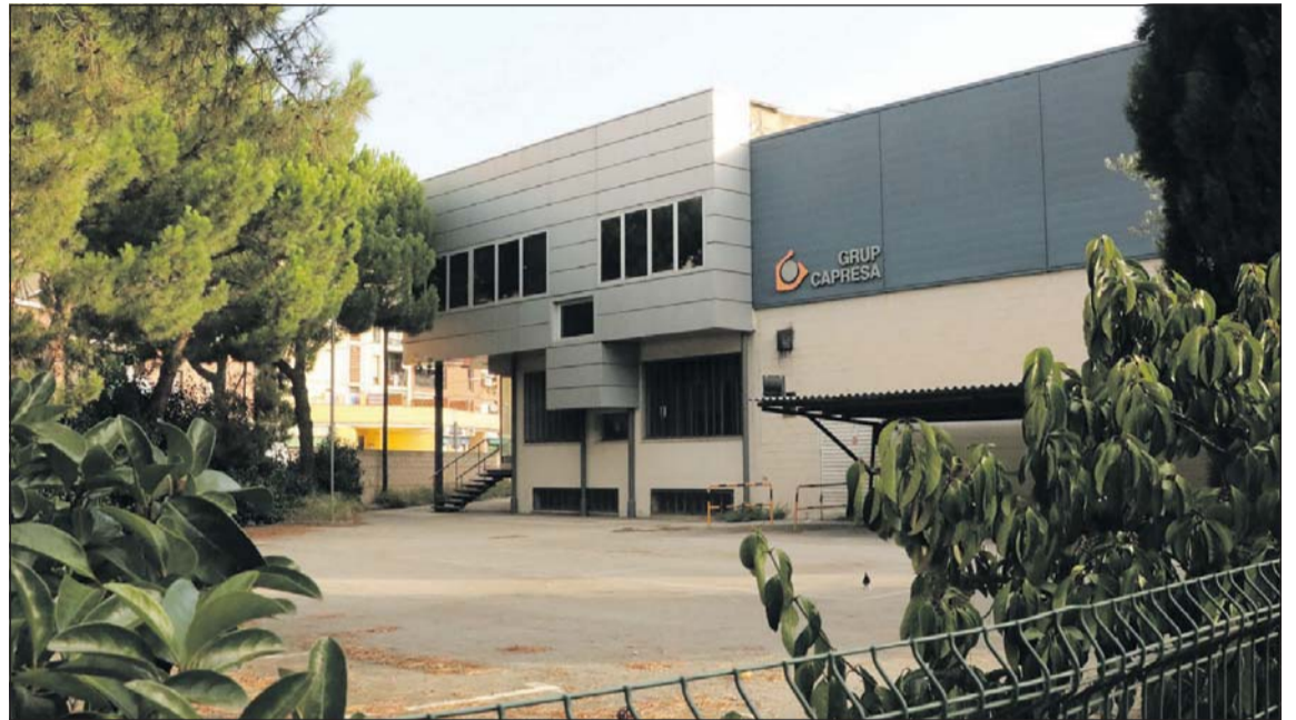
Una part dels terrenys de Capresa.

Un cop aprovada definitivament la modificació s'estableix el següent calendari d'actuacions: un any per a l'aprovació dels documents de gestió obligatoris i dos anys per finalitzar la urbanització de les zones verdes. A partir d'aquí, els propietaris tindran un període màxim de cinc anys per construir els habitatges, tenint en compte que durant els tres primers anys