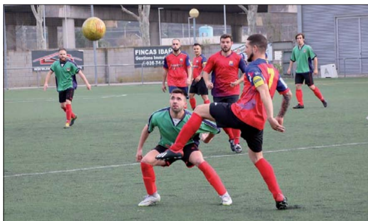
Un partit de la temporada passada del primer equip.