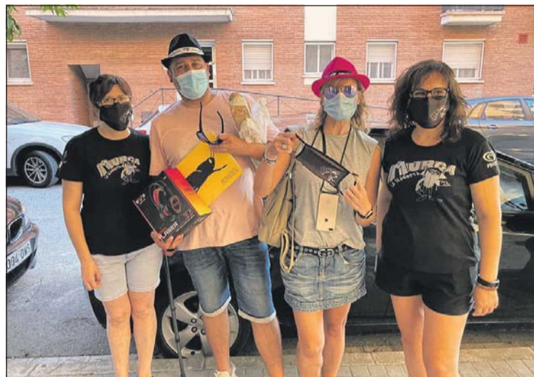
Alguns dels premiats per la Murga durant la Festa Major virtual.

La Murga va lliurar diferents obsequis a algunes de les persones que van participar en les seves propostes de Festa Major virtual a través de les xarxes socials.