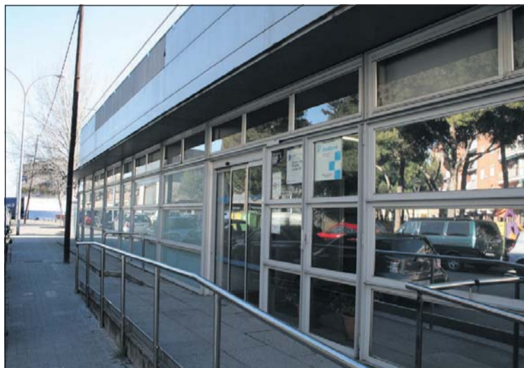
Porta d'entrada principal de l'actual ambulatori.

El dia 3 de febrer el Servei Català de la Salut va acordar encarregar a Infraestructures.cat la redacció del projecte de construcció del nou ambulatori de la Llagosta. L'Ajuntament de la Llagosta va cedir al Servei Català de la Salut de la Generalitat part de l'espai situat darrere de l'edifici Consistorial entre l'avinguda de l'Onze de Setembre i els carrers del Mercat i de Jaume Balmes. En aquest terreny, la Generalitat construirà un ambulatori