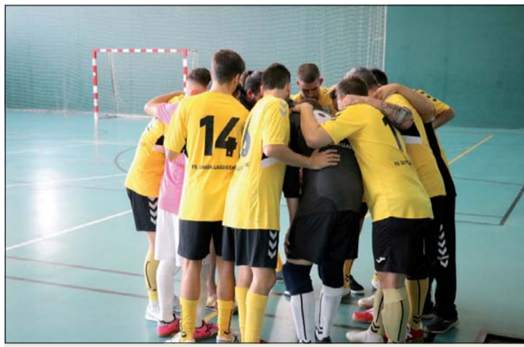
Jugadors del FS Unión Llagostense, abans d'iniciar un partit.

L'equip llagostenc començarà la primera fase dissabte a casa contra la Penya Recreativa Sant Feliu Llobregat i l'acabarà el 12 i 13 de desembre com a visitant a la pista de l'Atlètic Arrahona. En aquesta primera