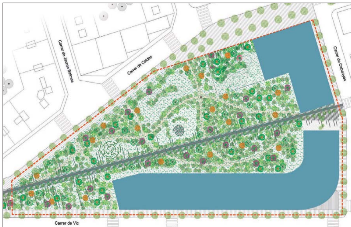
Plànol general de la nova ordenació urbanística.

Quan arribi el moment, l'Ajuntament de la Llagosta informarà a través de tots els mitjans de comunicació municipals del procés per a la compra d'un habitatge en règim de protecció. Ara com ara, el projecte està en la seva fase inicial i no hi ha més informació concreta.