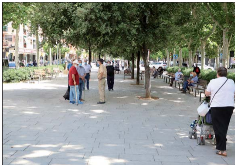
El passeig de l'Onze de Setembre, punt de trobada de la ciutadania.

A la nostra localitat, dos grups d'estudiants de INS Marina, un de primer de Batxillerat i un altre de segon d'ESO, un de l'Escola Les Planes i un altre