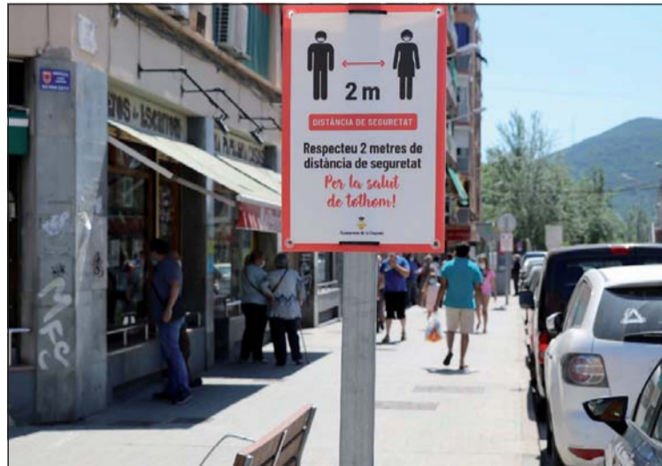
El pressupost té diverses partides per a la crisi del coronavirus.

El pressupost municipal de 2020 és d'11.303.913 euros. En el marc del Pacte per la reconstrucció, econòmica i social del municipi de la Llagosta, el pressupost destina 100.000 euros a l'àmbit del comerç per ajudar al comerç local en les despeses assumides referents a l'adquisició d'equips de protecció individual o adequació de locals, uns altres 100.000 euros a l'àmbit de la promoció econòmica per tal de destinar recursos a la millora de l'ocupabilitat de la ciutadania i la lluita contra l'atur, i 100.000 euros més a l'àmbit del benestar social per tal de reforçar partides ja existents davant del previsible increment de sol·licituds i necessitats a cobrir.