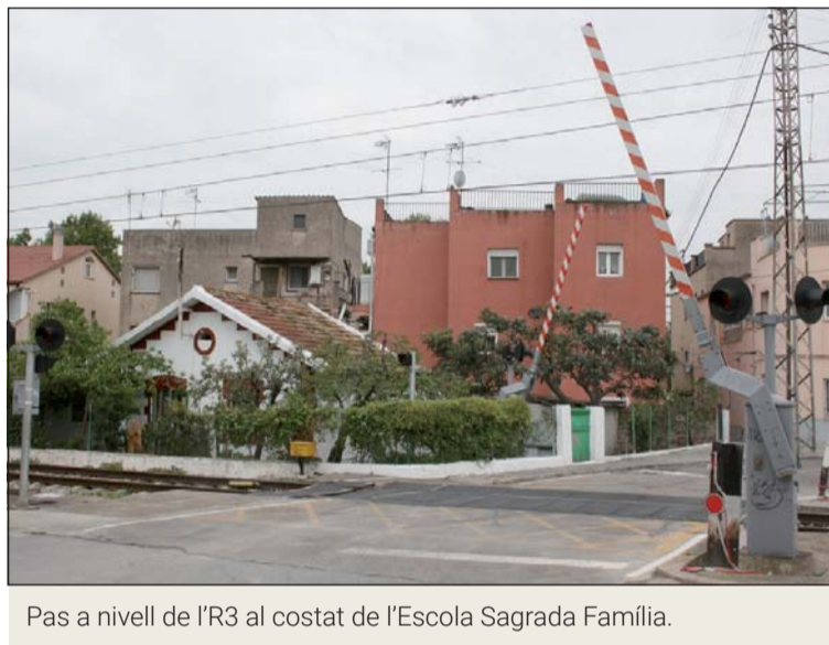
Pas a nivell de l'R3 al costat de l'Escola Sagrada Família.

Pel que fa a l'Estació de Mercaderies, l'Ajuntament creu que l'aposta pel transport de mercaderies per ferrocarril ha de ser primordial en un model eficient que exigeix un ús eficient de les infraestructures de comunicacions per carretera i per ferrocarril. Aquest model necessita el desenvolupament a curt termini de l'Estació in-