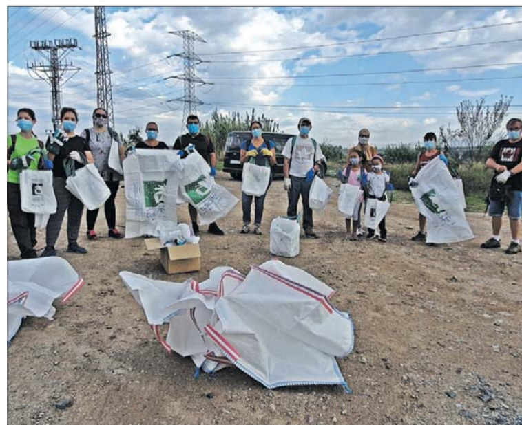
Alguns dels participants en la jornada.

La regidora de Medi Ambient ha indicat que l'Ajuntament treballarà per poder planificar algunes accions en el marc de la Setmana Europea de la Prevenció de Residus, que se celebrarà del 21 al 29 de novembre. - Xavi Herrero