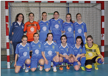
El CD la Concòrdia, minuts abans del partit contra el Cervera-Segarra.

La Concòrdia encadena set victòries a la Divisió d'Honor i es manté en la lliura per l'ascens al segon lloc. Les llagostenques estan a nou punts del líder, el FS Ripollet