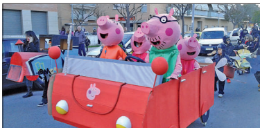
La familia Peppa Pig visita La Llagosta , millor comparsa petita.