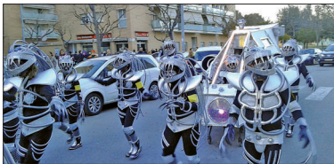
Invasión Drakkars , millor comparsa gran.

D'altra banda, l'Ajuntament ha fet públiques les despeses de Carnestoltes. Enguany, el Consistori hi ha destinat uns 9.000 euros. - XAVI HERRERO