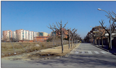
Terreny davant del camp de futbol on es farà la zona d'aparcament.

La Diputació de Barcelona ha confirmat l'atorgament de les subvencions que l'Ajuntament