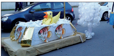
Baño de pato , millor disfressa individual.