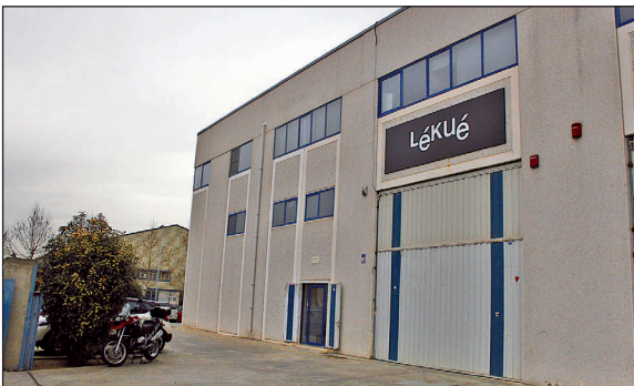
Façana de l'empresa Lékué, al carrer de Vic del polígon industrial de la Llagosta.

L'Ajuntament va aprovar el 26 de febrer aplicar una bonificació del 95% (uns 10.000 euros) a l'empresa Lékué en la liquidació de l'Impost sobre construccions i obres per unes reformes que ha fet a les seves oficines. El punt del ple de febrer va comptar amb el vot a favor de l'equip de govern municipal i l'abstenció dels tres grups de l'oposició