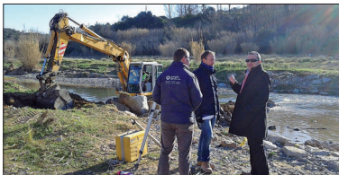
Primer dia d'obres a la zona del camí de Can Donadéu, el 24 de febrer.

El 24 de febrer, van començar les obres de la passera del Besòs. Els treballs es van iniciar amb retard degut a que durant els últims mesos de 2014 la meteorologia no va fer possible intervenir sobre el terreny i perquè l'Ajuntament de la Llagosta ha redefinit el projecte per fer una passarella millor que el gual inundable de ciment que hi havia històricament al camí de Can Donadéu. - P.D.