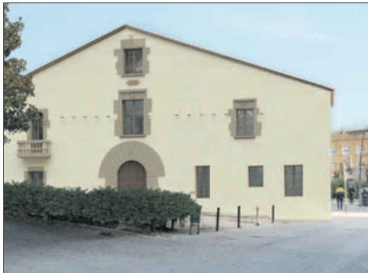
Simulació de la masia de Can Baqué reformada.

Un dels objectius de l'obra és preservar i mantenir els valors que transmet la masia de Can Baqué per a les futures generacions del municipi i per tal que puguin conèixer de primera