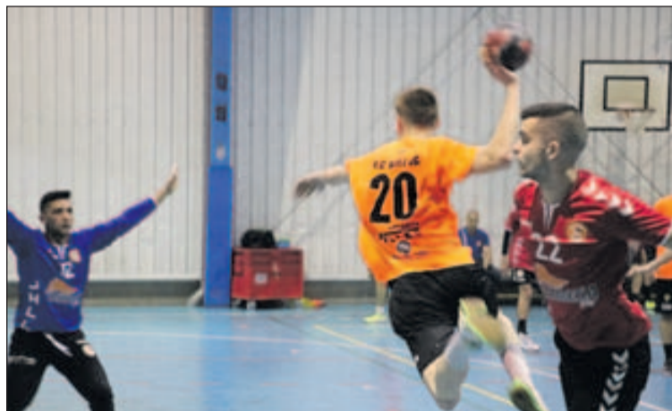
Una acció d'atac del Vallag durant el derbi.

La segona part va començar amb un parcial de 0 a 2 a favor dels d'Iglesias. El Joventut Handbol es va arribar a col·locar a cinc gols (19-24),