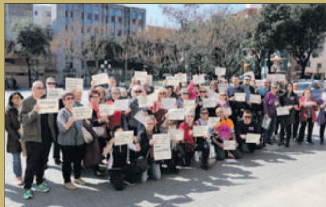
Un grup de persones es va concentrar el 8 de març a la plaça d'Antoni Baqué amb motiu de la jornada de vaga convocada per diversos sindicats en el marc de la commemoració del Dia Internacional de les Dones.