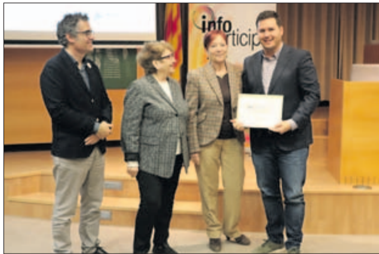
L'alcalde rep el Segell Infoparticipa.