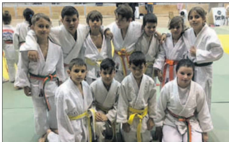
Alguns dels judokes llagostencs.

"Estem molt satisfets d'aquest campionat, que és com si fos