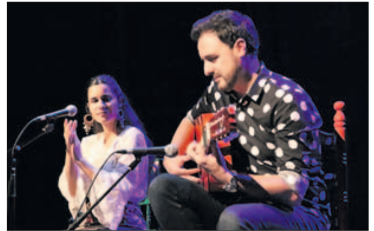
Actuació de la guanyadora del Concurs de Cante de l'any passat.