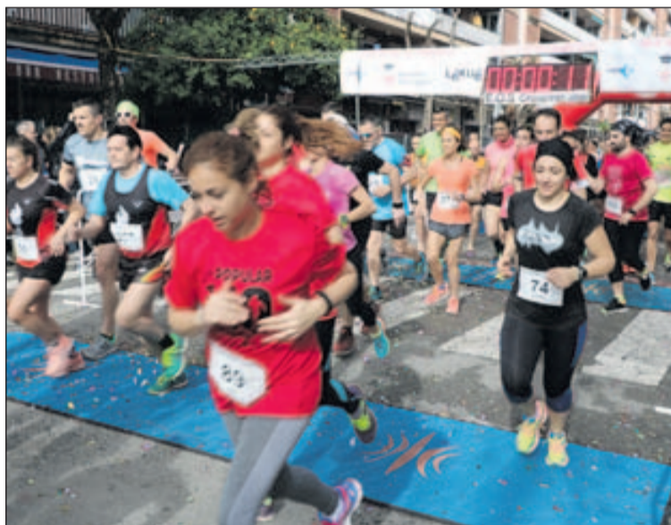
Sortida de la Cursa de l'any passat.

La prova començarà a les 10 del matí amb sortida des del carrer de l'Estació