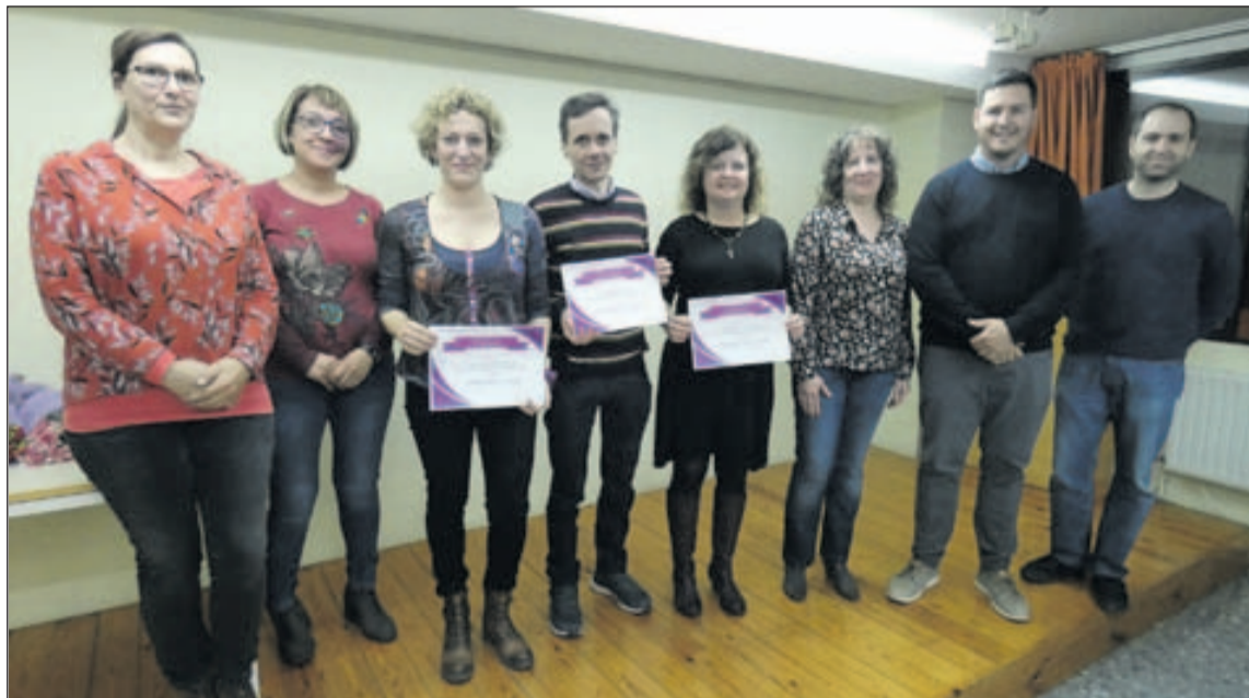
Els premiats del Concurs de microrelats amb els seus diplomes, al centre de la imatge.