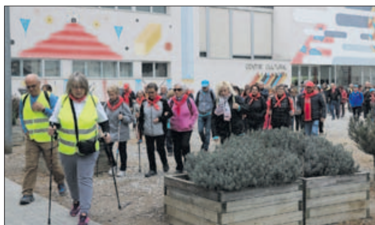
La sortida des del Centre Cultural de la passejada de la Llagosta.

L'activitat va començar amb una acollida al Centre Cultural, on els participants van ser rebuts per l'alcalde, Óscar Sierra, i van poder esmorzar abans de caminar. Al voltant de les 10 h, va començar la passejada. Els excursionistes