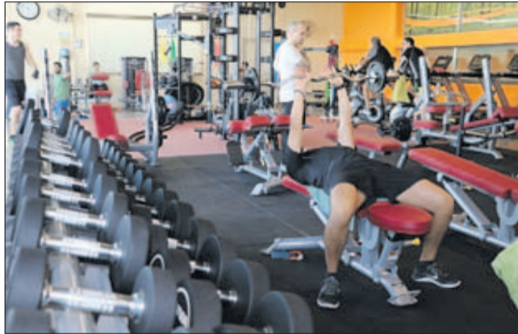
La sala de fitness del CEM El Turó amb la nova maquinària.

El 7 de març, es va posar en marxa la nova sala de fitness reformada del Complex Esportiu Municipal El Turó. Entre les noves màquines, que han suposat la modernització de tots els elements de la sala, destaquen sis cintes de córrer, quatre el·líptiques, quatre bicicletes per a diferents exercicis, diversos bancs, més de 40 manuelles de diversos pesos, una zona de paviment nou i tots els elements necessaris per exercitar diferents parts del cos.