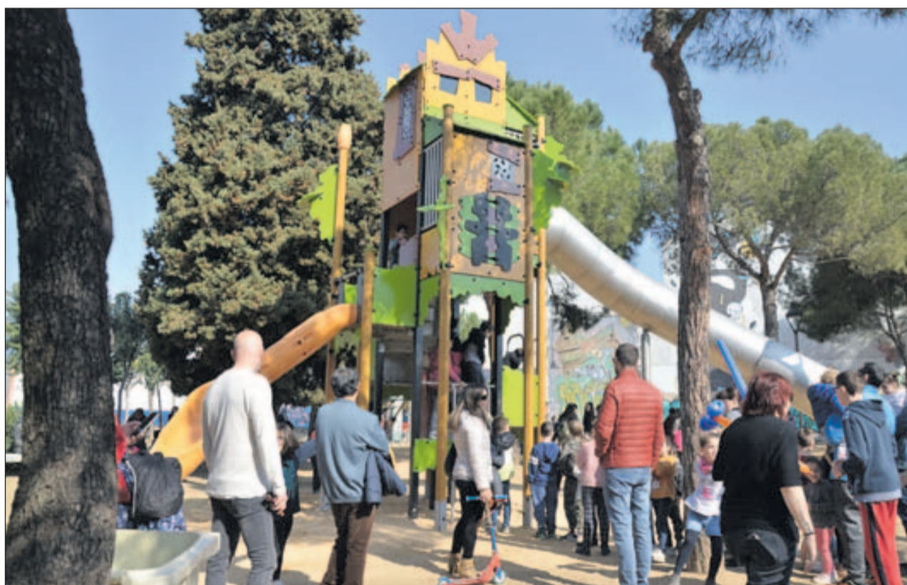
Un dels nous jocs del Parc Popular.

Licitació de la primera reforma de Can Baqué | 5