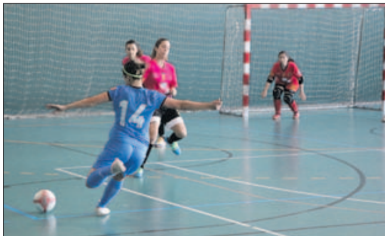
Un xut de Villa que va acabar en gol contra el San Vicente.

El nou líder amb 53 punts és l'Eixample, l'únic dels tres primers classificats que va guanyar la jornada passada. La Concòrdia ocupa la segona posició amb 52 punts, mentre que el Xaloc d'Alacant és tercer amb 50. Dissabte, a partir