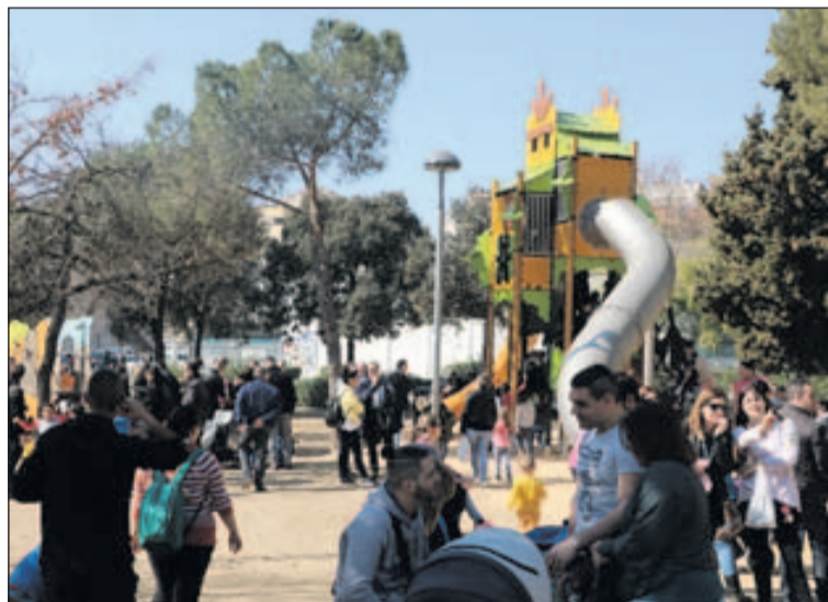
Moltes persones van assistir a l'estrena dels jocs del Parc Popular.

El Parc Popular té ara una gran estructura de jocs i una tirolina. També s'ha reformat la zona per als infants més petits. Durant tot el cap de setmana, van ser moltes les