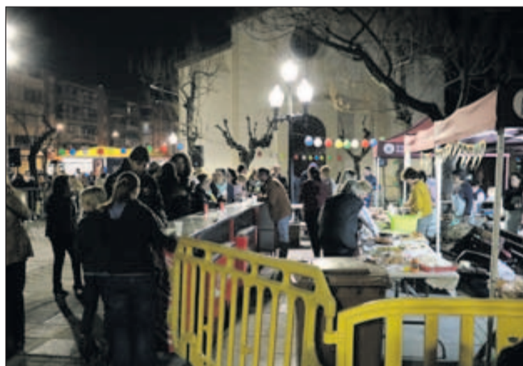
Algunes de les imatges que va deixar la celebració de Sant Josep.