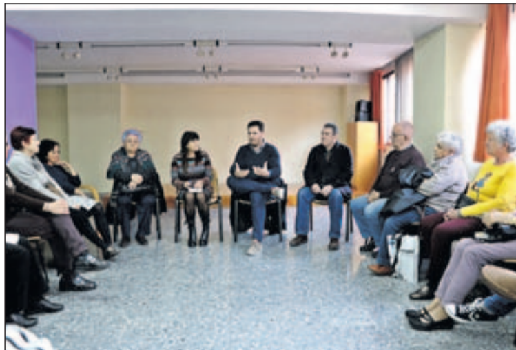
L'alcalde parla amb els participants a la tertúlia del 27 de febrer.

A la trobada, alguna de les assistents va demanar canvis en la ruta de la neteja viària per evitar que la camioneta escombradora passi sempre a la mateixa hora del matí pel ma-