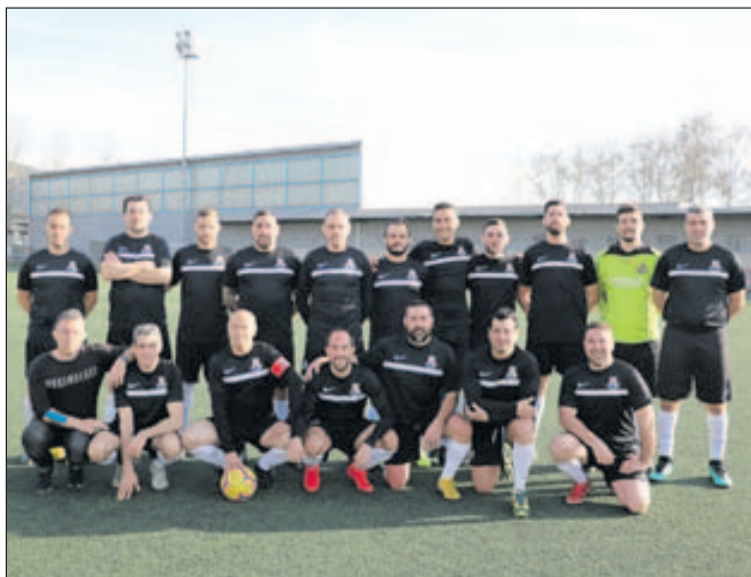
Club Deportivo Viejas Glorias.

El proper cap de setmana, el Viejas Glorias es desplaçarà al camp del Lares Legends, que