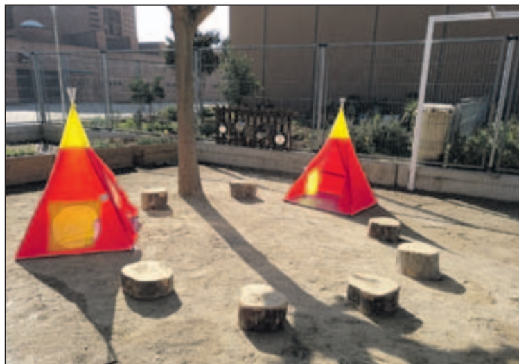
Un dels espais de jocs de l'Escola Bressol Municipal Cucutras.

El pati no està delimitat, tots els infants poden gaudir de tot el pati sense tanques. A l'estiu, hi haurà jocs d'aigua. Es dis-