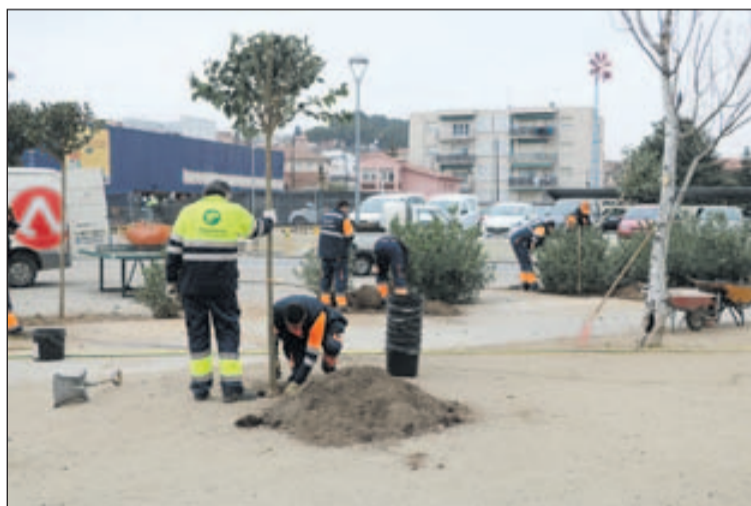
Plantada d'arbres nous a la plaça de Concepción Arenal.

Bona part d'aquests arbres, una trentena, s'han plantat al carrer de l'Estació i a les places de Concepción Arenal i d'Anne Frank. En aquest cas, es van treure pollancrees que estaven en mal estat i altres que causaven problemes d'al·lèrgia. Els tipus d'arbres que s'ha escollit són el roure americà i la troana.