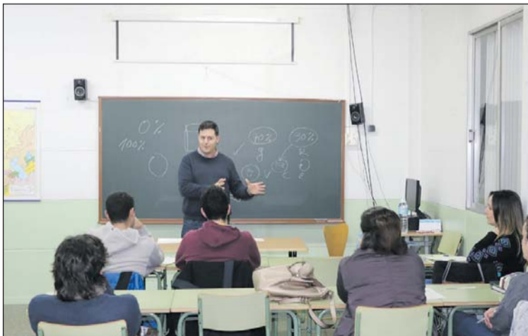
L'alcalde, al Centre de Formació d'Adults, durant la tertúlia.

Una bona part de la conversa es va centrar en el medi ambient i, especialment, en el reciclatge de residus. Aquest és un tema central aquest curs al Centre de Formació d'Adults.