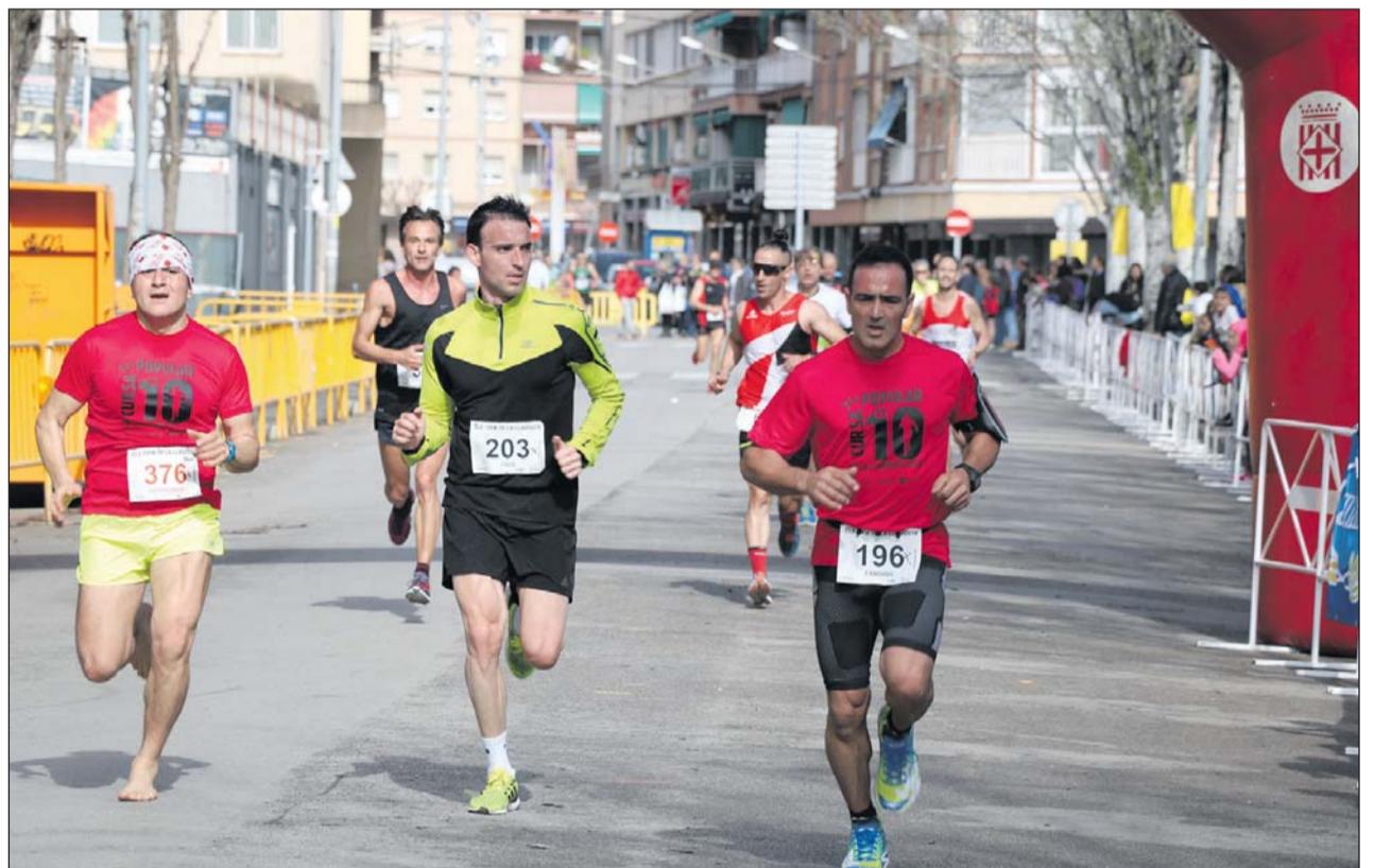
Un moment de la Cursa Popular de l'any passat.

Adjudicada l'obra de la nova parada d'autobús | 4