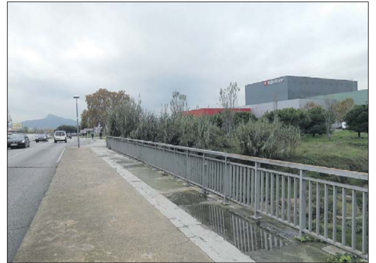
Lloc en el qual s'ubicarà la nova parada d'autobús.

La Junta de Govern Local de l'Ajuntament de la Llagosta va aprovar la setmana passada el contracte per habilitar una nova parada d'autobús al pont situat sobre la riera Seca. En concret, el Consistori ha adjudicat aquesta actuació a l'empresa Coynsa 2000 per un preu de 33.940,74 euros. Les obres, que començaran en breu, tenen un període d'execució de sis setmanes. Està previst reduir part de la vorera i modificar la barana del pont per facilitar la posada en marxa de la parada, d'acord amb les exigències del Servei Territorial de Carreteres de la Generalitat. Precisament, l'Ajuntament ha contractat l'obra poc després de rebre el darrer informe del Departament de Carreteres