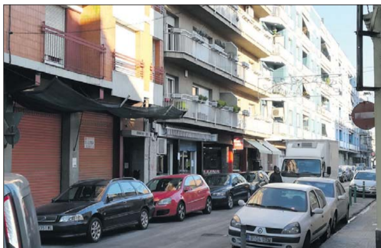
El carrer de Sant Josep.

El Consistori invertirà en aquesta actuació més de 20.700 euros. Una part de l'operació anirà a càrrec de l'empresa Doica Gestió i l'altra, d'ope-