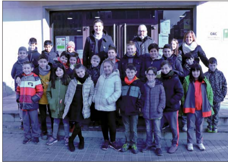
Alumnes de quarta de Primària de l'Escola Sagrada Família.

El dia 21 de gener, va començar una nova edició del cicle de visites a l'Ajuntament dels alumnes de quart de Primària de les escoles de la Llagosta. Els primers a participar en aquesta experiència aquest curs van ser els estudiants de l'Escola Sagrada Família. El dia 12 de febrer, serà el torn de l'alumnat de la Gilpe, mentre que, l'11 de març, visitaran l'Ajuntament els estudiants del Col·legi Joan Maragall. El cicle de visites finalitzarà el dia 1 d'abril amb l'Escola les Planes.