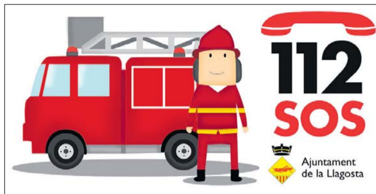
Imatge de la campanya.

En el cas que el foc sigui a casa vostra i no pugueu sortir, heu d'anar a un lloc des del qual us puguin veure des de l'exterior, tancant totes les portes que travesseu. S'ha de posar roba mullada a les esclotxes de les portes per evitar el pas de fum.