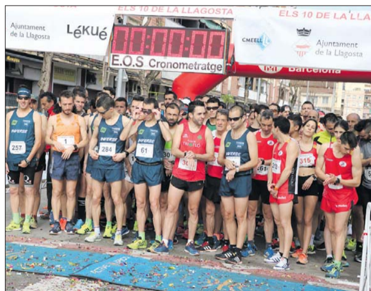
Sortida de la Cursa de l'any passat.

Les inscripcions es podran fer a partir de l'1 de febrer a la pàgina web de la Cursa Popular de Els 10 de la Llagosta ( www.els10delallagosta.com ). De l'1 al 28 de febrer, el preu serà de 13 euros per a la cursa de deu quilòmetres i de 10 per a la cinc. De l'1 al 31 de març, s'haurà de pagar un euro més,