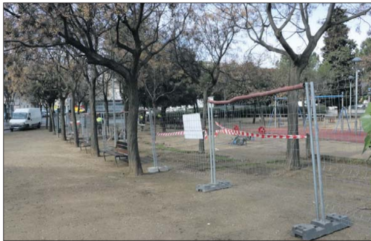
Obres als espais de jocs infantils del Parc Popular.

La setmana passada van començar els treballs per renovar diversos espais de jocs infantils de la Llagosta. Operaris de l'empresa HPC Ibérica, S.A., contractada per l'Ajuntament, han retirat ja elements dels parcs ubicats al Parc Popular per procedir posteriorment a la reforma i a la instal·lació dels nous jocs.