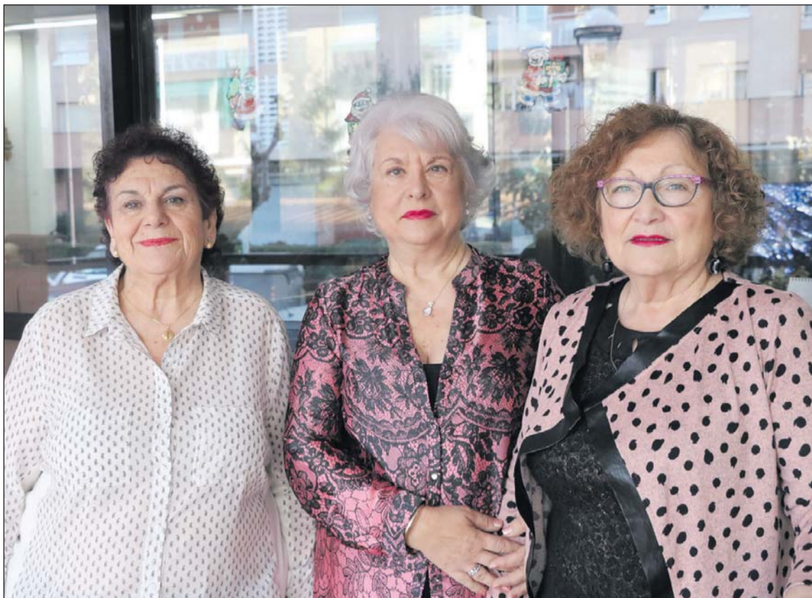
AGRUPACIÓ DE PENSIONISTES I JUBILATS