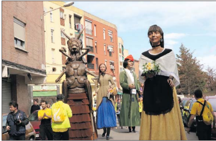
Els gegants de la Llagosta.

La Colla Gegantera de la Llagosta ha fet públic el calendari d'activitats i trobades d'aquest any. El 20 de gener, l'entitat va estar present a la Trobada Gegantera de Gualba en el primer acte previst per al 2019. El 10 de març, participarà en la Trobada Gegantera de Santa Perpètua. El 24 de març, serà el torn de la Trobada Gegantera de la Llagosta, que arriba a la seva desena edició, coincidint amb les festes de Sant Josep.