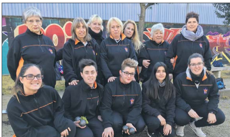
Equip femení del Club Petanca la Llagosta.

L'equip femení llagostenc va celebrar l'ascens a finals de desembre després d'imposar-se a la pista del segon classificat, el Parets, per 4 a 5. "Va tenir més èpica guanyar allà. Vam ser campiones contra les segones quan encara faltaven per jugar quatre jornades. Després vam anar a la Llagosta per celebrar el títol