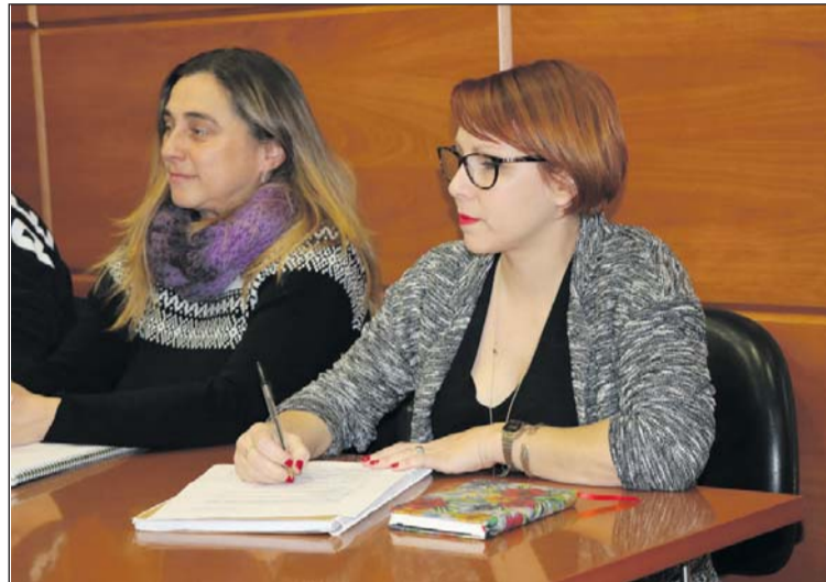
Les dues regidores d'EUiA a l'Ajuntament llagostenc.

"Aquest fet ha provocat un gran esgotament en les persones que formem part d'EUiA i que ens hem mantingut treballant i apostant fermament per construir espais de treball conjunt i que s'obrisin a la participació d'altres organitzacions i persones, especialment en el si del grup municipal", s'explica en un altre apartat del comunicat. "Malgrat tot l'esforç, no ens sentim identificades amb el