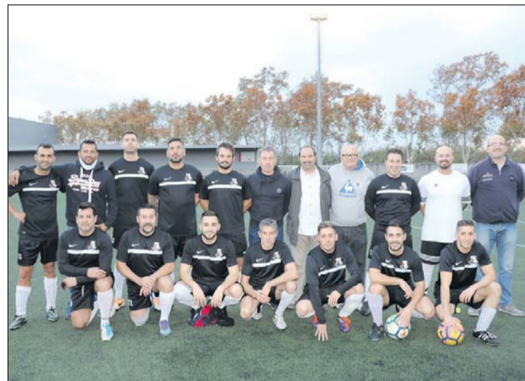
Plantilla del Club Deportivo Viejas Glorias.