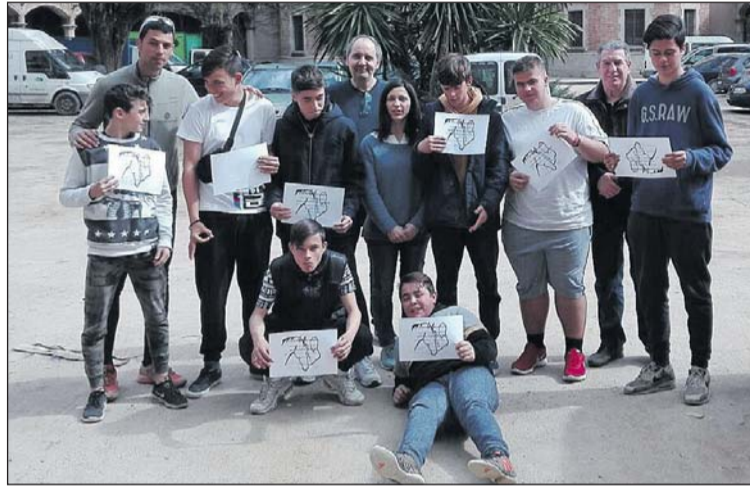
Alguns dels alumnes de la Llagosta.

Pel que fa als alumnes que estudien íntegrament a l'Escola Barcanova, s'ofereix l'ESO i, per als que han abandonat els