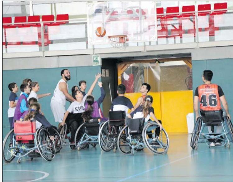
Una de les jornades d'inclusió esportiva celebrades a la Llagosta.

El Complex Esportiu Municipal El Turó serà la seu el dia 26 de maig a les 11 hores de la final de la Lliga Catalana de bàsquet en cadira de rodes, que disputaran els equips Global Basket i el Joventut de Badalona. Després d'aquest enfrontament, a les 12.30 hores, els infants presents podran participar en uns jocs de bàsquet inclusiu amb jugadors dels equips Global Basket i Basketball Team Building Values, que, a les 13 hores, disputaran un partit inclusiu.