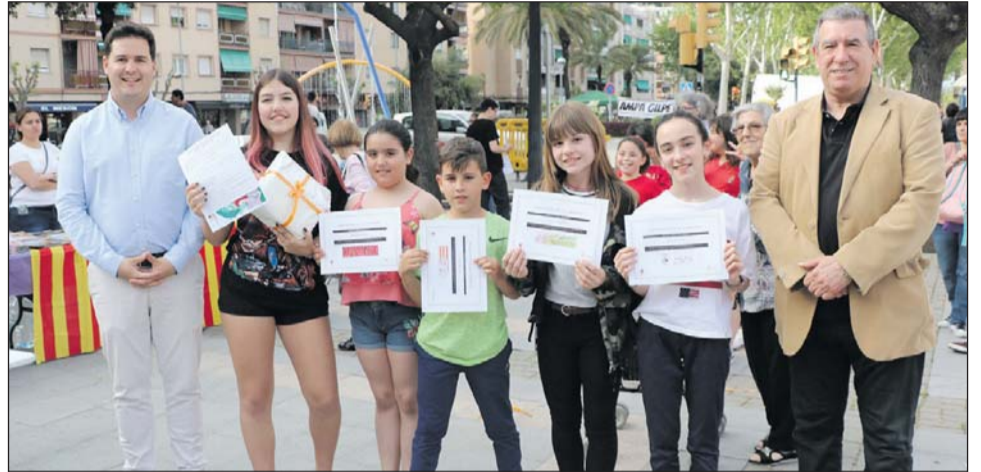
Els premiats al Concurs de punts de llibre.

La Llagosta va gaudir el 23 d'abril d'una gran jornada de Sant Jordi. Diverses entitats van sortir al carrer per vendre llibres i roses. La plaça d'Antoni Baqué va ser el centre de la celebració. A la tarda, la Biblioteca de la Llagosta i el col·lectiu Resistència Literària van lliurar els premis als guanyadors del primer Concurs de microrelats i poesia de Sant Jordi a la Llagosta, que ha comptat amb 24 textos presentats.