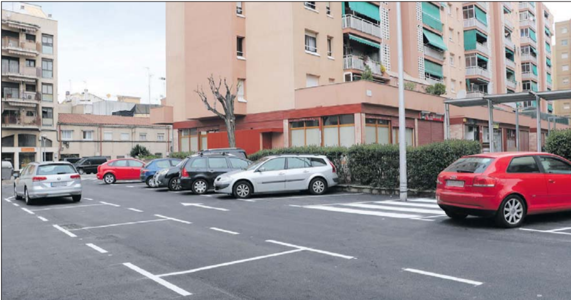
Una imatge de l'aparcament del final de la plaça de Pere IV, que ha estat asfaltat recentment.

L'aparcament situat al final de la plaça de Pere IV va ser reobert el 12 d'abril completament asfaltat. Al matí, van acabar els treballs de condicionament del terreny, en el qual hi ha una quarantena de places d'estacionament, una d'elles per a cotxes adaptats per a persones amb discapacitat i algunes per a motocicletes. Les obres van començar el 26 de març. Els treballs van con-