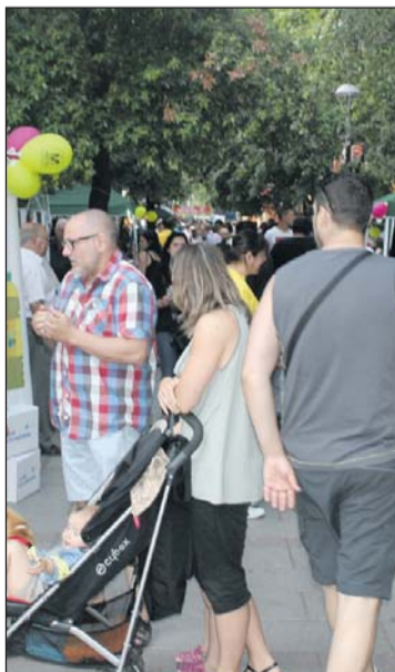
La 3a Mostra d'Entitats.

la seva trajectòria professional al Departament de Cultura de la Generalitat de Catalunya. Actualment, està vinculat amb projectes de l'àmbit de la cultura popular i la gestió associativa. Forma part del consell editorial de la revista Tornaveu . Associacionisme i Cultura i de la Comissió de Seguiment del Protocol del Seguici Popular de Barcelona. També col·labora com a articulista en la divulgació de continguts de temàtica associativa. La Mostra d'Entitats i el Mercat d'Idees són organitzats per l'Ajuntament. - J.C.