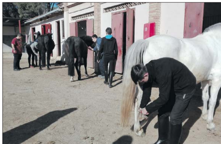
Estudiants del GSIS, a la zona de la hípica.

estudis, el Programa de Qualificació Inicial (PCI) en cuina o hípica. Dels nou alumnes llagostencs que estudien íntegrament al centre perpetuenc, hi ha dos que cursen l'ESO i la resta fan estudis de cuina o hípica. "Som un centre d'educació, de segona oportunitat, perquè rebem els nanos que tenen un tipus de discapacitat o disfunció intel·lectual que no els permet estar en centres ordinaris" , explica Ferré, que remarca els 26 anys en funcionament del centre: "som una referència al Vallès" .