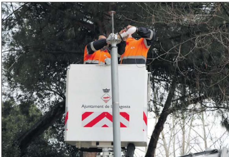
Dos treballadors de la Brigada d'Obres, un d'ells d'un pla d'ocupació.

L'Ajuntament de la Llagosta contractarà quatre persones, que es destinaran a la Brigada Municipal d'Obres, en el marc d'un nou pla d'ocupació dins del Programa complementari de foment de l'ocupació local 2017-2018. Aquesta iniciativa està finançada per la Diputació de Barcelona. Els quatre contractes seran temporals, de jornada completa i amb una durada de sis mesos.