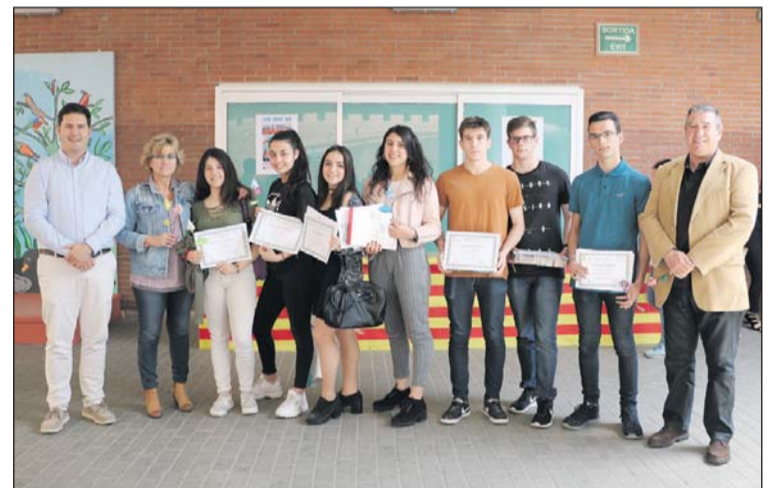
Els guanyadors dels Premis de Recerca de l'Institut Marina.

L'Institut Marina i l'Ajuntament van lliurar els premis als millors treballs de recerca