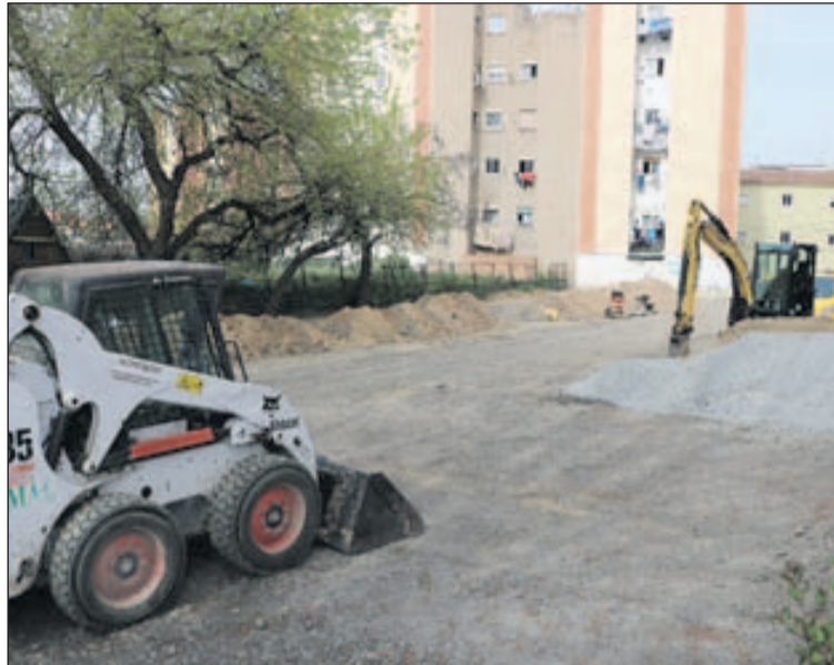
Les obres de condicionament del pàrquing.

L'Ajuntament ha adjudicat aquesta actuació a l'empresa Construccions Deumal per un import total de 34.806,35 euros. Les obres van començar el 26 de març i estaran acabades aviat. La millora de la qualitat del paviment suposa un gran benefici per als usuaris. D'altra banda, Construccions Deumal també s'encarregarà