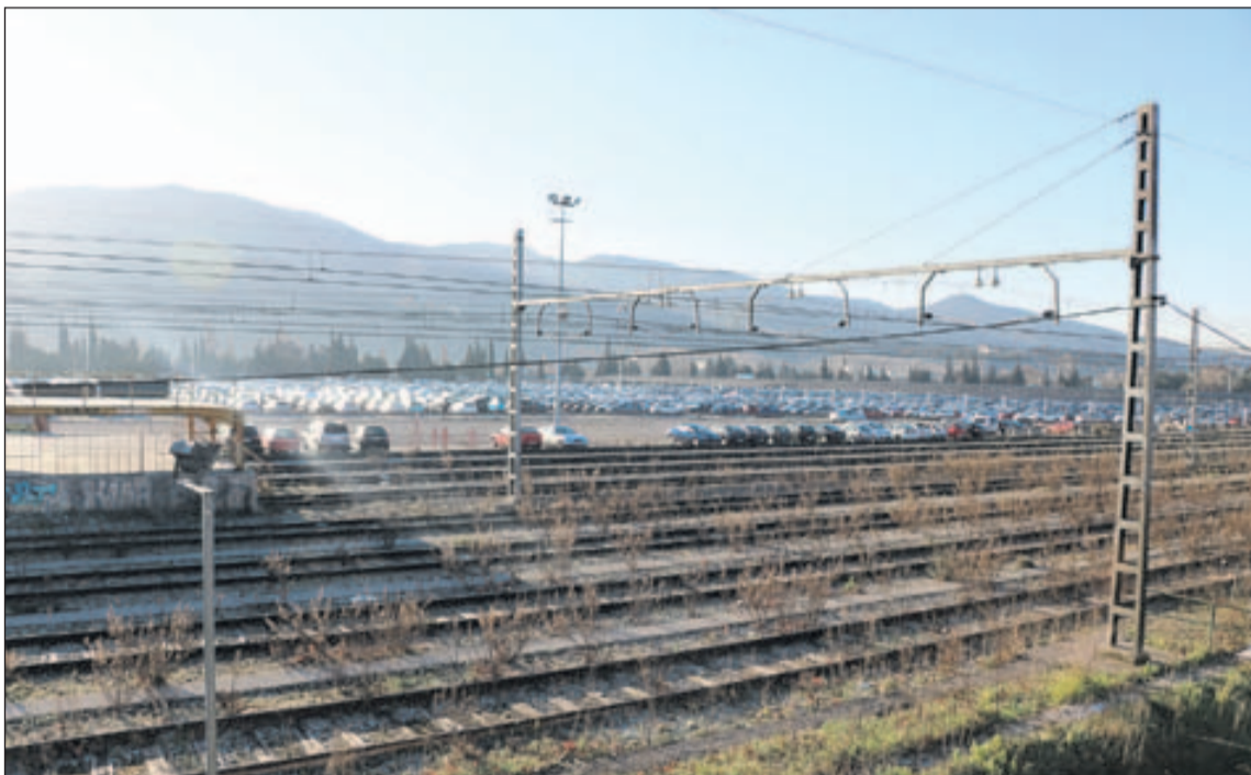
Estació intermodal de la Llagosta.

El contracte contempla la redacció del projecte funcional, que definirà l'encaix del conjunt de les solucions de connexió amb el Corredor del Medi-