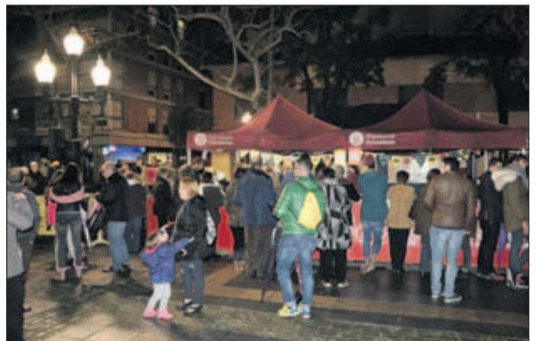
Un moment de la Revetlla de Sant Josep.

desenvolupar al Parc Popular. Al matí, es va celebrar una nova sortida del cicle Un tomb per la història de la Llagosta. Passejades Mateu Bartalot. Durant l'excursió, es van visitar els recursos fluvials del nostre entorn. Unes 70 perso-