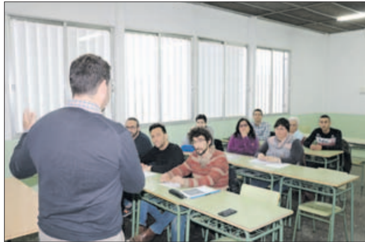
L'alcalde parla amb alumnes de l'Escola d'Adults de la Llagosta.

L'alumnat també es va mostrar preocupat per la contaminació de les indústries. Óscar Sierra va remarcar que el principal problema que hi ha en aquesta zona és la contaminació provocada pel trànsit de vehicles, però va afegir que hi ha controls sobre la contaminació de les empreses i sobre els abocaments de residus. També es va parlar de la regeneració de la flora i la fauna