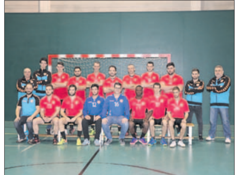
Sènior masculí del Joventut Handbol la Llagosta.

El sènior masculí del Joventut Handbol la Llagosta, setè classificat al grup B de la Tercera Catalana amb 23 punts, s'enfrontarà aquest cap de setmana a la Salle de Montcada B, que és vuitè amb 22 punts. El conjunt llagostenc va caure la darrera jornada a la pista del líder, l'Esplais, per un clar 34 a 22.