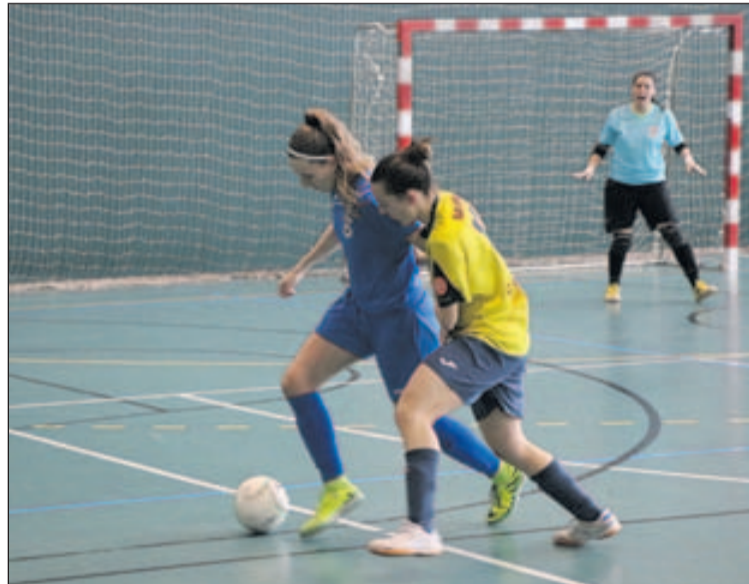
Alba controla una pilota davant d'una jugadora del Palau.

En el darrer partit disputat a casa, la Concòrdia va guanyar el Palau per 3 a 1. Les de