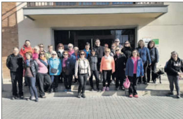
Els participants a la passejada de Veus de Dona.