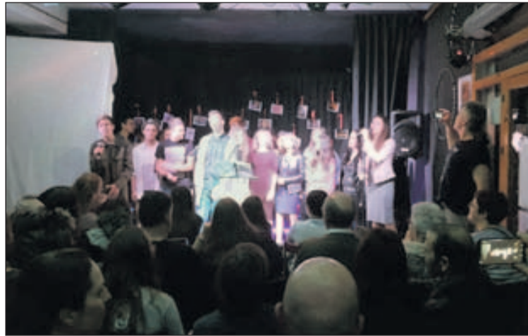
Imatge de l'espectacle del desè aniversari facilitada per TELL.

El grup de teatre TELL ha celebrat el seu desè aniversari. La companyia s'ha transformat en aquests deu anys en un grup format per professionals de l'art dramàtic que manté les seves arrels al nostre municipi. Una quarantena d'actors i actrius han pujat a l'escenari en alguna ocasió amb TELL. La festa d'aniversari es va celebrar el dissabte 3 de març a la Carpa, espai cultural. L'acte va incloure un vídeo commemoratiu dels deu anys de TELL, l'actuació d'alguns membres del grup i el concert que va realitzar un nombrós grup d'alumnes que han passat per l'escola de teatre de TELL.