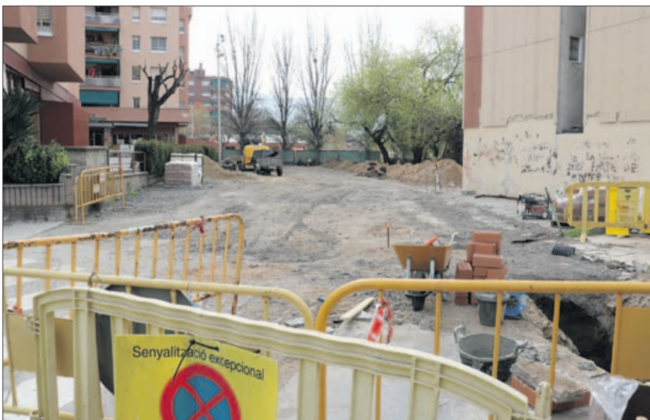
Les obres del pàrquing situat al final de la plaça de Pere IV en una imatge del dia 3 d'abril.

El Ple reclama a la Generalitat els diners de la guarderia | 9