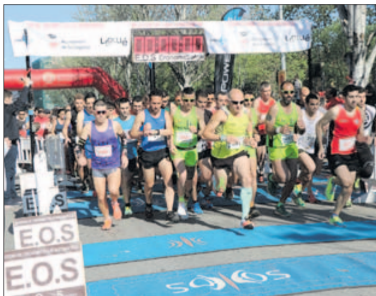
Sortida de la Cursa de l'any passat.

Carles Castillejo donarà una xerrada el dia 14 a la Sala de plens de l'Ajuntament