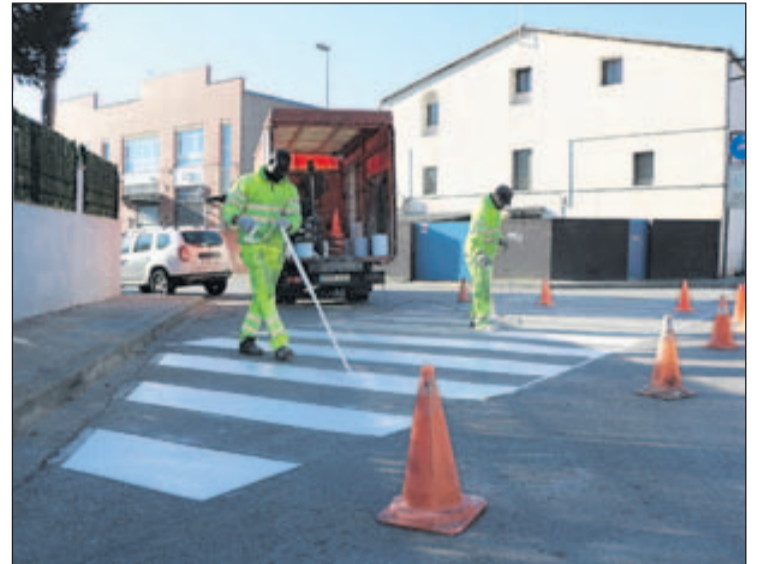
Uns treballadors repinten un pas de vianants a la Llagosta.

L'Ajuntament de la Llagosta ha portat a terme tot un seguit d'actuacions a la via pública per millorar la senyalització viària. El Consistori ha repintat alguns passos de vianants, ha creat noves places per a motocicletes i ha millorat la senyalització horitzontal en algun carrer. Els passos de vianants que han estat repintats estan situats als carrers de Vic, de Barcelona, de Girona i de l'Estació (a l'alçada de l'Ajuntament). Al Polígon