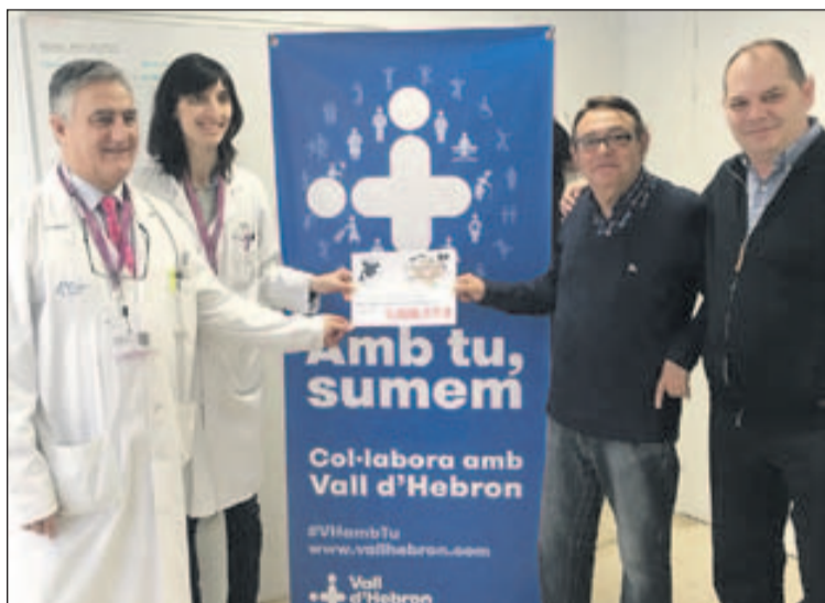
Moment del lliurament del xec.

La Murga va lliurar el 9 de març a l'Institut de Recerca de l'Hospital de la Vall d'Hebron un xec de 1.308,17 euros, que són els diners que es van recollir durant la campanya Junts per l'ELA que es va portar a terme a la Llagosta els dies 21 i 22 d'octubre del 2017. La donació anirà destinada concretament a la Unitat neuromuscular d'aquest centre hospitalari. La Murga, La Llagosta + Activa, El Pícaro Teatro i alguns comerços de la nostra localitat van portar a terme tot un seguit de propostes solidàries els dies 21 i 22 d'octubre durant les quals es van recollir les donacions aportades per la ciutadania per a l'Hospital de la Vall d'Hebron.