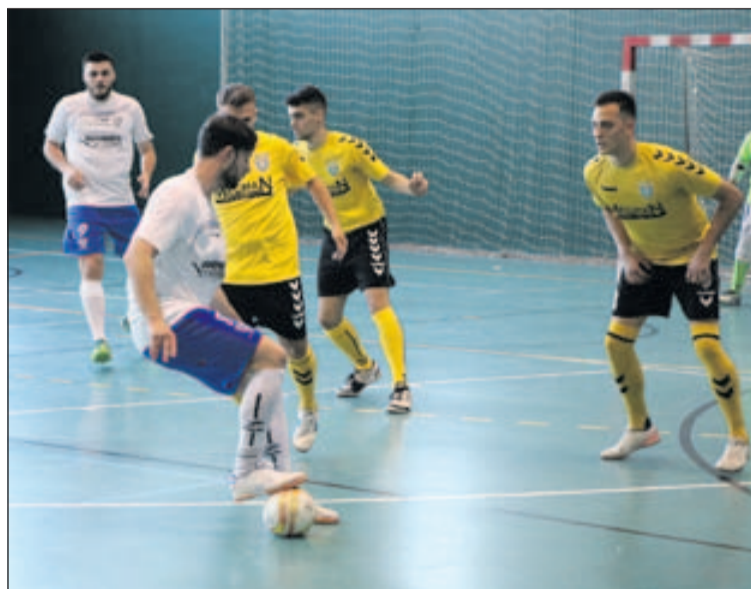
Una acció del partit contra el Ciutat de Granollers.