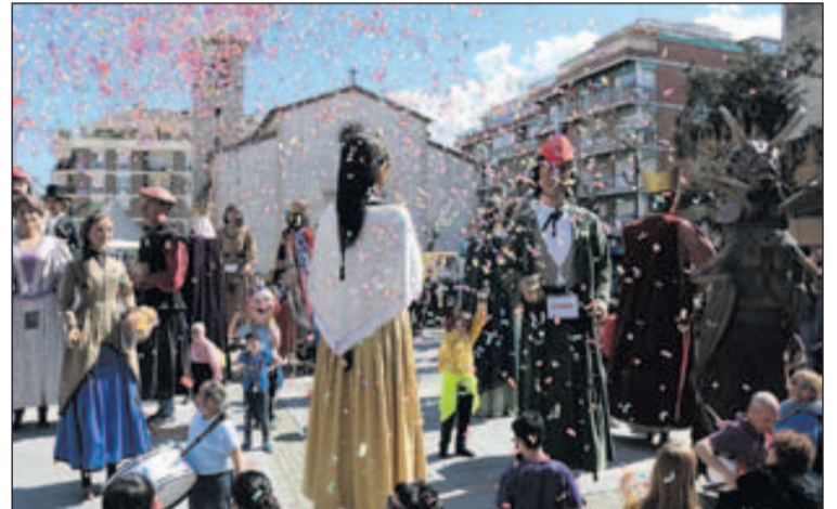
Alguns dels gegants que van participar a la Trobada de la Llagosta.

El 19 de març, els infants de la Llagosta van poder gaudir del taller de circ que es va instal·lar al passeig de l'avinguda de l'Onze de Setembre, de les atraccions infantils i dels inflables del solar del costat de l'església i del circuit de karts de la plaça d'Antoni Baqué. Les activitats van estar funcionant fins que la pluja va fer acte de presència a la Llagosta, al voltant de les 18 h. A la tarda, també va tenir lloc la Jornada d'atletisme escolar organitzada per l'Ajuntament de la Llagosta amb la col·laboració del Consell Municipal de l'Esport Escolar i el Lleure i el Club Esportiu Fondistes de la Llagosta. Uns 160 infants de Primària van participar a les curses de fons i de velocitat que es van de-