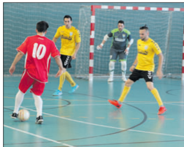
Una acció del partit contra la Garriga.

El sènior A del Fútbol Sala Unió Llagostense disputarà dissabte contra el Montsant Sala5 la primera semifinal de la Final Four, de la qual sortirà el campió de la Nacional Catalana, la màxima categoria que organitza la Federació Catalana de Futbol Sala. El partit es jugarà a les 16 hores al Pavelló Municipal de Tiana. A l'altra semifinal s'enfrontaran el Tiana i el Dante. La final es disputarà diumenge a les 19 hores també a Tiana.