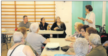
Acto de entrega a Rems del dinero recaudado.

El taller de trabajos manuales del Casal d'Avis ha donado 551 euros a la Associació de Voluntariat Rems procedentes de la venta de artículos artesanales durante la Fira de Sant Ponç. El acto de entrega del dinero se celebró en el gimnasio del Casal d'Avis. La donación servirá para comprar material de higiene personal para familias necesitadas. - J.L.R.B.