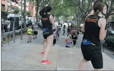
Una de les activitats de la Festa de l'Esport de 2016.

El dia 11,30 h, el Complex Esportiu Municipal El Turó organitzarà una master class de body combat al passeig de l'avinguda de l'Onze de Setembre. A les 12.30 h, en aquest mateix espai donarà