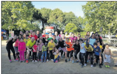
Alguns dels participants al Saltats Crazy Festival.

Els Saltats van organitzar el 6 de maig moltes activitats. Els assistents van poder gaudir d'una sessió de zumba amb Isa, d'animació infantil amb el grup La Panfleta, d'una botifarrada, d'una sessió de kick boxing júnior a càrrec del Tapia Team de Terrassa, que també va fer una activitat per a adults de boxa tailandesa,