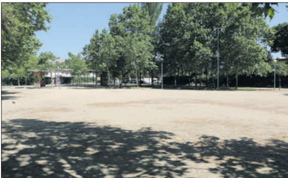
L'Ajuntament instal·larà una pista multiesportiva al Parc Popular.

El tercer ajut de la Diputació, 57.397 euros, servirà per muntar una pista multiesportiva al Parc Popular. "Volem obrir el Parc Popular a Toci dels infants i adolescents amb la pràctica esportiva", ha ex-