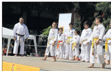
Una de les exhibicions de l'Okinawa Team.