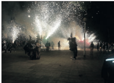
La cremada, a la plaça de la Sardana.

La colla de diables Les Llagostes de l'Avern s'ha mostrat molt satisfeta amb el desenvolupament de la quarta edició de la Trobada de bèsties de foc, que es va celebrar el 13 de maig a la nostra localitat. Figures de sis poblacions van desfilar pel nostre municipi.