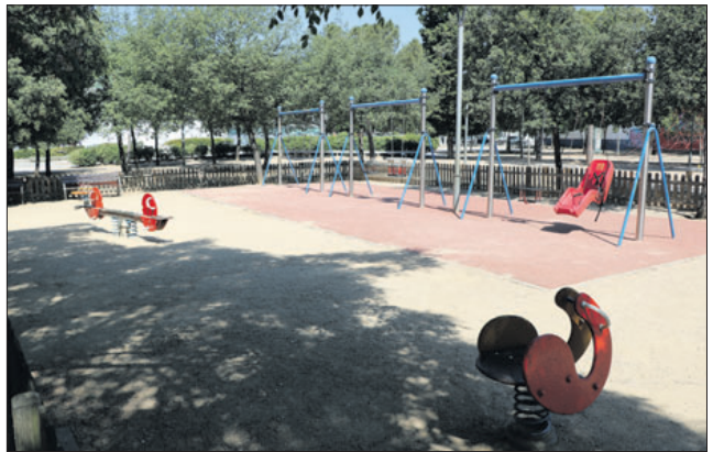
Zona de jocs infantils del Parc Popular.

La Concòrdia jugarà, un any més, a la Segona Nacional | 18