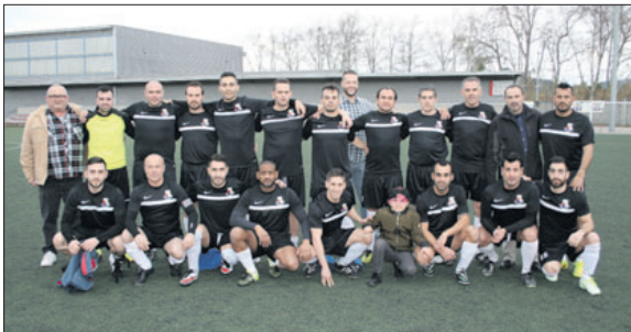
Club Deportivo Viejas Glorias.

El Viejas Glorias, que debutava aquest any a la Cinquena Divisió, ha estat el tercer classificat, per darrere del campió, el Mataronense, i del segon, el Sant Celoni. Els de la nostra localitat, tot i que han tingut molts problemes de lesions durant tot l'any, només han perdut quatre partits en tota la temporada. - J.C.