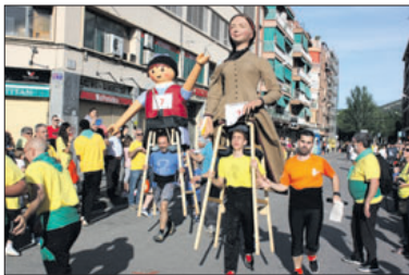
La Mariona, durant una de les curses del dia 20 de maig.

La trobada va començar amb una plantada de les colles participants en el passeig de l'avinguda de l'Onze de Se-