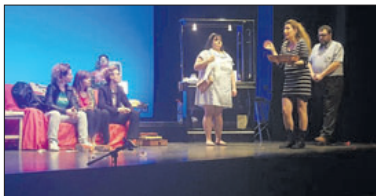
La representació va tenir lloc al Centre Cultural.

El grup Nanocosmos Teatre de la Llagosta va omplir el Centre Cultural els dies 13 i 14 de maig durant la representació de l'obra Hombres al borde de un ataque de mujeres . L'espectacle va ser dirigit per Carme Vilar. Amb la venda d'entrades, Nanocosmos Teatre va recaptar 1.000 euros que es destinaran a l'ONG Som Togo. - J.L.R.B.