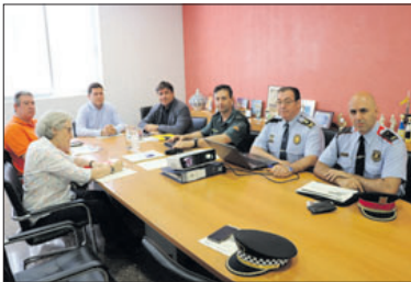
La Junta Local de Seguretat.

El nombre d'infraccions penals ha baixat a la Llagosta un 8% en el darrer any, segons l'informe que van donar a conèixer dilluns els Mossos d'Esquadra durant la celebració de la Junta Local de Seguretat de la nostra població. En concret, entre maig del 2016 i abril d'aquest any, es van comptabilitzar a la Llagosta 527 delictes, 46 menys que en el període anterior. Aquestes infraccions penals van suposar la detenció de 35 persones, un 20,7% més. La majoria d'aquests detinguts han estat homes de més de 36 anys i de nacionalitat espanyola.