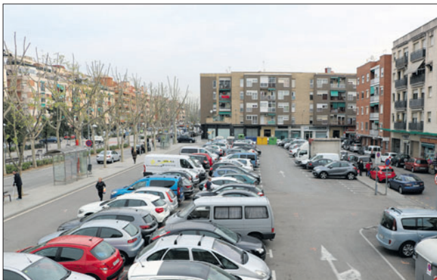
La zona més a prop del carrer de Jaume Balmes acollirà l'ambulatori nou.

Quatre escriptors locals van presentar els seus llibres | 9