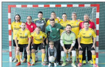
Senior A del Fútbol Sala Unió Llagostense.