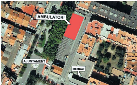
L'ambulatori nou estarà situat al costat del carrer de Jaume Balmes.

Tècnics de la Generalitat, de la Comissió Territorial d'Urbanisme de Barcelona, havien