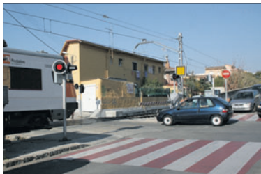
El pas a nivell de la Llagosta.

Adif ha dividit el contracte en nou lots, classificats per àrees geogràfiques. El pas a nivell de la Llagosta forma part del lot 8, on hi ha altres set actuacions