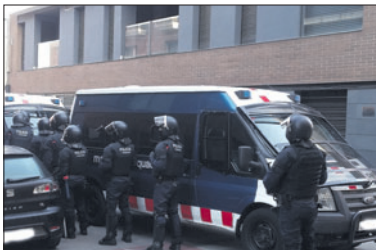
Els Mossos d'Esquadra, abans d'entrar al bloc de pisos.

Els Mossos d'Esquadra van procedir el 10 de març al desallotjament del bloc de pisos del carrer de Sant Francesc de la Llagosta, tal com havia acordat el dia anterior el Jutjat de Primera Instància i Instrucció número 2 de Mollet. Diversos efectius dels Mossos d'Esquadra van entrar a l'edifici i van comprovar que només hi havia un ocupant, que no va oposar cap resistència i que pocs després va marxar de l'immoble amb dues bosses.