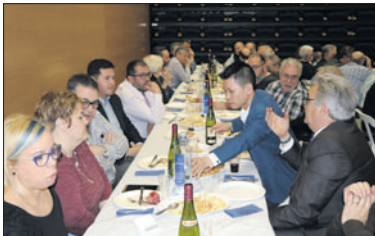
Dinar de celebració del 25è aniversari d'Alborada.

La celebració va incloure un reconeixement a les nou persones que han estat sòcies d'Alborada de manera ininterrompuda durant aquests 25 anys. També es va agrair la col·laboració amb Alborada i altres entitats de la nostra localitat. Les actuacions van anar a càrrec de la Casa de Andalusia de la Llagosta, Cova da Serpe de Barcelona i de la mateixa Agrupación Cultural Galega Alborada. La celebració va finalitzar amb un ball amb música en directe. A l'acte va assistir l'alcalde