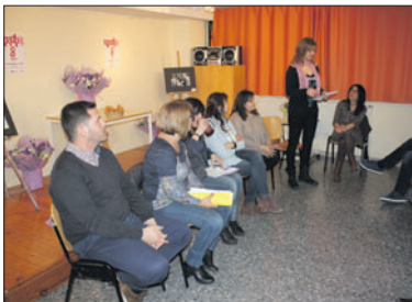
Acte central de la programació del Dia Internacional de les Dones.