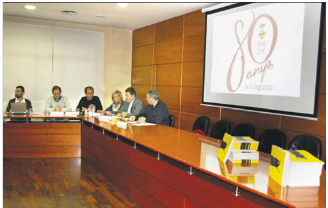
Presentació del llibre Mirades. La Llagosta: passat, present i futur , al Saló de plens de l'Ajuntament.

L'Ajuntament presentarà un recurs per Valentine | 4