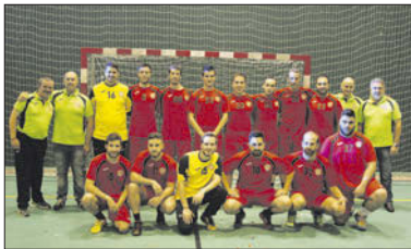
Senior masculí del Joventut Handbol.

Per la seva part, el sènior femení va caure la jornada passada per 22 a 31 contra el Barcelona Sants. Les llagostenques són penúltimes al grup C de