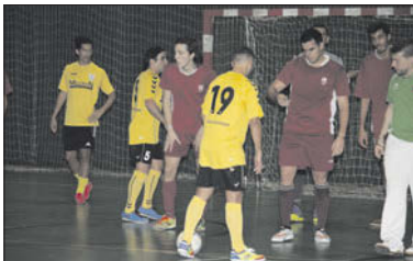
Una acció del partit contra el Padre Damián.