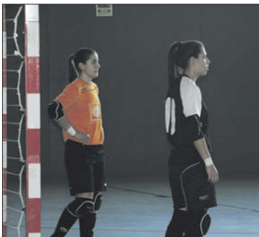
Les dues porteres del CD la Concòrdia.

La Concòrdia ve de guanyar el Faycan (4-0), l'Eixample (2-1) i el Club Natació Caldes (0-2). Abans, havia empatat a casa contra el líder, el Futsal Esportiu Hispaniç, i a la pista