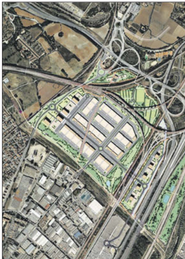
Plànol de la Generalitat amb la proposta d'ordenació del sector.

El Pla director se sotmetrà a informació pública durant 45 dies, perquè els interessats el puguin consultar i presentar-hi alegacions, si ho consideren necessari. Posteriorment, es donarà audiència als ajuntaments afectats durant un termini d'un mes. Les aportacions que es recullen s'estudiaran i s'incorporaran, si s'escau, al document que s'aprovi al final. - 08centvint