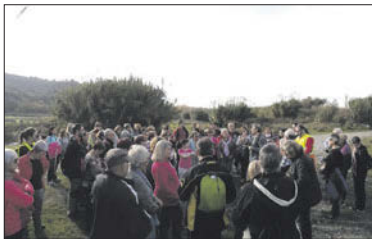
Els participants de la Llagosta, a la riera de Caldes.

Una vegada tornats a Can Pegleri, es va fer la presentació