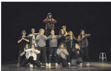
Un dels actes del Dia Internacional dels drets de la infància.