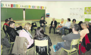
Trobada de l'alcalde al Centre de Formació de Persones Adultes.

L'alcalde també va recordar que està previst reformar la rotonda situada al costat del Pavelló Antonio García Robledo. A més, va explicar que es canviarà el clavegueram de la banda dreta del carrer de