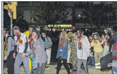
Alguns dels participants a la Z-Infection.

Un total de 695 persones van participar finalment a la nit del 5 al 6 de novembre en l'activitat anomenada Z-Infection, que va organitzar a la Llagosta la colla dels Volats i l'empresa CaçaFantasmes. El joc, que simulava una infecció zombi, va començar a les 22.30 hores amb un acte inicial multitudinari a la plaça d'Antoni Baqué i va acabar a les cinc de la matinada. Els participants es van dividir entre els grups de supervivents i zombis. A més, hi va haver un tercer grup d'actors que va fer de diversos personatges, com científics o militars. Durant tota la nit, es van desenvolupar