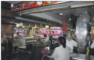
Interior del Mercat Municipal de la Llagosta.

L'eliminació del cànon serà d'aplicació immediata i, per tant, a partir d'ara, qualsevol persona interessada a fer-se càrrec d'una parada del Mercat Municipal no l'haurà de pagar. L'única condició que es demanarà és que l'establiment estigui obert durant un mínim de tres anys. "Volem donar