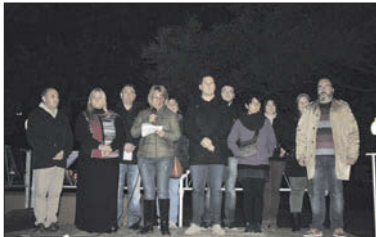
Lectura del manifest institucional del 25 de novembre.

D'altra banda, la Llagosta va celebrar el dia 18 de novembre amb música, ball i teatre el Dia Internacional dels drets de la infància. El Centre Cultural es va omplir amb infants i les seves famílies per commemorar una jornada que s'emmarcava dins de la programació Fem un pacte? Tracta'm Bé! - 08centvint