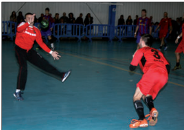
Una jugada d'atac d'un partit del sènior A del Joventut Handbol.