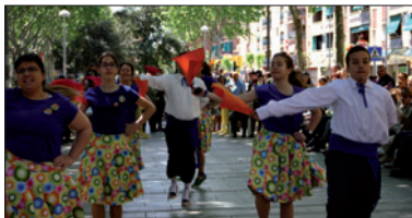
Un moment de la Ballada del dia 24.

El Grup de Ball de Gitanes va organitzar el 24 d'abril la 40a Ballada de gitanes de la Llagosta. Les actuacions, que van durar dues hores, van tenir lloc a l'avinguda de l'Onze de Setembre i van anar a càrrec de tres colles de Santa Perpètua, una de Polinyà, dues de Castellar del Vallès, dues de Cerdanyola del Vallès i la de la Llagosta. La Formació Musical de Cerdanyola va posar la música.