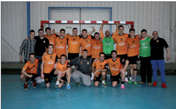
El primer equip del Vallag, després d'aconseguir l'ascens.