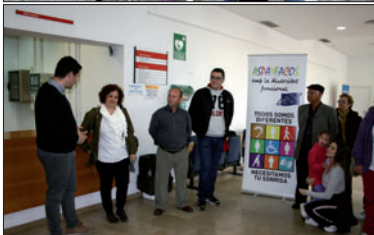
Tres moments de la jornada.

cadira de rodes, dibuixar sense mans, mantenir l'equilibri o fer punteria amb la mà que menys fem servir són algunes de les propostes que van portar a terme les voluntàries d'Aspayfacos i la Fundació Ecom. També es va instal·lar un espai per treballar aspectes sobre l'educació emocional amb la col·laboració de l'entitat EMOTICAT. El matí va estar acompanyat amb música en directe, oberta a la participació de