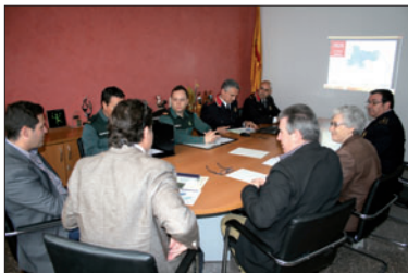
Reunió de la Junta Local de Seguretat.

Entre abril de 2015 i març de 2016, es van detectar 577 infraccions penals a la nostra localitat, mentre que, en el període d'abril de 2014 a març de 2015, s'hi van produir 597. La majoria, 421, són delictes contra el patrimoni; 108 contra les persones; 30 relatius al trànsit i 5 contra l'ordre públic, com a més destacats. La mitjana mensual de delictes en l'últim any ha estat de 48, dos menys per mes que durant l'any anterior. Els delictes contra el patrimoni han baixat un 5,8%. En aquest