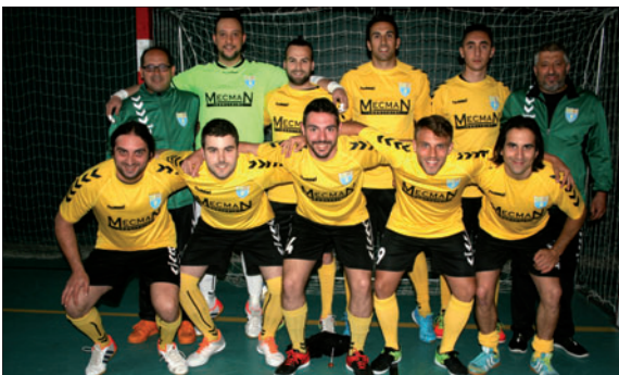
El sènior A del FS Unión Llagostense.

Nou èxit del club Llagostenc, que, per segon any seguit, veu com els seus dos conjunts sèniors han aconseguit l'ascens de categoria. A més, el primer equip ja és campió de lliga, mentre que el segon té també moltes opcions d'acabar en primera posició.