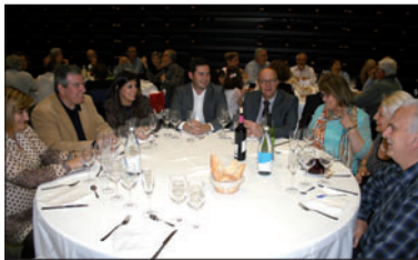
La taula presidencial del sopar del 40è aniversari.

D'altra banda, el 7 de maig se celebrarà la primera preliminar del XXXIII Concurs de Cante Jondo Ciutat de la Llagosta, organitzat per la Casa de Andalucía. Les altres preliminars tindran lloc el 21 i 28 de maig i el 4 de juny. Totes se celebraran al Centre Cultural del carrer de la Florida. La final i el lliurament de premis estan previstos per al 18 de juny al Centre Cultural de la plaça de l'Alcalde Sisó Pons.