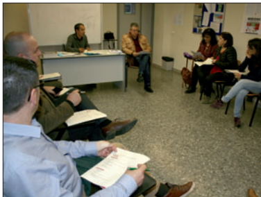
Reunió de la Comissió de la Festa Major del 5 d'abril.

La Comissió es reunirà cada quinze dies per realitzar propostes, incorporar les activitats aportades per les entitats locals, coordinar la programació de Festa Major i vetllar per la seva execució, així com fer una valoració posterior.