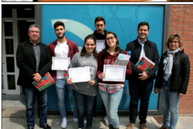
Un dels actes de la Revetlla de Sant Jordi (a la imatge de dalt) i alguns dels autors dels treballs de recerca de l'INS Marina (a baix).

El mateix dia, el Fòrum de Debate Llagostense i l'Agrupació de Jubilats i Pensionistes es van sumar a la commemoració