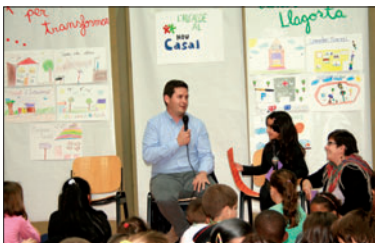
L'alcalde, durant la trobada al Nou Casal.

Els usuaris del Nou Casal van fer altres propostes, com ara la creació d'un menjador social, realitzar una festa infantil dels colors, crear més espais verds, realitzar un mercat d'intercanvi i reformar la masia de Can Baqué. L'alcalde va recordar que la rehabilitació d'aquest edifici suposa un cost que l'Ajuntament