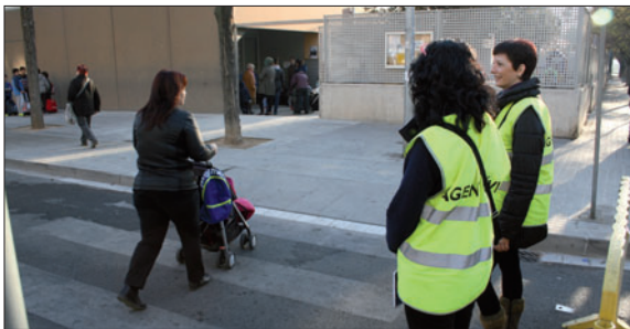
Agents cívics, controlant l'entrada a l'Escola Joan Maragall.

Ara mateix, a l'Ajuntament de la Llagosta hi ha sis persones treballant mitjançant plans d'ocupació, cinc d'elles per una subvenció del Servei d'Ocupació de Catalunya de la Generalitat i una altra pel Consell Comarcal del Vallès Oriental. El Consistori espera també rebre en els propers mesos una subvenció de la Generalitat per tal de contractar més persones. "Una de les nostres prioritats és generar ocupació" , ha recordat l'alcalde de la Llagosta, Óscar Sierra.