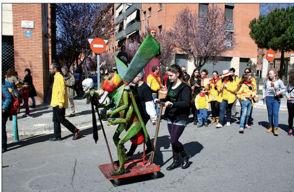
Cercavila de la Trobada Gegantera de l'any passat.

El 13 de març se celebrarà, la setena edició de la Trobada Gegantera de la Llagosta amb la participació d'onze colles. El dia 19, festívetiv de Sant Josep, patró de la Llagosta, tindran lloc a la nostra localitat un bon nombre d'actes adreçats a persones de diverses edats. Les entitats i l'Ajuntament han preparat diferents propostes.