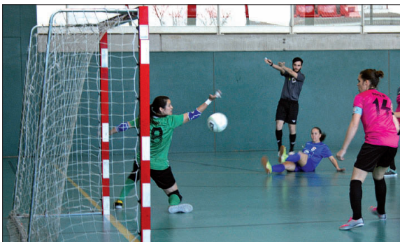
Una imatge del partit entre la Concòrdia i el Joventut Elx.

Les llagostenques, després de gairebé un mes sense competició de lliga, van ser superades per un Joventut Elx més efectiu en atac. Ara, hi haurà jornada de descans i després la Concòrdia anirà a la pista del Vallirana, que és el vuitè classificat.