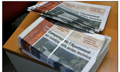
Exemplars del 08CENTVINT.

Amb l'objectiu d'oferir més informació, el 08CENTVINT té ja des d'aquest mes de març vuit pàgines més. D'aquesta manera, s'intenta donar cobertura a la major nombre possible d'activitats organitzades per les entitats. A més, es disposa de més espai per donar a conèixer a la població les notícies generades per l'Ajuntament. Aquest increment en el nombre de pàgines és un primer pas per tal de millorar el 08CENTVINT, que és una de les eines que té el Consistori per informar a la ciutadania.