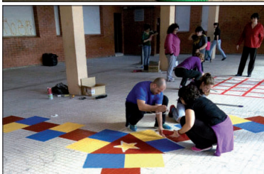
Treballs de preparació de jocs al pati

els espais. El 13 de febrer, es va fer una jornada de treball i pares, mares i mestres van deixar enllestit el pati.