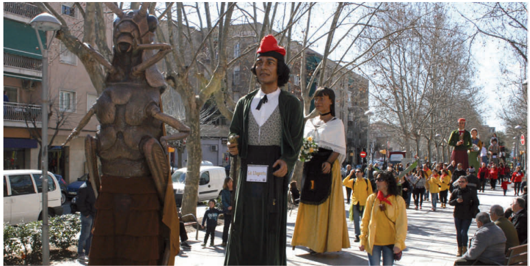
Una imatge de la Trobada Gegantera de la Llagosta de l'any passat.