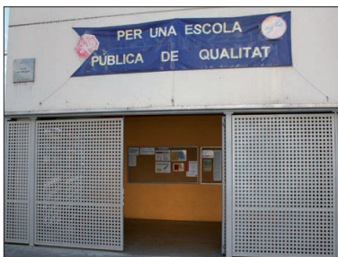
Façana de l'Escola Joan Maragall.

Finalment, es va arribar a l'acord de mantenir sis de les set línies actuals. "Així garantim un ensenyament públic de qualitat a la Llagosta amb unes ràtios entorn als 20 alumnes per aula i no de 25, com hauria provocat la proposta de la Generalitat", segons ha explicat l'alcalde de