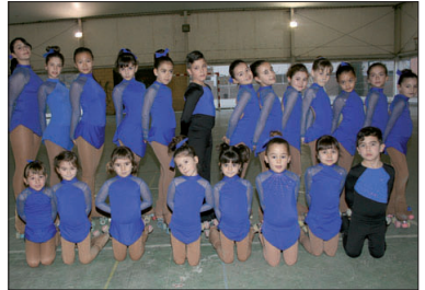
Una part dels esportistes del Club Patí la Llagosta.