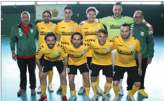
Primer equip del Fútbol Sala Unión Llagostense.