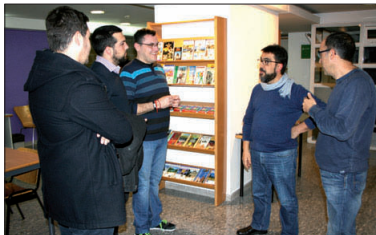
Un moment de l'acte de presentació del SIJ.

El Servei d'Informació Juvenil (SIJ) va reobrir les seves portes el 12 de febrer. El SIJ, adreçat a joves de 12 a 29 anys, està ubicat a la planta baixa del Centre Cultural i Juvenil Can Pelegrí. El dia 12, es va fer una presentació del servei. L'objectiu de l'equip de govern és "recuperar un espai adreçat als joves i que sigui obert", segons va explicar el regidor de Joventut, Fran Ruiz. L'horari del SIJ és de dilluns a dijous a la tarda, de cinc a vuit, i dimecres també al matí, de deu a una del migdia. - JOSÉ LUIS RODRÍGUEZ