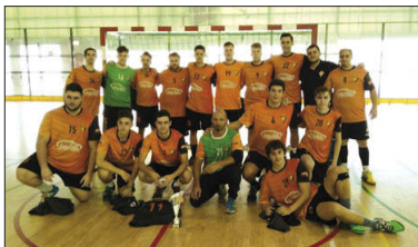
El sènior de l'HC Vallag, durant la pretemporada.

L'equip taronja està dirigit per Pedro Iglesias i se acceptarà a finals del curs passat el repte del retorn del sènior masculí després d'una temporada sense activitat. El nou primer equip del Vallag compta amb una