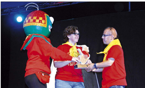
Lliurament del premi de l'Engreskada 2015 als caps de la colla dels Volats, l'última nit de la Festa Major.

La pluja va deslluir algunes propostes com la ballada de