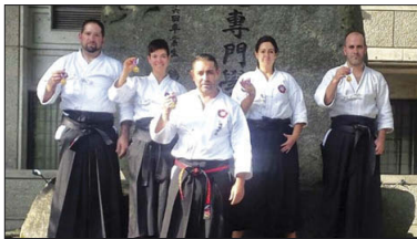
Els llagostencs, a la porta del Butokuden amb la medalla.

Durant l'estada al Japó, concretament a la ciutat de Kyoto, l'expedició llagostenca es va formar a l'emblemàtica sala de les virtuts marçials, el Butokuden, on els membres de l'Okinawa Team van estudiar quatre arts japoneses: Okinawa