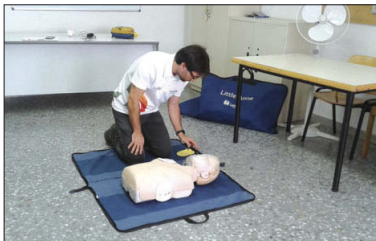
Sessió pràctica del curs sobre l'ús dels desfibril·ladors a Can Pelegrí.

Els nous desfibril·ladors seran accessibles a la ciutadania. Hi haurà un a la plaça d'Antoni Baqué, prop de l'edifici de