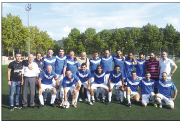
L'equip, el dia del partit contra el Joan XXIII.

L'inici de lliga va ser contra l'Atlètic Polinya (5-2). La segona jornada es va guanyar a domicili el Montflorit (2-7). I en la tercera es va certificar el bon moment amb una altra golejada davant del Joan XXIII (6-1). "Hi ha molt bon am-