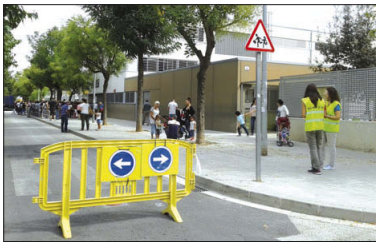
Les agents cíviques, a les portes de l'escola Joan Maragall.