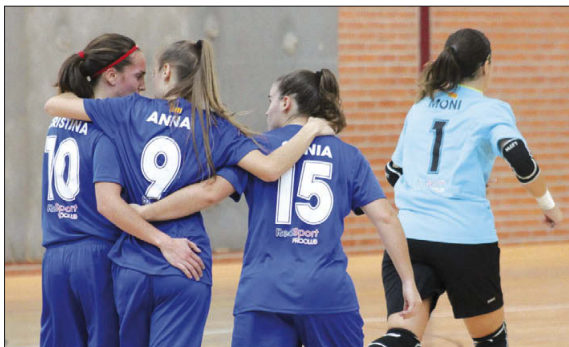
Les jugadores de l'equip llagostenc, en el seu debut de lliga a la pista del Castelldefels.