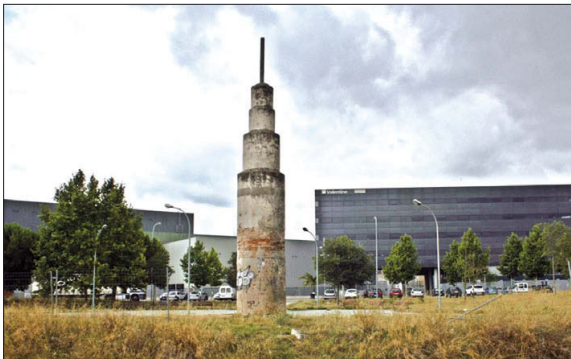
Una part dels terrenys de Can Milans, amb la factoria de l'empresa Valentine al fons.

El Ple de l'Ajuntament ha aprovat per unanimitat la interposició d'un nou recurs contenciós administratiu sobre el cas Valentine . El Consistori vol que es declari nuls tots els actes administratius i les llicències d'obres i ambientals concedides a l'empresa montcadenc.