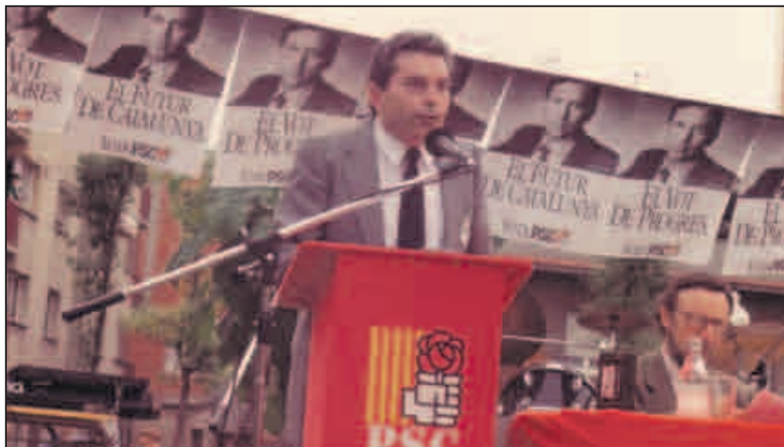
José Luis López, durant un míting del PSC a les eleccions autonòmiques de l'any 1988.