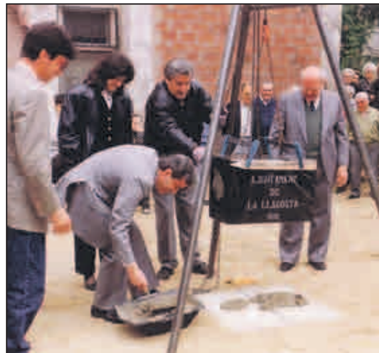
1991. Col·locació de la primera pedra de l'edifici del Casal d'Avis.

A les eleccions del 1979, va ser escollit regidor i va formar part del govern de coalició de l'Ajuntament de la Llagosta amb el PSUC com a edil de Joventut, Esports i Festes. El 1984 va ser elegit alcalde de la Llagosta. El 22 de novembre de 2002 va presentar la dimissió.