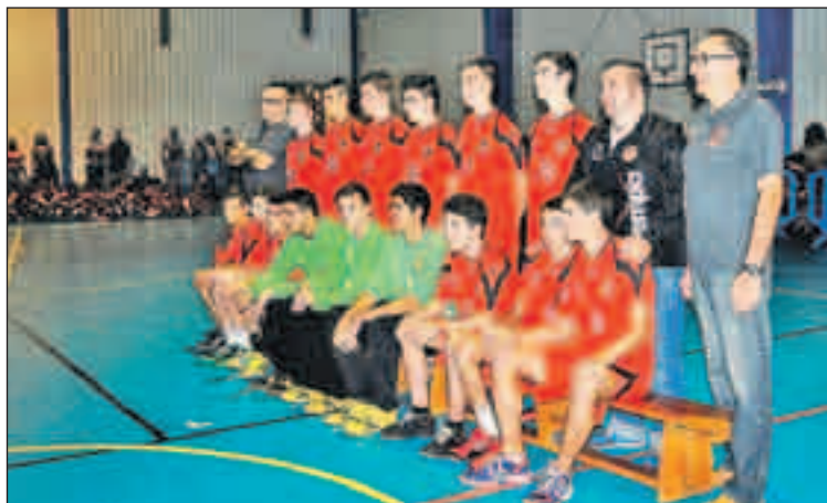
Acte de presentació dels equips del Joventut Handbol la Llagosta.