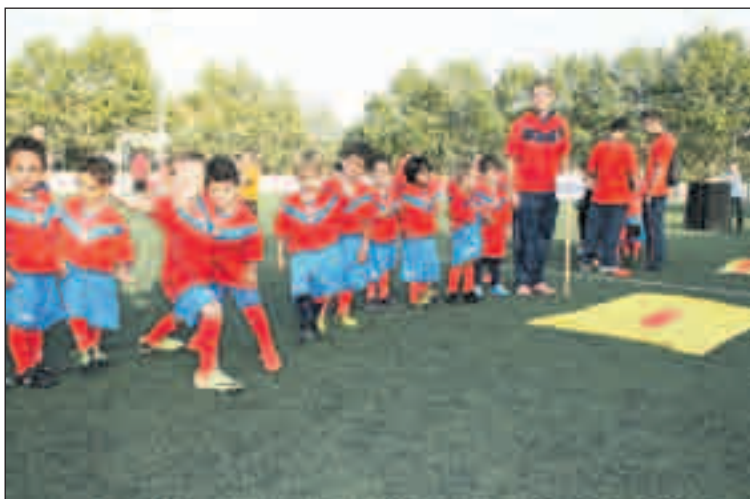
Infants dels conjunts de base, durant l'acte de presentació del club.

El primer equip del Club Esportiu la Llagosta està protagonitzant un gran inici de temporada. Els llagostencs, que són líders del grup 9 de la Quarta Catalana, han guanyat els set partits que han disputat. Dissabte van derrotar el Vallgorguina per 0 a 3