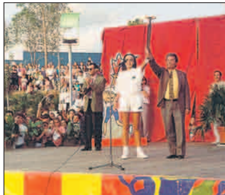
L'arribada a la Llagosta de la torxa dels Jocs Paralímpics de 1992.