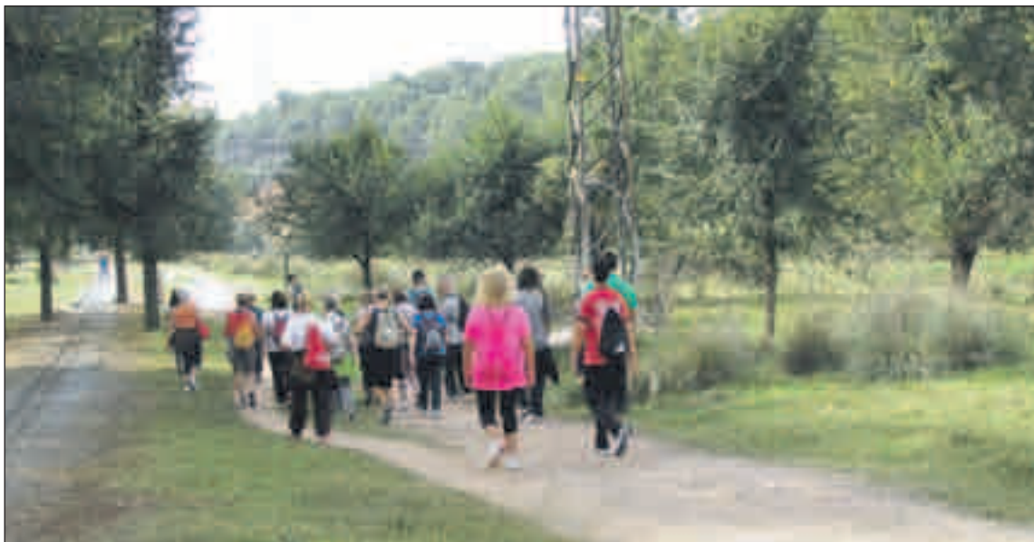
Participants a la passejada Mai caminaràs sola , organitzada per l'entitat local Veus de Dona.

L'Ajuntament va aprovar per unanimitat durant el ple extraordinari que va celebrar el 24 d'octubre un manifest en commemoració del Dia internacional de la no violència contra les dones. El text porta per títol Davant la violència, no callis!