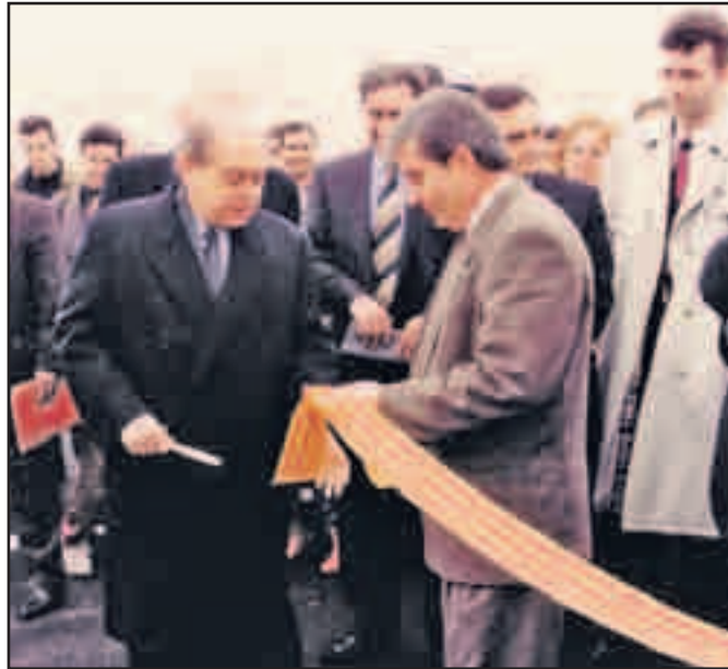
Tallant la cinta que obria al trànsit la variant de la C-17, el 1993.