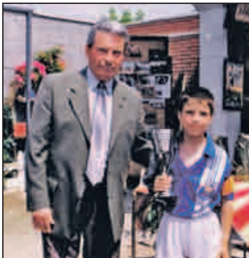
Lliurant un premi al CD la Concòrdia a principis d'aquest segle en el nou camp de futbol.