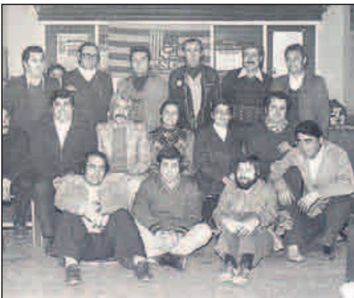
Amb els companys de la primera candidatura que va presentar el PSC a la Llagosta a les primeres eleccions municipals, el 1979.