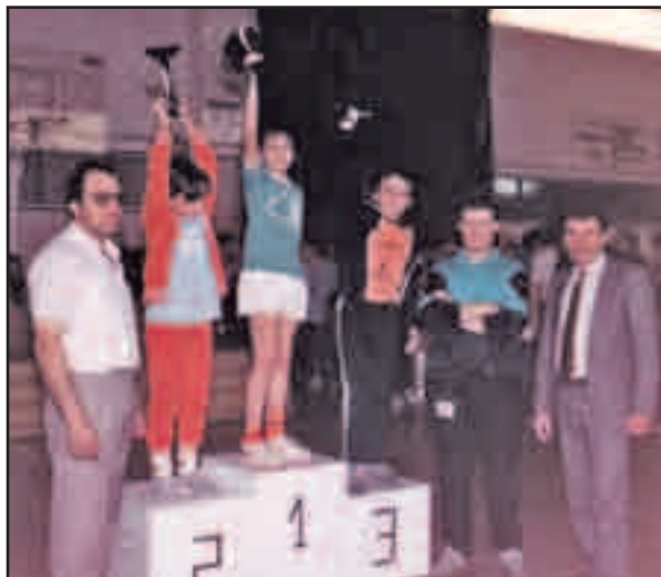
Clausura dels Jocs Esportius Escolars de la temporada 1989-1990 a l'antic pavelló poliesportiu.