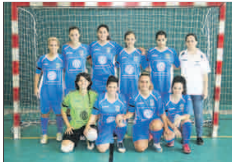
Plantilla del CD la Concòrdia d'aquesta temporada (2013-14).

Després d'un gran inici de lliga amb quatre victòries seguides i liderant el grup, el conjunt llagostenc només ha estat capaç de sumar un punt en les dues darreres jornades. El dia 26 d'octubre va patir la primera derrota de la temporada en caure a la pista de l'AECS l'Hospitalet per un clar 5 a 0. Les de l'Hospitalet, que aquesta temporada s'han reforçat amb jugadores procedents de la Divisió de Plata, van plantejar un