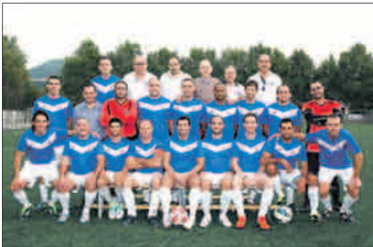
La plantilla del Club Deportivo Viejas Glorias de la Llagosta.

El Club Deportivo Viejas Glorias ha recuperat el liderat després de guanyar dissabte per 5 a 1 el Castic i que el fins ara primer classificat, el Juan XXIII,