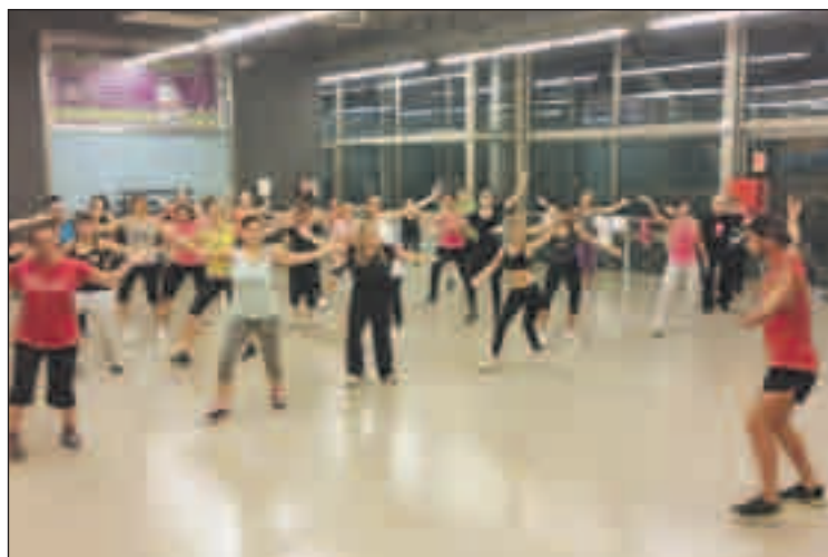
Classe de Zumba, al Complex Esportiu Municipal El Turó.

A més, les millores que s'han efectuat al complex i el correcte manteniment que es fa actualment de les instal·lacions "han permès reduir d'un 60% el nombre de queixes per part de les persones usuàries", segons Macías. El conseller