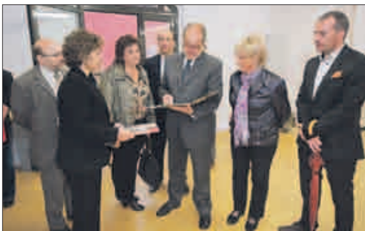
Inauguració del CREVE

Els ajuntaments de la Llagosta, Santa Perpètua de Mogoda, Palau-solità i Plegamans, Polinyà i Sentmenat, que formen l'Eix de la riera de Caldes, han posat en marxa el Centre de Recur-